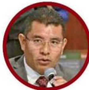
Daniel Gutiérrez, diputado.

La propuesta que busca revivir el diputado Daniel Gutiérrez argumenta la necesidad de regular la figura del crédito de nómina, al ser fuente de acceso al financiamiento al consumo de muchos trabajadores, por lo que se sugiere que la cobranza de este tipo de préstamos sea encomendada a un tercero (que sería el empleador), a excepción de los créditos otorgados por el Infonavit, Fovissste o el Infonacot.