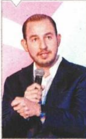
MARKO CORTÉS Dirigente nacional del PAN

"Queda claro que somos competitivos juntos, si vamos juntos tenemos la certeza y la fortaleza de ganar las elecciones"