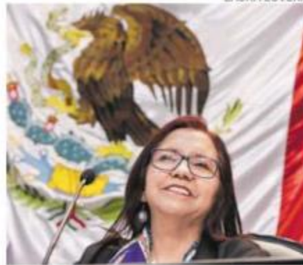
Leticia Ramírez, titular de la SEP