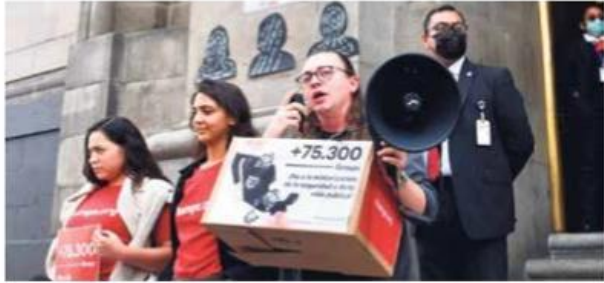
RECLAMO. Activistas, ayer, afuera de la Suprema Corte de Justicia.