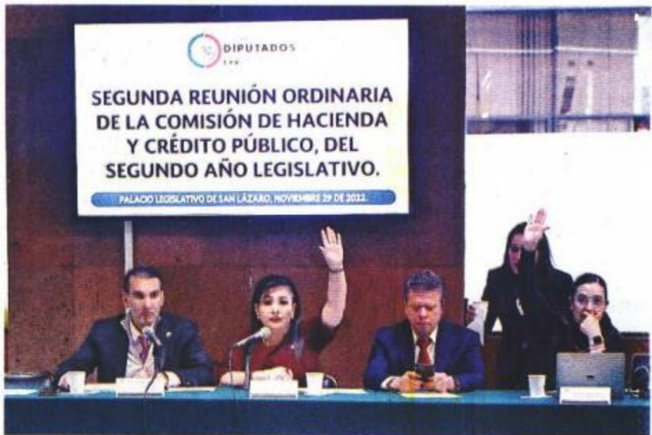
La iniciativa de cobranza delegada se iba a dictaminar ayer en la Comisión de Hacienda de la Cámara de Diputados, pero se bajó de última hora.