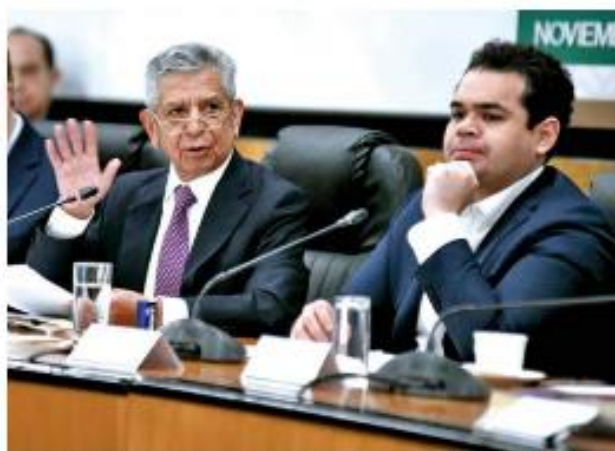
DATOS. El funcionario también comentó sobre los 129 mil contratos registrados en Compranet y las irregularidades en Segalmex por 11 millones de pesos.

"También es importante que se sepa que el 30 de abril de 2021 se inició el procedimiento de responsabilidades administrativas por po-