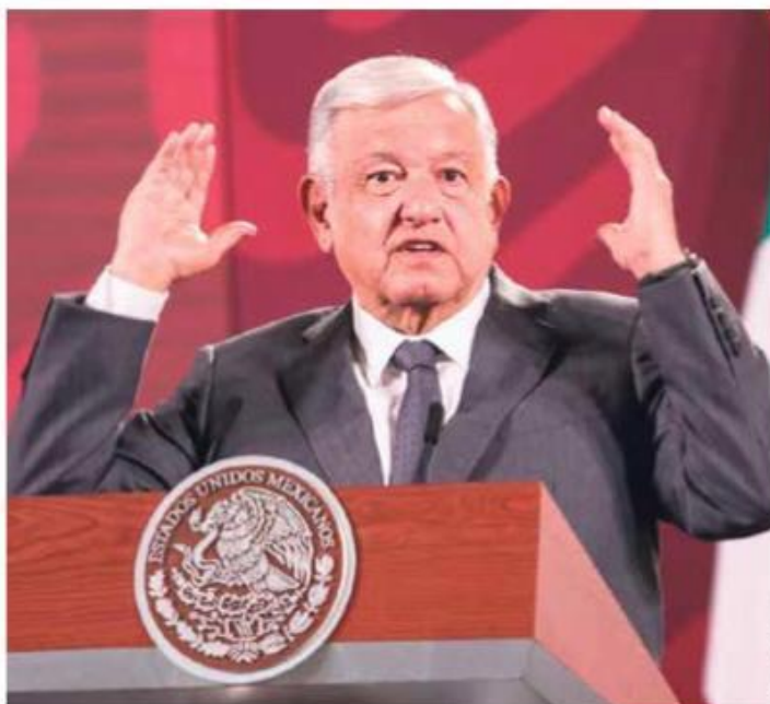
LLAMADO. El presidente Andrés Manuel López Obrador, ayer.

VOTARÁN "EN CONTRA DE LO QUE QUIERE EL PUEBLO"