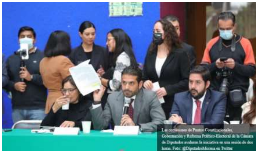
Las comisiones de Puntos Constitucionales, Gobernación y Reforma Político-Electoral de la Cámara de Diputados evalúan la iniciativa en una sesión de dos horas.