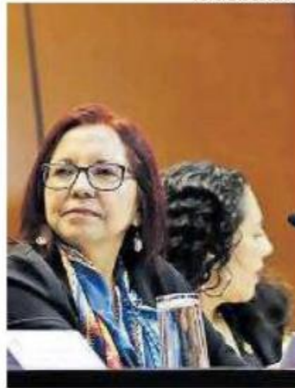
Compareció ante los diputados.

El proyecto educativo está orientado a garantizar el derecho a la educación de niñas, niños, adolescentes y jóvenes del país