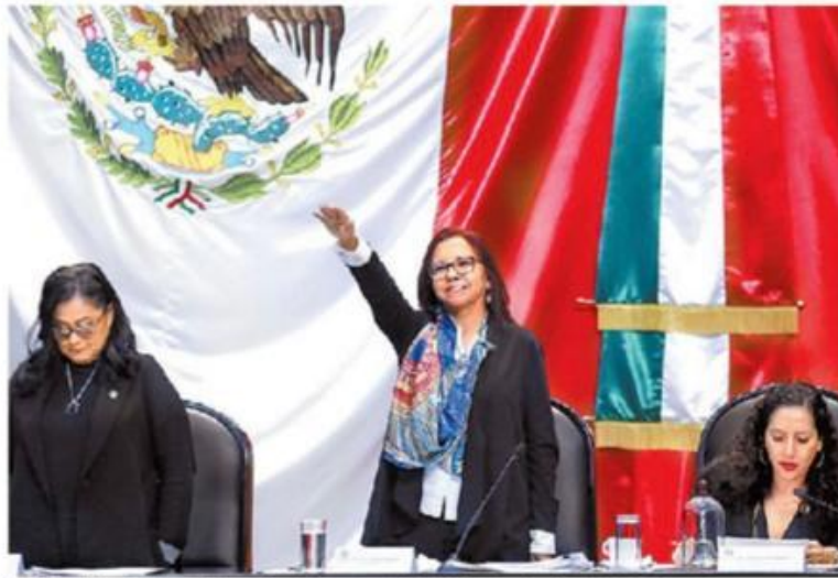
La Comisión de Educación en San Lázaro cuestionó a la secretaria. JUAN C. BAUTISTA