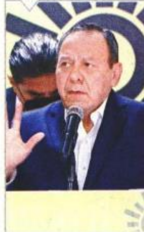
JESÚS ZAMBRANO Dirigente nacional del PRD

"Buscaremos sumar a las diferentes fuerzas políticas opositoras, para evitar se pulverice el voto y juntos corregir el rumbo de México"