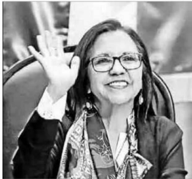
▲ La confianza con las comunidades escolares no se condiciona ni se negocia, dijo la funcionaria ante los legisladores.