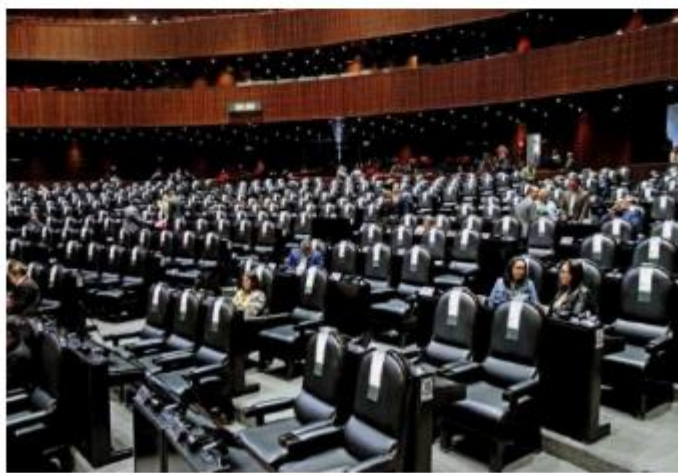
VOTACIÓN. El dictamen fue votado en una sesión semipresencial, donde las curules lucieron vacías por el partido de México vs. Arabia Saudita.

El dictamen fue enviado al Senado de la República para su revisión, dictaminación y votación.