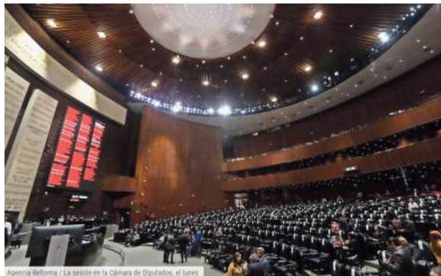
La sesión en la Cámara de Diputados, el lunes