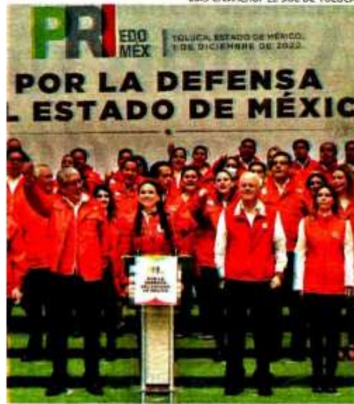
El Tricolor alista cuadros para le elección