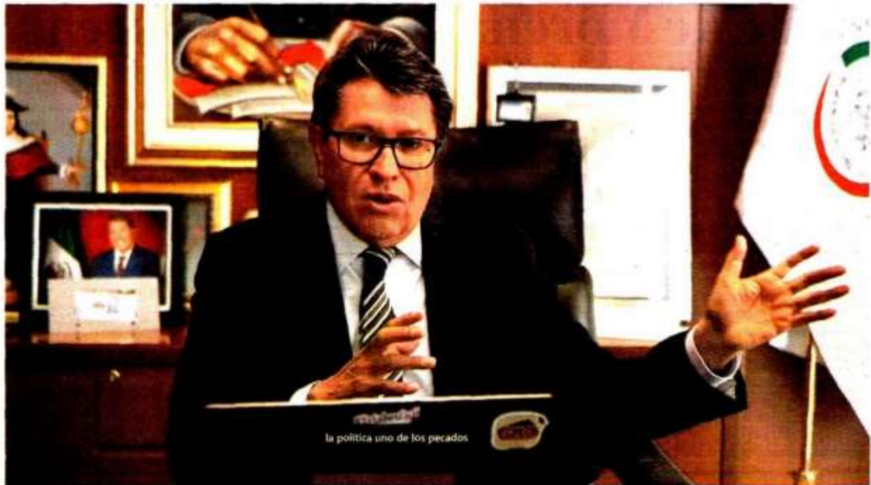
El senador detalló algunos puntos de la iniciativa del Presidente en rueda de prensa. ESPECIAL