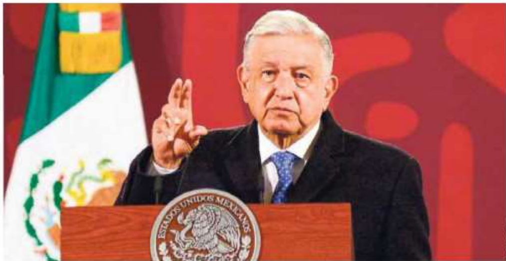
POSTURA. El presidente Andrés Manuel López Obrador, ayer.