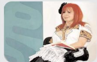
Layda Sansores San Román