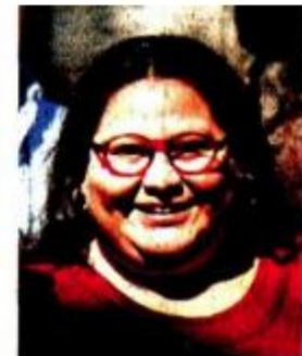
Citlalli Hernández, secretaria general de Morena.