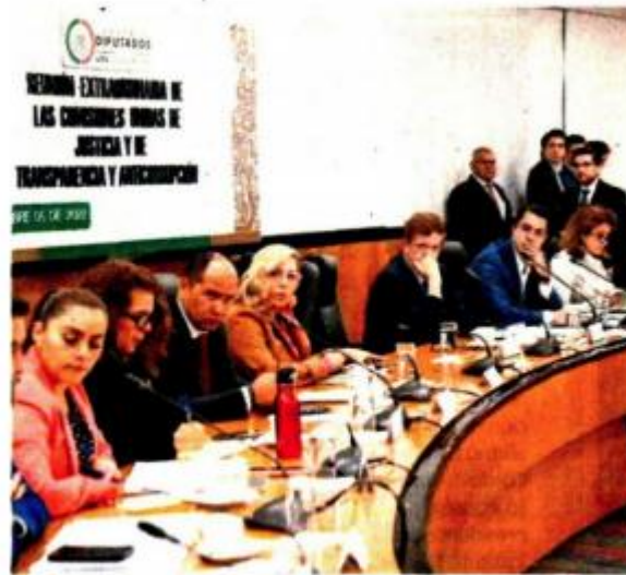
Legisladores retomarán hoy la sesión a las 11:00 horas.