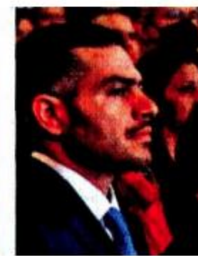
Omar García Harfuch, jefe de la Policía de la CDMX.