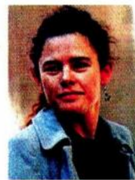
Luisa María Alcalde, secretaria federal de Trabajo.