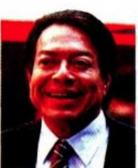
Mario Delgado, presidente nacional de Morena.