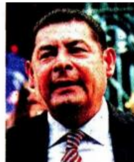
Alejandro Armenta, presidente del Senado.