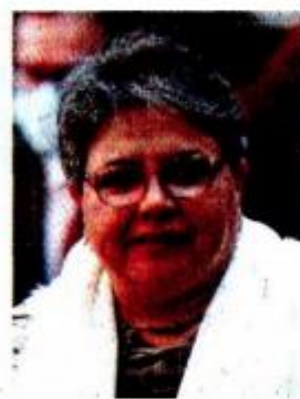
Raquel Buenrostro, secretaria federal de Economía.