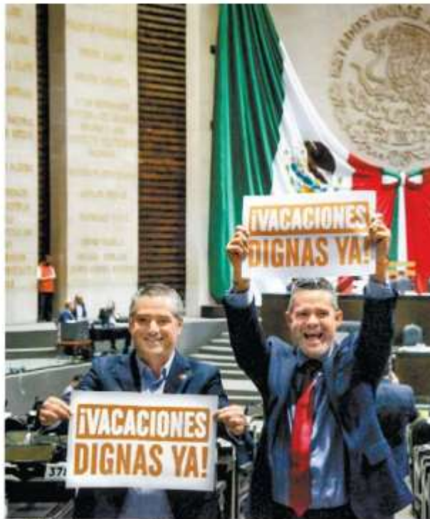
La iniciativa se aprobó por unanimidad.