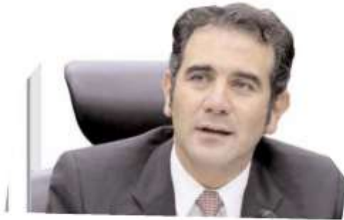
Lorenzo Córdova Vianello