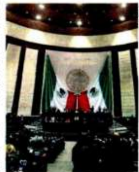
El pleno de la Cámara avaló la reforma.

"El transitorio (...) no hace más que refrendar que se incluya a esos magistrados (...) no hay un 'traje hecho a la medida'"