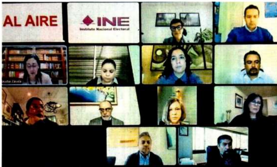
Integrantes de la Comisión Temporal de Presupuesto del Instituto Nacional Electoral avalaron los ajustes al presupuesto del órgano para el año que entra, en el que se refleja el recorte aprobado por la Cámara de Diputados.

"Cabe mencionar que el recorte [presupuestal] del [Poder] Legislativo no modifica el monto asignado a las prerrogativas de los partidos políticos"