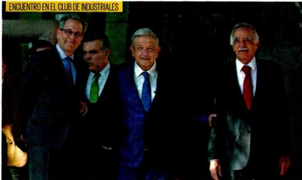
ENCUENTRO EN EL CLUB DE INDUSTRIALES