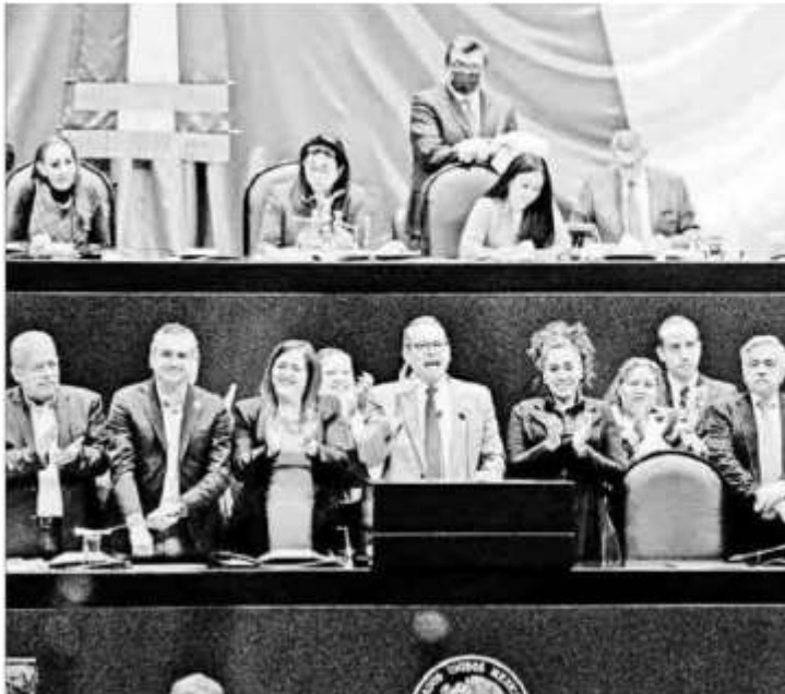
La minuta avalada por los diputados ayer será devuelta a la Cámara alta para que sea votada el próximo martes y entre en vigor a principios del próximo año.

Enrique Méndez, Georgina Saldierna, Andrea Becerril y Víctor Ballinas