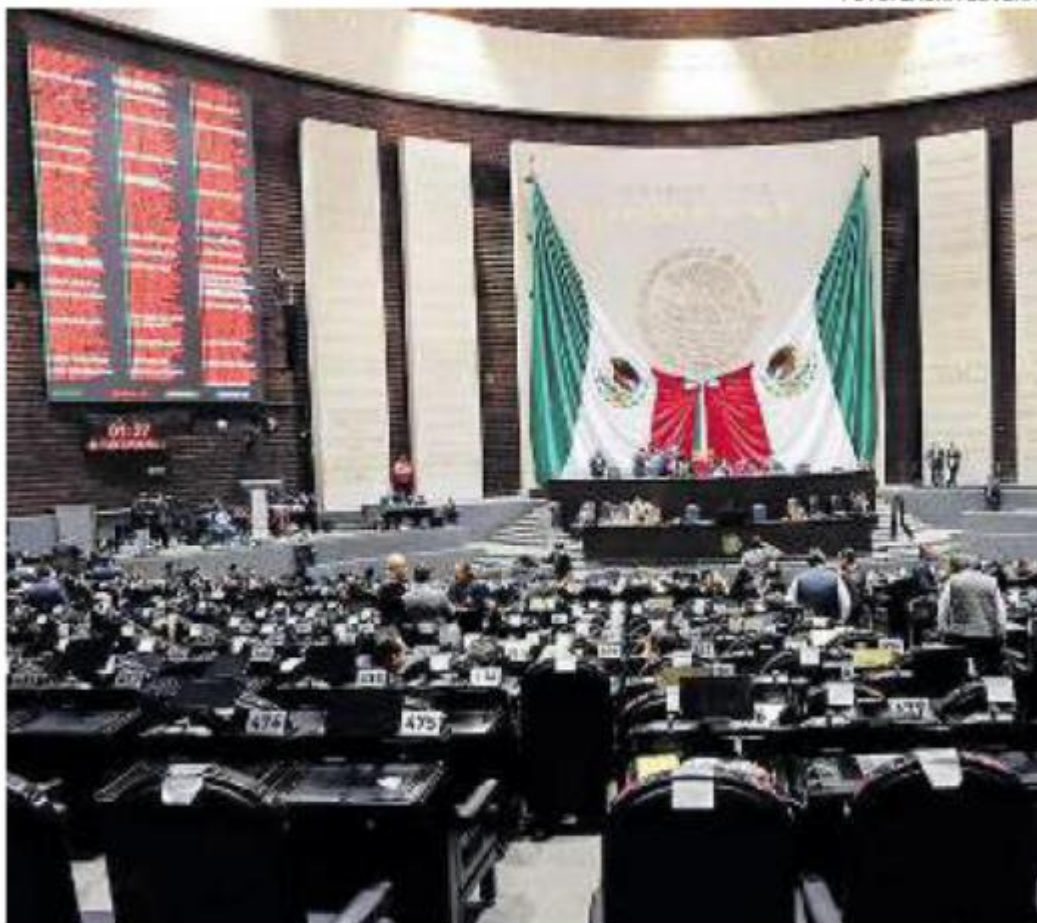
El pleno de la Cámara de Diputados durante la sesión ordinaria.