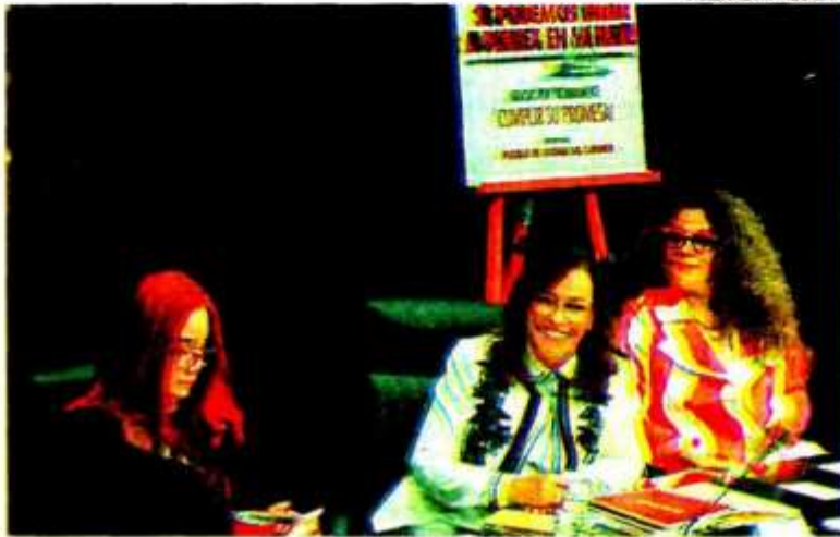
Rocio Nahle, en su comparecencia ante senadores