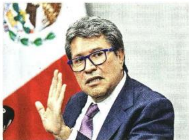
Ricardo Monreal dijo que en el Senado harán un análisis riguroso de la reforma electoral aprobada por los diputados.

Sé dónde estoy colocado, pero no estoy pensando en mi futuro, estoy pensando en que no se vioje la Constitución, nada más.