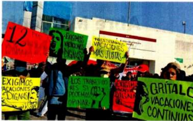
ENRIQUE CÓNEZ EL UNIVERSAL

Sindicalistas exigieron avalar los 12 días continuos de asueto y no diferir sels