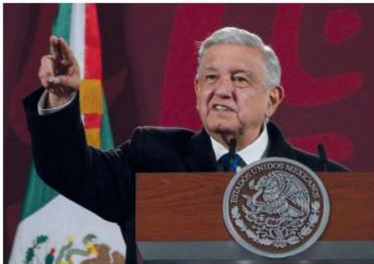
El presidente señaló que envió la iniciativa por un asunto de principios.