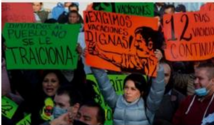
Integrantes de la CROC presionaron frente a la Cámara de Diputados .

Es decir, los diputados regresaron a lo que originalmente habían aprobado los senadores para aumentar los periodos vacacionales no solo en el primer año de trabajo, sino en toda la vida laboral •