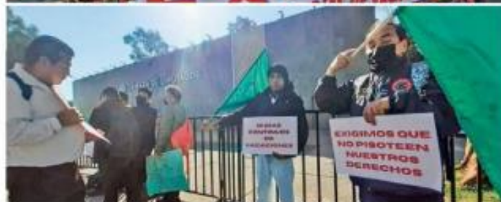
CERCO. Miembros de diversos sindicatos bloquearon el acceso de la Cámara de Diputados.