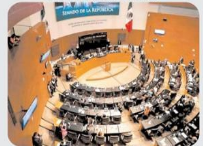
Senado de la República