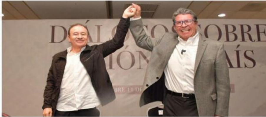
El coordinador de Morena en el Senado visitó Sonora, donde asistió a evento del gobernador Alfonso Durazo.

El coordinador de Morena en el Senado, Ricardo Monreal anunció la reunión con el encargado de la política interna del país y confirmó que la Cámara Alta devolverá a los dipu-