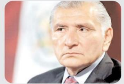
Adán Augusto López Hernández