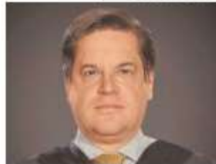
Ministro Alfredo Gutiérrez Ortiz Mena

2 El ministro Alfredo Gutiérrez Ortiz Mena sugiere profundizar los procesos administrativos de responsabilidad y la lucha contra la corrupción mediante la creación de la Unidad Especializada en Análisis y Prevención de Actos de Corrupción.