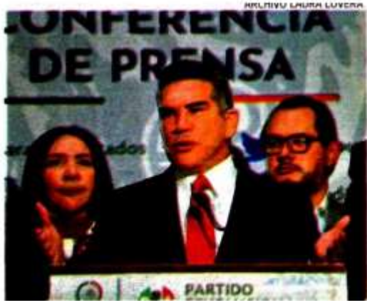
Alejandro Moreno en conferencia de prensa