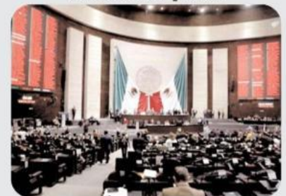
Cámara de Diputados