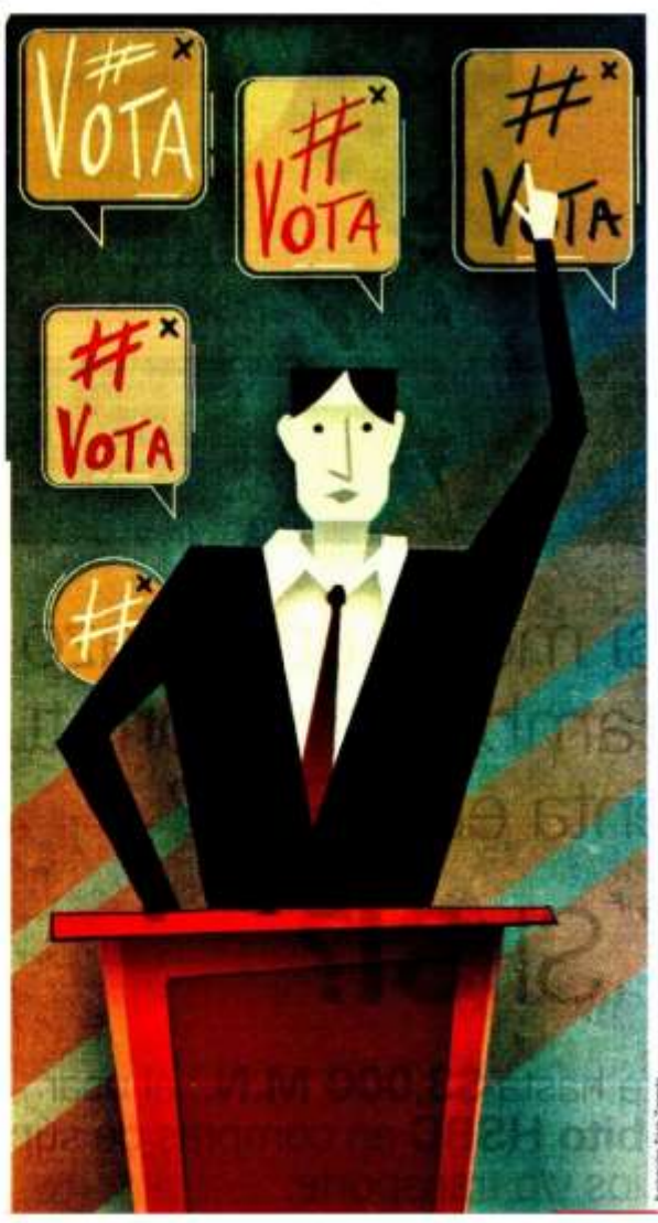
Ilustración: Eric Zayas

Para legisladores, la minuta tiene un porcentaje elevado de disposiciones inconstitucionales que violentan diferentes artículos