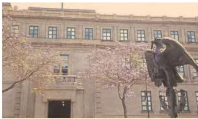
El máximo tribunal del país anunció que tras una petición de la Mesa Directiva de la Cámara baja se dará prioridad a resolver los proyectos sobre militarización.