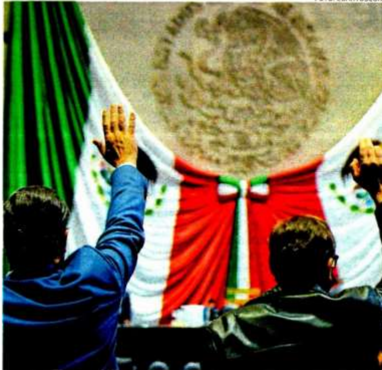
Los efectos de las disminuciones que realizaron los diputados no se observan en el Índice de Seguimiento al Desempeño de la Secretaría de Hacienda.