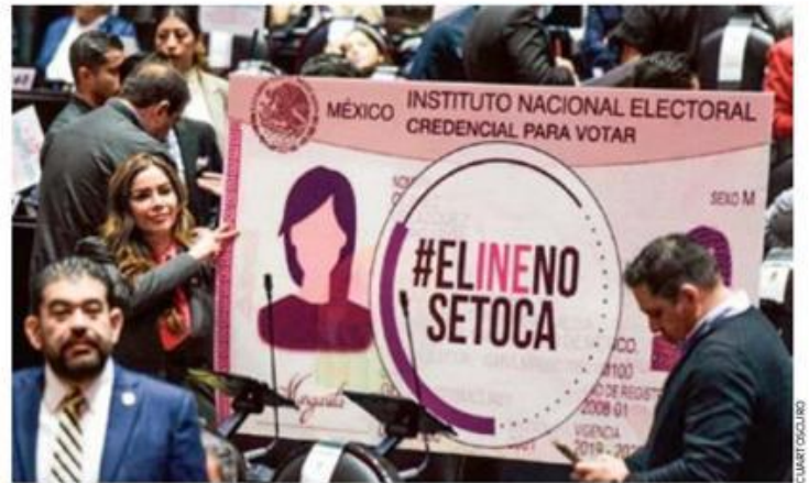
SEÑALAMIENTOS. Legisladores de oposición remarcaron que con el Plan B sigue en riesgo la fortaleza del INE; además de los riesgos para la democracia.