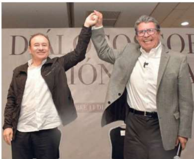
Monreal Ávila y Alfonso Durazo durante su encuentro en Sonora. Especial

"En Sonora vivimos un ejemplo de respeto y civilidad, en un espacio donde expresamos nuestra voz sin gritos ni descalificaciones, porque así se construyen las ideas para un México próspero".