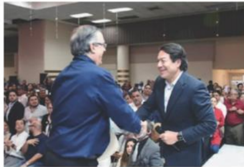
5 "Corcholatas" son los posibles candidatos a la Presidencia EL CANCELLER Marcelo Ebrard (izq.) con el líder de Morena, Mario Delgado, ayer, en NL.

EL CANCELLER entrega al líder nacional de Morena una carta con propuestas para el proceso interno; llama a realizar debates entre los aspirantes del partido, el primer semestre del 2023