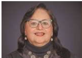
Ministra Norma Piña Hernández

Se requiere, desde su visión, trabajar en conjunto a través de Comisiones sobre los ejes centrales de mayor interés, tales como la Administración, los Procedimientos Administrativos de Responsabilidad, la Transparencia, la política de cero tolerancia al acoso sexual, hostigamiento, discriminación, nepotismo y corrupción, entre otros.