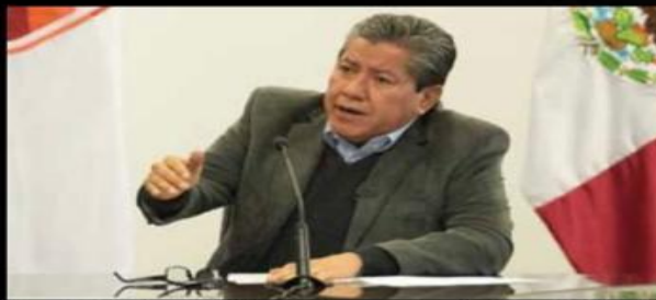
Además de las irregularidades en el presupuesto educativo, el Gobierno de Monreal Ávila ha tenido traspiés en el ámbito de la seguridad pública.

El órgano fiscalizador señala que mientras la Secretaría federal cumplió con la entrega del "Importe convenido Federal" que representó un monto por 613 millones 059 mil 900 pesos, el "Importe convenido Estatal" que debía transferir el Gobierno de Zacatecas por 611 millones 239 mil 100 pesos quedó incompleto