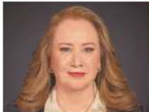
Ministra Yasmín Esquivel Mossa

1 Desde la óptica de la ministra Yasmín Esquivel Mossa, la consolidación de la democracia requiere de un Poder Judicial fuerte, garante de la Constitución y los derechos humanos, que emita determinaciones capaces de transformar a la sociedad y coadyuvar a la solución de los problemas de desigualdad enraizados en México.