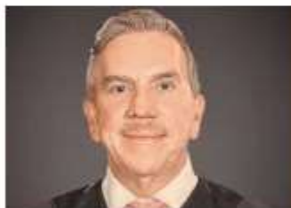
Ministro Javier Laynez Potisek

Por ello propone que el PJF lleve una bitácora del cumplimiento de sentencias de amparo con el fin de tener un padrón anual de autoridades omisas y contumaces, que servirá para dar vista al Ministerio Público Federal, a la Cámara de Diputados y a la Auditoría Superior de la Federación.