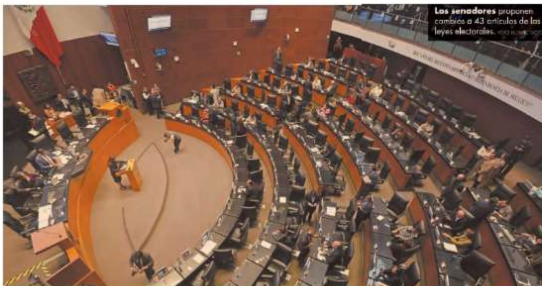
Los senadores proponen cambios a 43 artículos de las leyes electorales. Ver más fotos

Hoy sesionarán las comisiones de Gobernación y Estudios Legislativos Segunda. Y se prevé que el nuevo proyecto se discuta en el pleno mañana martes 13 de diciembre.