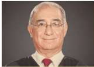
Ministro Alberto Pérez Dayán

4 El ministro Alberto Pérez Dayán considera que para hacer efectiva una política de cero tolerancia a la corrupción es preciso desvincular la Contraloría del P.J.F. de la Presidencia del Alto Tribunal y del CJF, porque debe ser un área autónoma que no guarde dependencia para el correcto desempeño de sus funciones.