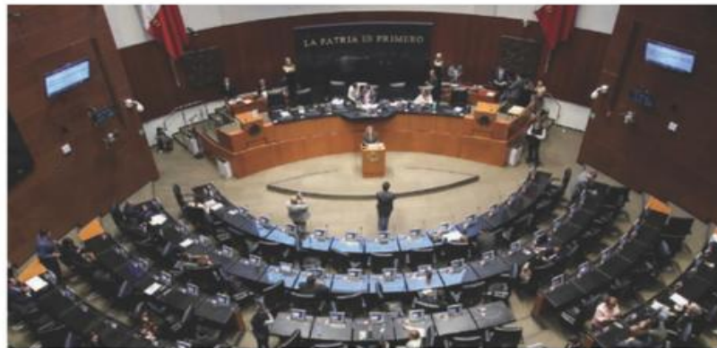
SESIÓN ordinaria en el Senado de la República, el pasado 9 de noviembre.