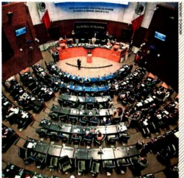
Las comisiones unidas de Gobernación y Estudios Legislativos Segunda del Senado sesionarán este lunes para aprobar los dictámenes del plan B de la reforma electoral.