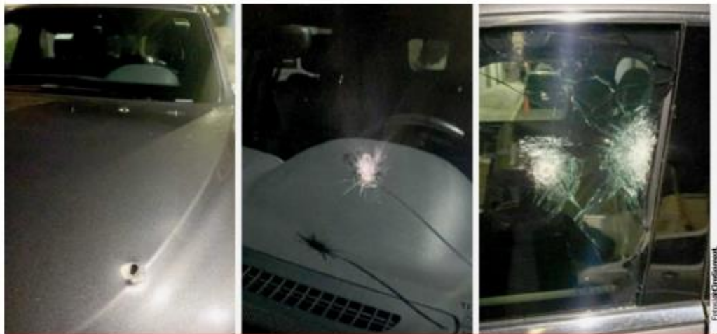
IMPACTOS de bala en el vehículo del comunicador.