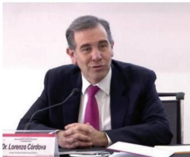
EL CONSEJERO presidente, Lorenzo Córdova Vianello, ayer.

EL CONSEJERO PRESIDENTE. Lorenzo Córdova, dice que los trabajadores se acogieron al retiro voluntario; confía en que sigan fieles a su labor pese a su retiro de la institución