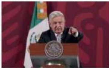
El presidente Andrés Manuel López Obrador.