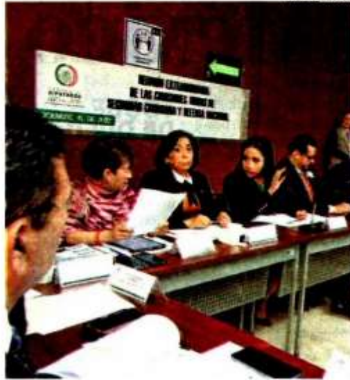
Reunión de las comisiones de Seguridad Ciudadana