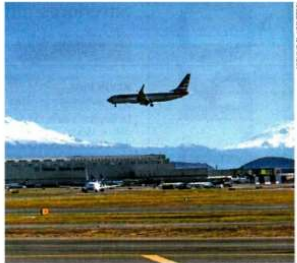
Sedena y SICT serían las responsables del uso leal del espacio aéreo, se destaca en el dictamen aprobado en comisiones.