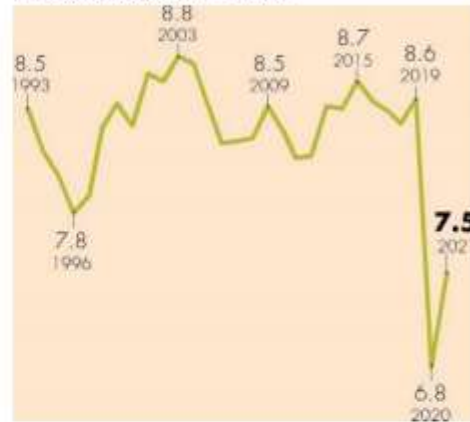
Turístico como % del PIB total*