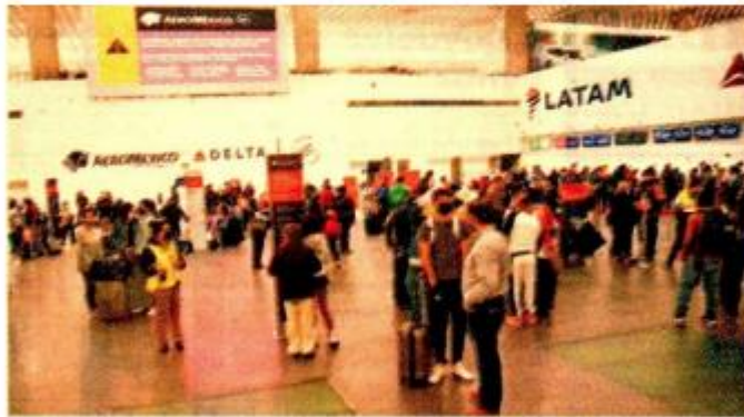
La flota aérea comercial de EU se compone por más de 5,000 aeronaves, mientras que la flota mexicana no llega ni a los 400 aviones.

La ASPA calificó como "un error rotundo" la iniciativa enviada por el presidente de la República o la Cámara de Diputados para modificar la ley de Aviación Civil.