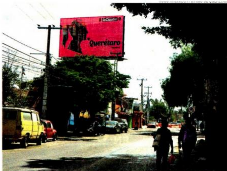
El martes aparecieron en Querétaro varios espectaculares alusivos a la jefa de Gobierno

VOCEROS de Claudia Sheinbaum aseguran que no saben quién pagó los espectaculares, que son apoyo