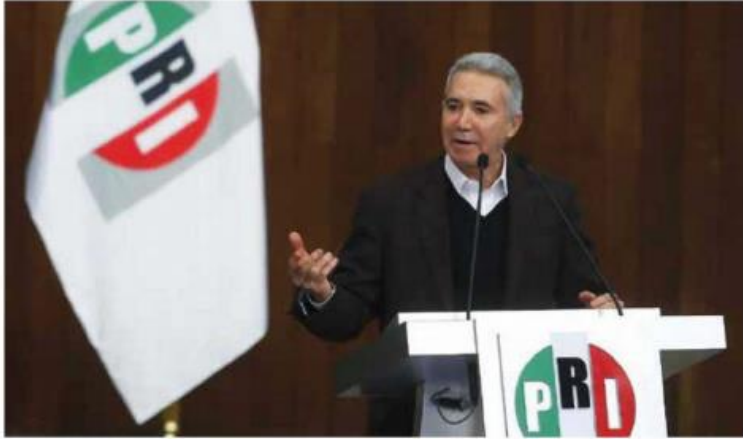
• IDENTIDAD. Los cambios aprobados van contra los lineamientos democráticos del partido, dijo.