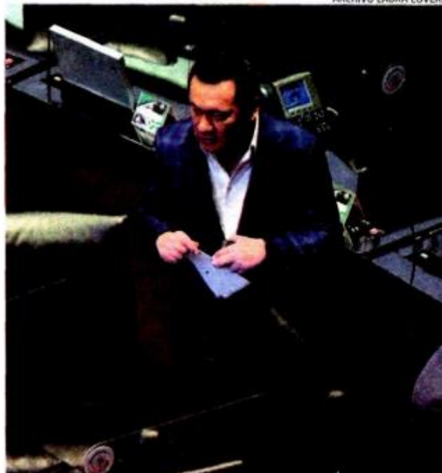
El senador priista Miguel Ángel Osorio Chong