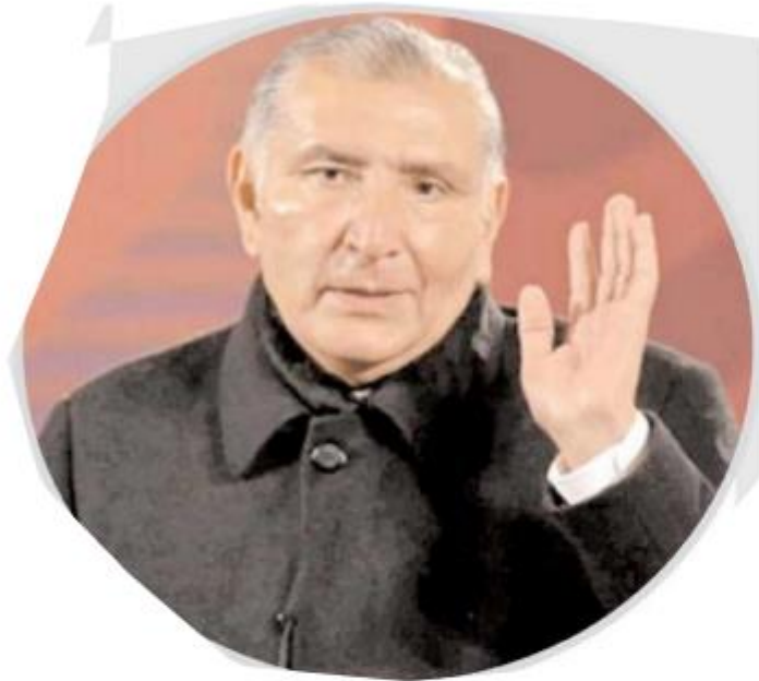
Secretario de Gobernación, Adán Augusto López