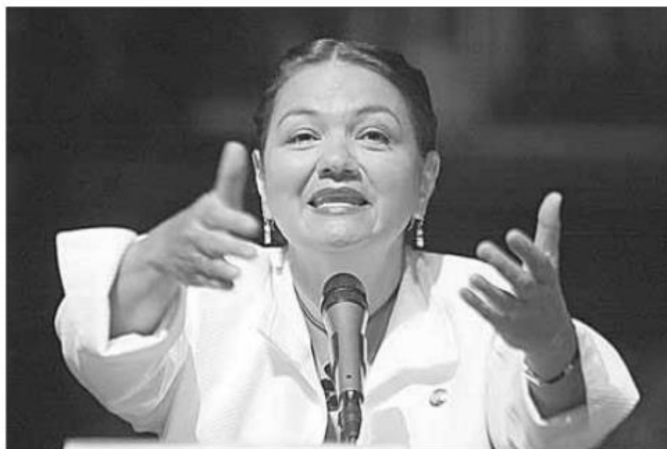
► Dulce María Sauri Riancho señaló que con la propuesta de una Secretaría de Asuntos Religiosos en el PRI, Plutarco Elías Calles "debe haber dado 18 vueltas en su tumba".