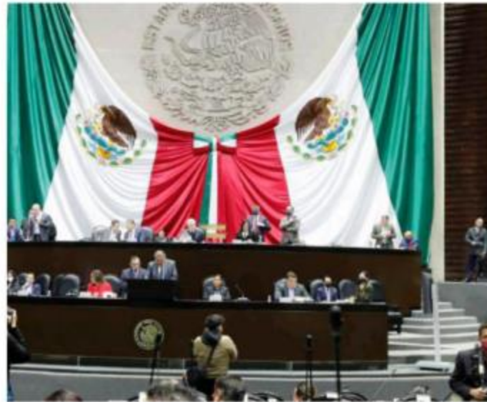
El nombramiento se decidirá hasta enero o febrero próximo.

La semana pasada y de último minuto se remitió el nombramiento del exgobernador