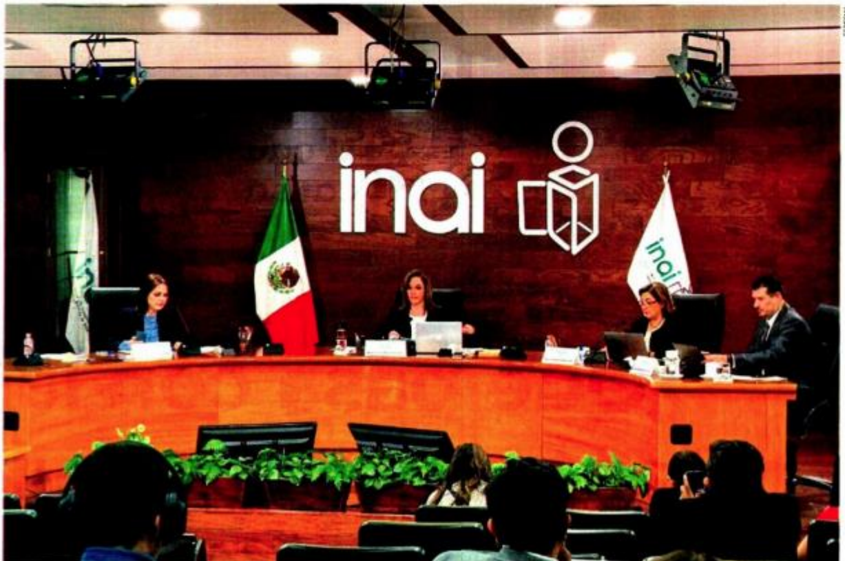
La propuesta principal es modificar la composición del pleno del Inai para poder sesionar en caso de que falten integrantes.

"Hemos venido trabajando en estas semanas para analizar de qué manera podemos contribuir para mejorar el marco normativo"