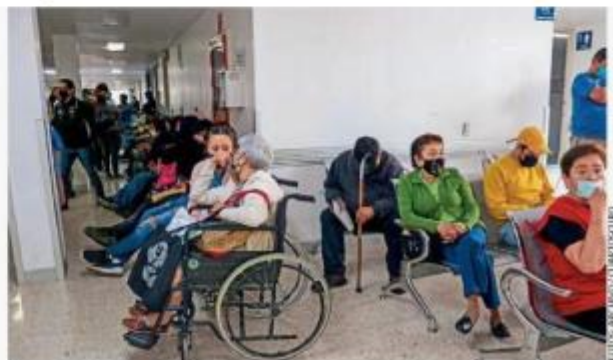
CONTRASTE. Mientras la Refinería de Dos Bocas todavía no refina nada, el sector Salud sufrió en la atención a usuarios.