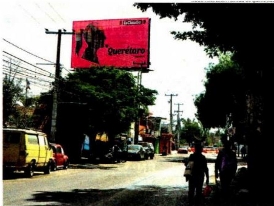
El martes aparecieron en Querétaro varios espectaculares alusivos a la jefa de Gobierno

VOCEROS de Claudia Sheinbaum aseguran que no saben quién pagó los espectaculares, que son apoyo