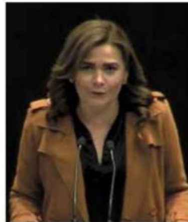
POSTURA. María Josefina Gamboa , diputada del PAN, ayer.

La propuesta. La iniciativa de reforma legal, presentada por legisladores de Acción Nacional, busca incluir en el Código Penal Federal un apartado de delitos que atentan contra el ejercicio al derecho de información, acceso a información y también el derecho de imprenta.