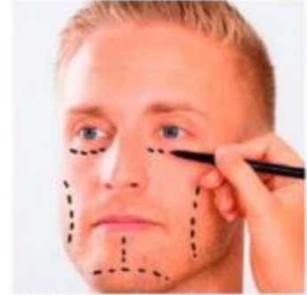
México, tercer lugar de procedimientos estéticos totales en el mundo.

En 2017, la Comisión Nacional de Arbitraje Médico (CoNaMed), realizó un estudio de 2002 a 2017, en el cual registra que existieron 654 quejas por práctica deficiente de los médicos especialistas en Cirugía Plástica, Estética y Reconstructiva. Las mujeres registran la mayor demanda de tratamientos quirúrgicos con: 86.4% (20 millones 207 mil 190 de tratamientos cosméticos a nivel mundial)• (Alejandro Páez Morales)