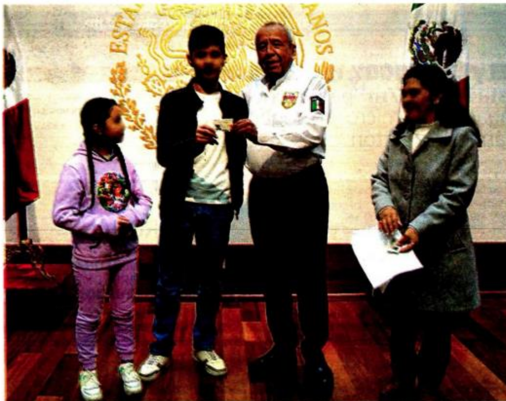
El comisionado del INM, Francisco Garduño, entregó documentos migratorios a la familia de Pedro Castillo

EL PRIMER ministro de Perú, Alberto Otalora, pidió al señor López (AMLO) ya no pronunciarse sobre asuntos de su país