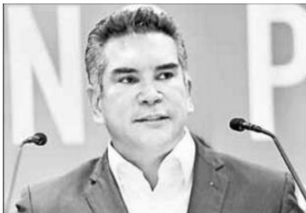
▲ Moreno Cárdenas maniobró para mantenerse en la dirigencia del Revolucionario Institucional hasta 2024.