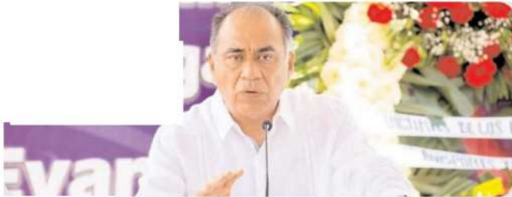
Héctor Astudillo, exgobernador de Guerrero