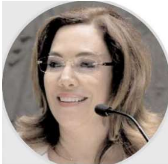
Blanca Lilia Ibarra, presidenta del Inai

En la propuesta se pretende regular la portabilidad ; "hoy yo puedo llevarme mi número de celular a otra compañía, pero entre particulares no se contempla portabilidad", así como regular el tema de la vulneración a datos de particulares, destacó entre otras inquietudes.