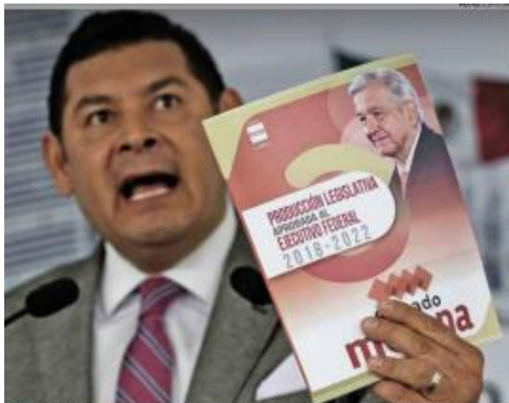
DESEOS. Alejandro Armenta ofreció un mensaje de fin de año para los trabajadores del Senado.