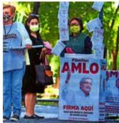
Morena acusó al INE de querer sabotear la consulta de revocación de mandato.

MILLONES DE PESOS pidió el INE de presupuesto, pero sólo le dieron mil 500.