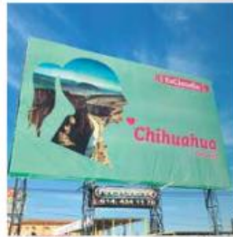
CAMPAÑA. Uno de los espectaculares pagados por diputados de Morena.

"No podemos normalizar que violen la Constitución, no podemos quedarnos con los brazos cruzados", dijo.— Pedro Hirtart