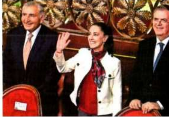
Adán Augusto López, Claudia Sheinbaum Pardo y Marcelo Ebrard Casaubon son las llamadas corcholatas de Morena.