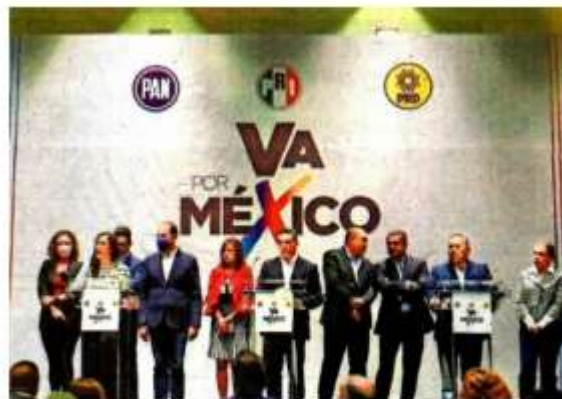
La coalición Va por México sufrió una fractura cuando el líder priista apoyó el uso de las Fuerzas Armadas en seguridad.

Integrantes del PAN, PRD y otros políticos de oposición señalaron que detrás del apoyo a la iniciativa estuvieron amenazas veladas contra el dirigente priista de acusarlo ante la justicia por supuestos actos de corrupción como gobernador de Campeche. ●