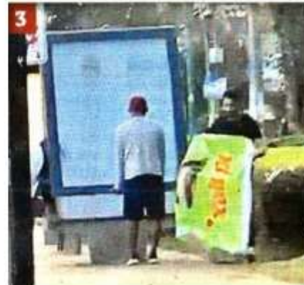
Doblan la publicidad para echarla a la unidad de transporte.