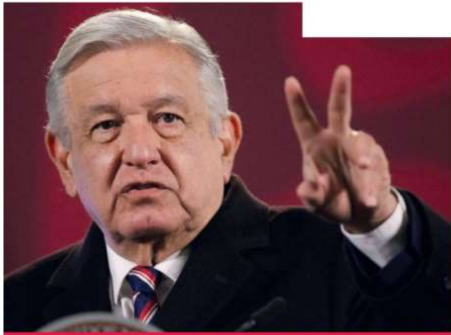
El jefe del Ejecutivo Andrés Manuel López Obrador.

"No me meto en eso, lo único que puedo decir es que tenemos un pueblo muy politizado (...) es un pueblo muy consciente entonces al que se quiere pasar de listo no le va bien"