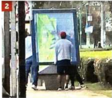
Despegan y retiran el cartel con la leyenda #EsClaudia.