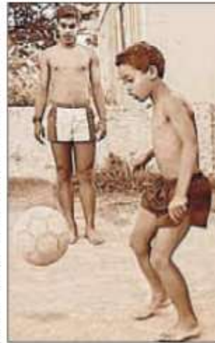
► El mandatario mexicano compartió una anécdota y una foto de la infancia de Ronaldinho para ejemplificar la influencia de Pelé.

A su vez, también en su cuenta de Twitter, Alejandro Moreno, dirigente nacional del PRI, declaró: “hoy el fútbol pierde a un hombre extraordinario, una leyenda que a lo largo de su carrera inspiró a muchas generaciones a través de la pasión por el deporte. Descanse en paz, Pelé”.