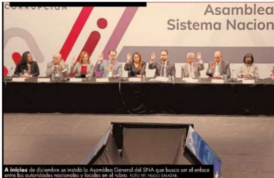
A inicios de diciembre se instaló la Asamblea General del SNA que busca ser el enlace entre las autoridades nacionales y locales en el rubro.