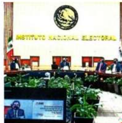
La reforma al Instituto Nacional Electoral ha sido el tema más polémico.

Los encontronazos entre el Presidente y su gobierno contra la autoridad electoral se han ido recrudeciendo en los últimos tiempos. ●