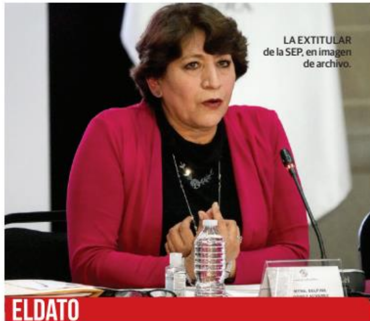
LA EXTITULAR de la SEP, en imagen de archivo.

PLANTEA que fallo en favor de la virtual candidata de Morena al Edomex se basó en un estudio que adolece de "motivación"; en política, la libertad de expresión ensancha la tolerancia, dice