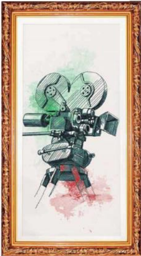
Comisión de Cultura y Cinematografía de la Cámara de Diputados