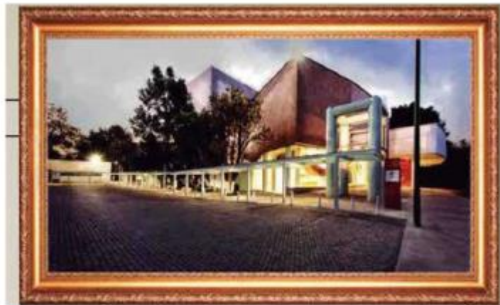
CENTRO CULTURAL DEL BOSQUE