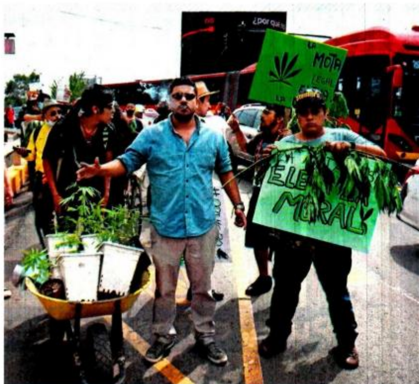
La ley sobre el uso lúdico de la cannabis es otro pendiente que espera aval en la Cámara Alta este año.