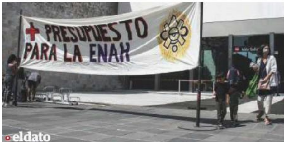
En marzo del 2021, estudiantes y maestros de la ENAH protestaron frente al Museo Nacional de Antropología e Historia para exigir alto a la cancelación de más de 100 materias optativas, de lenguas y medios audiovisuales, entre otros.

“LOS RESPONSABLES En diciembre lo y abuso” de laboratorio de firmamos, pero al la ENAH nos hacen parecer nos queda- firmar una hoja que mos sin empleo el 1 no es un contrato de enero. Todo está con seis meses para plagado de irregula- laborar en la ENAH. ridades, negligencia