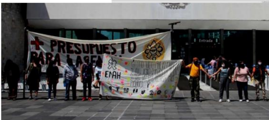
Manifestación en marzo de personal docente y estudiantes contra la reducción presupuestal de la institución.