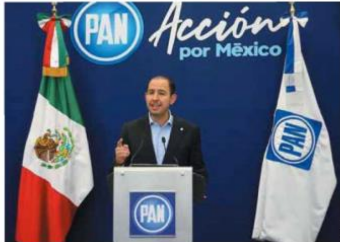
MENSAJE. Marko Cortés, líder nacional del PAN.