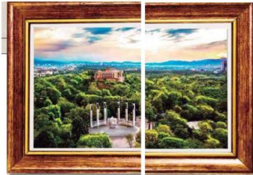
Complejo Cultural Bosque de Chapultepec