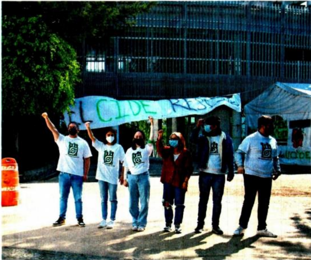
Estudiantes del CIDE el viernes pasado, cuando elementos de Protección Federal llegaron a resguardar las instalaciones que los alumnos mantienen tomadas como protesta por las decisiones del Conacyt sobre ese centro de estudios.