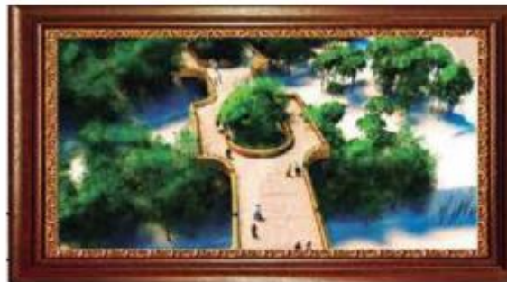
Complejo Cultural Bosque de Chapultepec