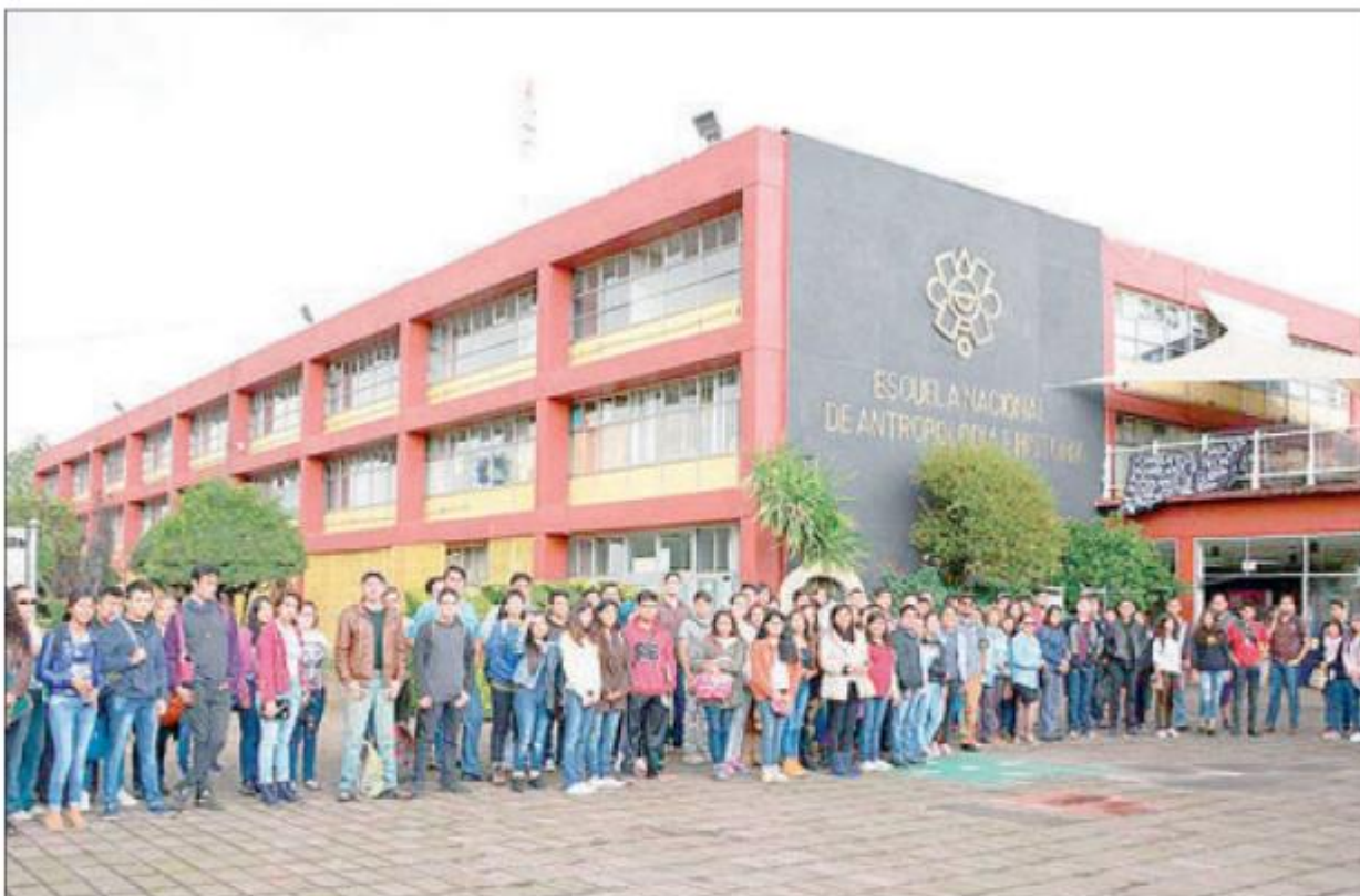
▲ La Asamblea General de la ENAH amagó con movilizarse si siguen los despidos y no se contrata al personal eventual. Imagen de la generación 2017-2021.