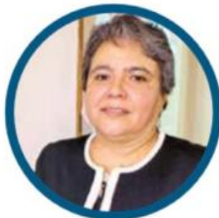
Raquel Buenrostro, jefa del SAT.

Detalló que, al contar con su RFC y su firma electrónica,