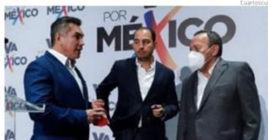
Dirigentes del PRI, PAN y PRD.

"En 2022 el desabasto de medicamentos no debe continuar. El Gobierno Federal tiene que garantizar el abasto de insumos para la atención médica de todos los mexicanos" afirmó. (Alejandro Páez) ●