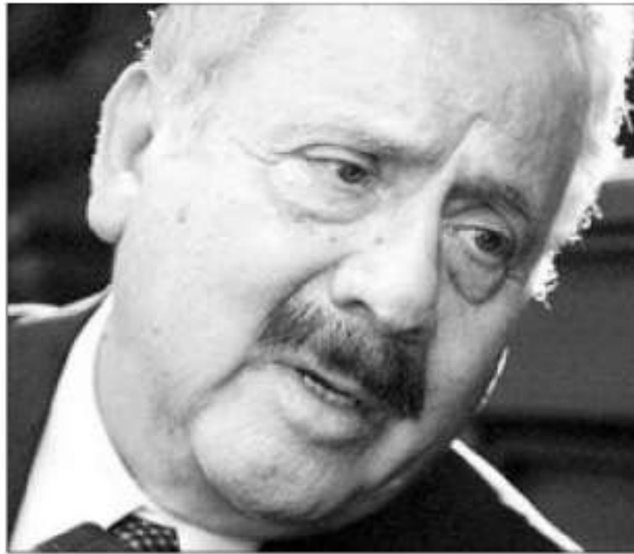
▼ El decano de los diputados anunció un libro de memorias de un grupo de 30 políticos de esa época.

–Todos los presidentes, como lo asumió Díaz Ordaz, son responsables de lo que, desde el punto de vista político, ocurre durante su gestión. El rubro judicial corresponde a los tribunales.