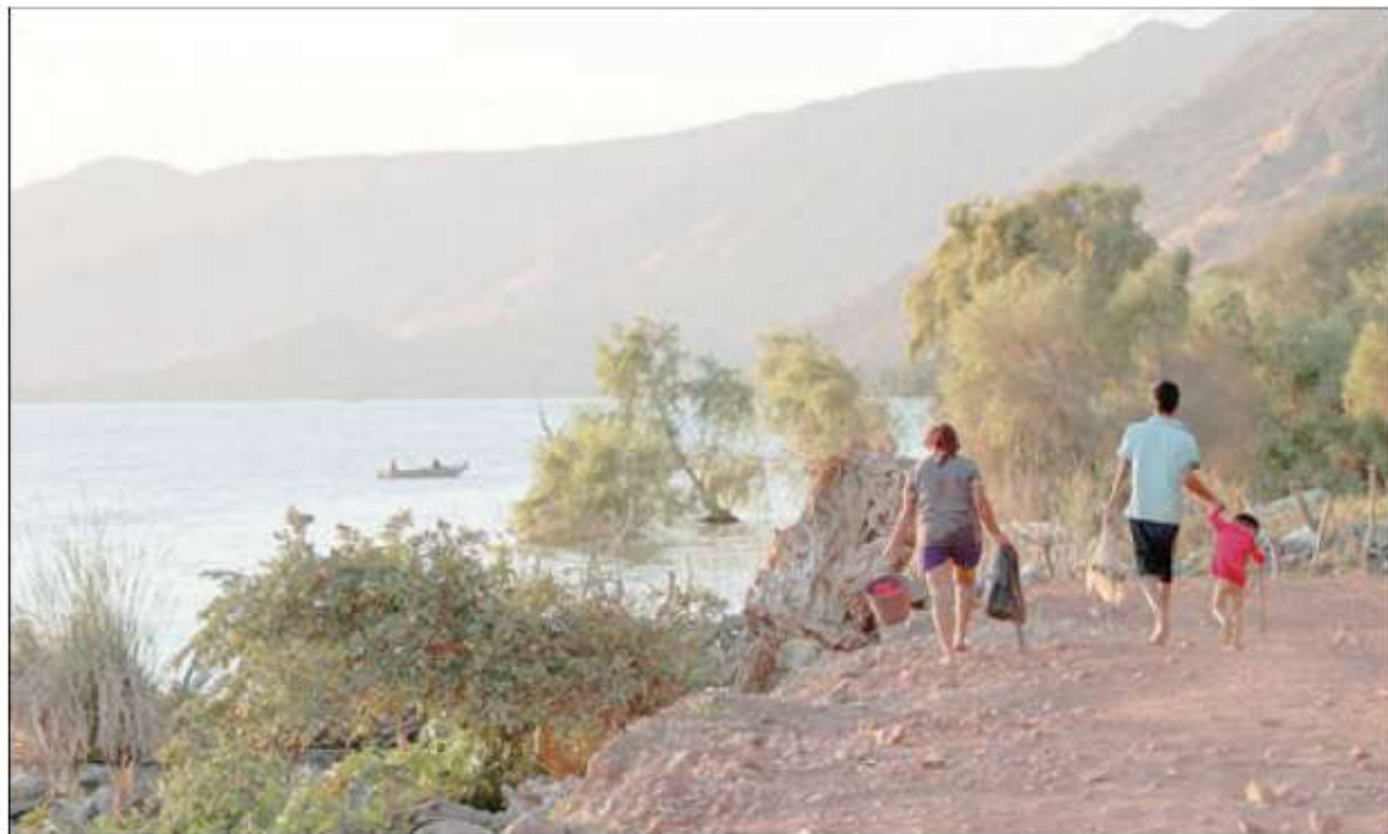
Una familia camina a la orilla del lago de Chapala –el cual presenta altos índices de contaminación– en busca de un buen lugar para pescar, en la comunidad de San Pedro Itzicán, municipio de Poncittán, Jalisco.