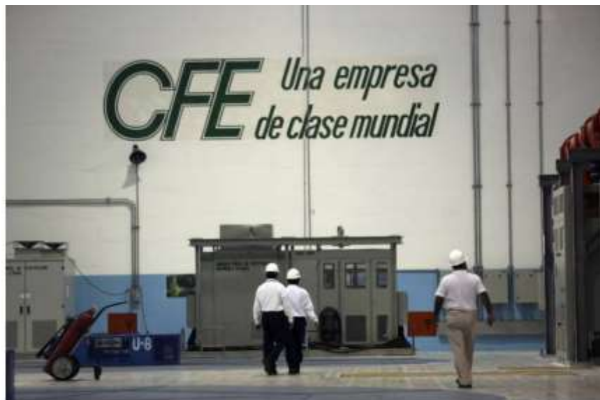
Empleados caminan al interior de una turbina hidroeléctrica de la empresa Comisión Federal de Electricidad (CFE) en la presa Manuel M. Torres en Chiapas.

Mientras el gobierno mexicano advierte que las empresas privadas no reflejan los costos reales de su energía, el sector privado señala las ineficiencias de CFE