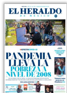
Pandemia lleva la pobreza a nivel de 2008