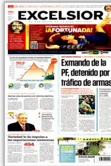
Exmando de la PF, detenido por tráfico de armas