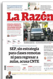
SEP, sin estrategia para clases remotas ni para regresar a aulas, acusa CNTE