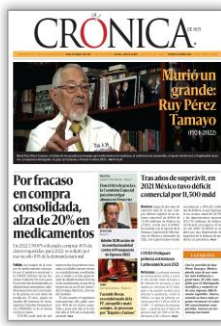
Por fracaso en compra consolidada, alza de 20% en medicamentos