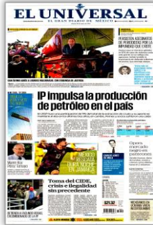
IP impulsa la producción de petróleo en el país