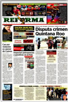
Disputa crimen Quintana Roo