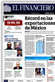
Récord en las exportaciones de México