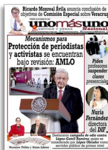
Protección a periodistas y activistas se encuentran bajo revisión: AMLO