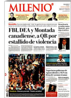
FBI, DEA y Montada canadiense, a QR por estallido de violencia