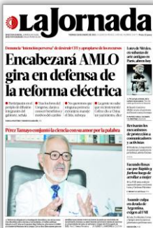
Encabezará AMLO gira en defensa de la reforma eléctrica