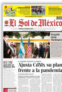
Ajusta CdMx su plan frente a la pandemia