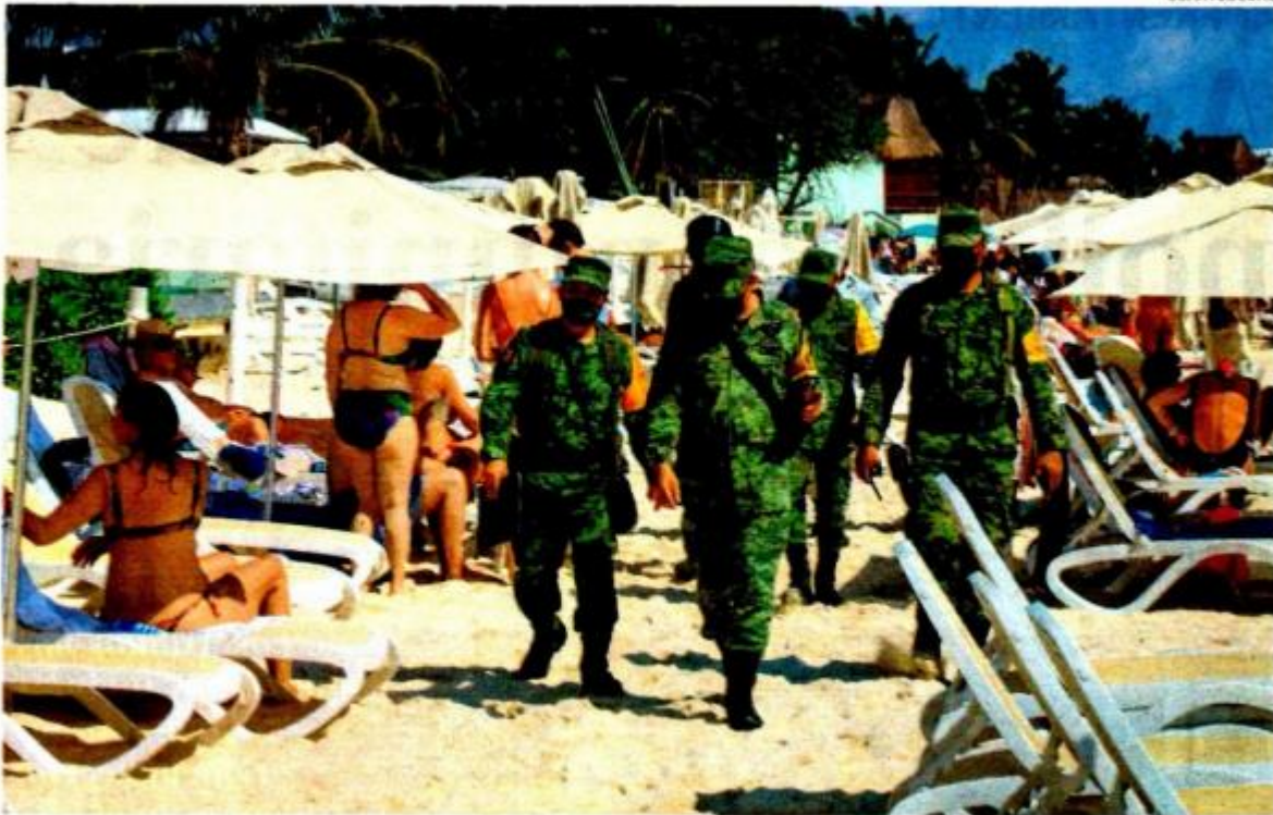
Elementos de la Guardia Nacional vigilan la zona en donde fue ejecutado el gerente del Mamita's Beach Club