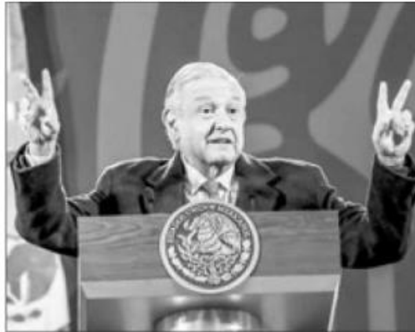
▲ El mandatario ratifica que uno de los objetivos es la defensa del litio mexicano.

También, como cada jueves, se presentaron funcionarios del gabinete de seguridad con objeto de participar en la reunión sobre el tema. Entre los que se dejaron ver por la misma puerta de Corregidora se distinguió al almirante Rafael Ojeda Durán, quien bajó de una camioneta Cherokee blanca blindada seguido de su equipo.