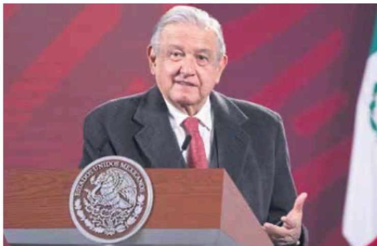
MENSAJE. El presidente Andrés Manuel López Obrador, ayer, en conferencia.