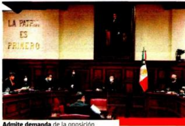
Admite demanda de la oposición