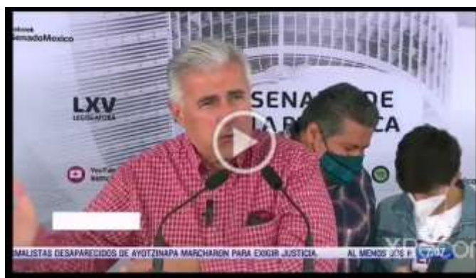
nota- Comisión permanente.mp4 - Google Drive

La sala superior del Tribunal Electoral del Poder Judicial de la Federación ordenó al Congreso de la Unión realizar los ajustes necesarios para garantizar el principio de máxima representación efectiva y mantener los criterios de proporcionalidad y pluralidad en la conformación de la Comisión Permanente. Este fallo abre la puerta para que se incluyan en la Comisión Permanente a legisladores del Grupo Plural y de Movimiento Ciudadano.