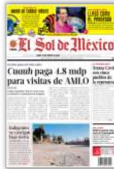
Cuauh paga 4.8 mdp para visitas de AMLO