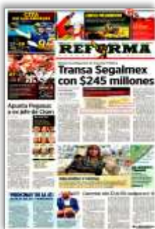
Transa Segalmex con $245 millones