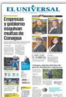
Empresas y gobierno esquivan multas de Conagua