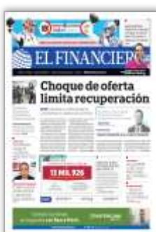
Choque de oferta limita recuperación