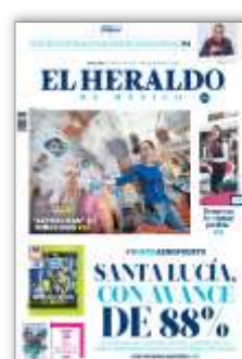
Santa Lucía, con avance de 88%