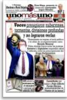
Voces presagiaron nubarrones, tormentas, divisiones profundas y no lograron verlas