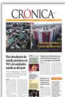
Hay desabasto de medicamentos en 96% de unidades médicas del país