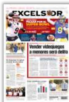
Vender videojuegos a menores será delito