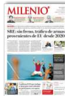
SRE: sin freno, tráfico de armas provenientes de EU desde 2020