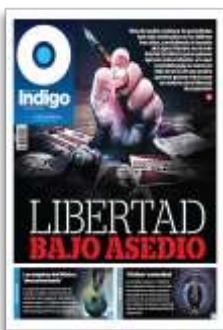
Libertad bajo asedio