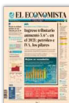
Ingreso tributario aumentó 5.6% en 2021; petróleo e IVA, los pilares