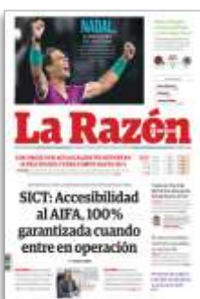
SICT: Accesibilidad al AIFA, 100% garantizada cuando entre en operación