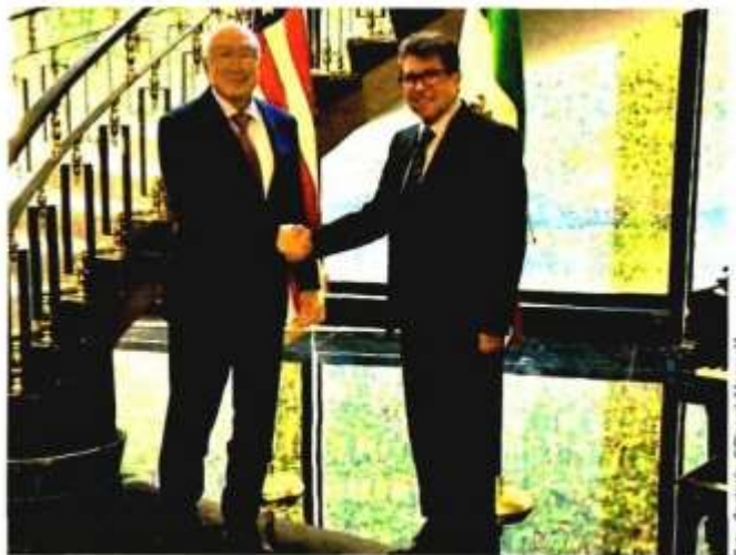
Ken Salazar y Ricardo Monreal. El senador de Morena recordó que el análisis de la política exterior es una de las facultades exclusivas del Senado.

En su reciente encuentro, Ricardo Monreal y Ken Salazar coincidieron en la importancia del renovado espíritu de cooperación y coordinación que los presidentes Andrés Manuel López Obrador y Joe Biden han inyectado a la relación bilateral.