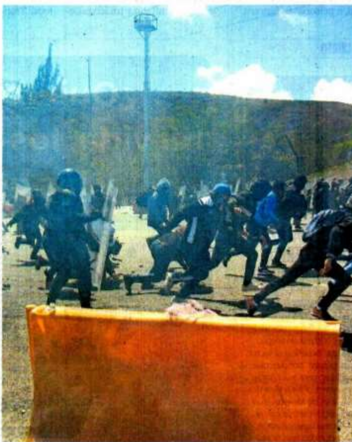
Policías y estudiantes de la Normal Rural de Ayotzinapa se enfrentaron el fin de semana pasado en la caseta de peaje de Palo Alto, en la Autopista del Sol.

"La Parka y dos grupos de normalistas cercanos a él identificados como Los Pachecos , ejercían el control del tráfico de drogas en la normal"