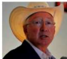
Ken Salazar anda muy activo.

En octubre pasado, Kerry se reunió con el presidente López Obrador en Palenque, Chiapas, en donde el mandatario le mostró el funcionamiento de uno de los programas ‘estrella’ de su administración como es Sembrando Vida.