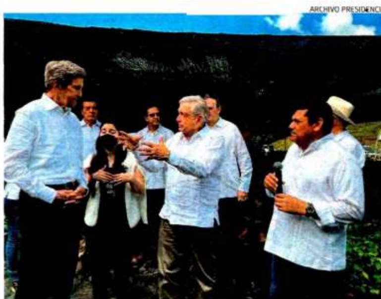
En octubre de 2021, AMLO ya se había reunido con Kerry en Chiapas