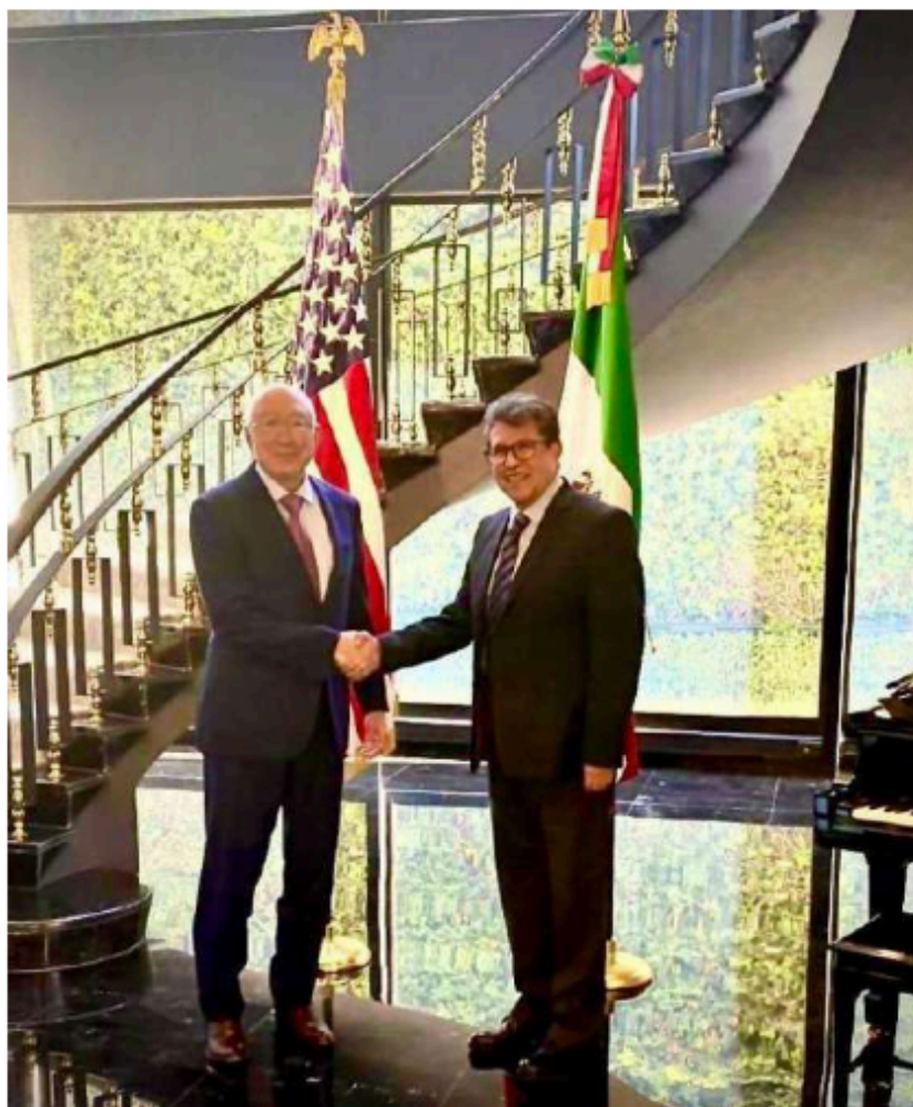
Ken Salazar, embajador de EU, se reunió con Ricardo Monreal.

Durante una conferencia de prensa, que ofreció en Michoacán el pasado 4 de febrero, Monreal Ávila afirmó que la posición de Ken Salazar sobre la reforma