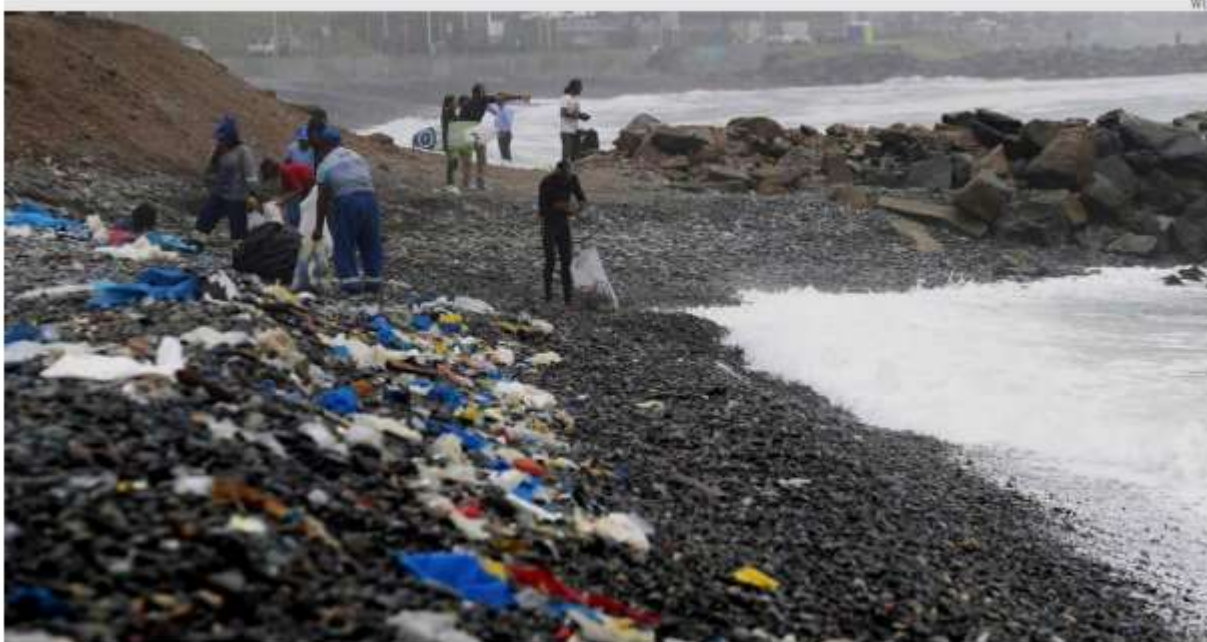
El PET en México es uno de los materiales plásticos de mayor uso.

La parte más peligrosa de los envases de plástico son los ftalatos, sustancias que llegan a los organismos vivos a través del agua