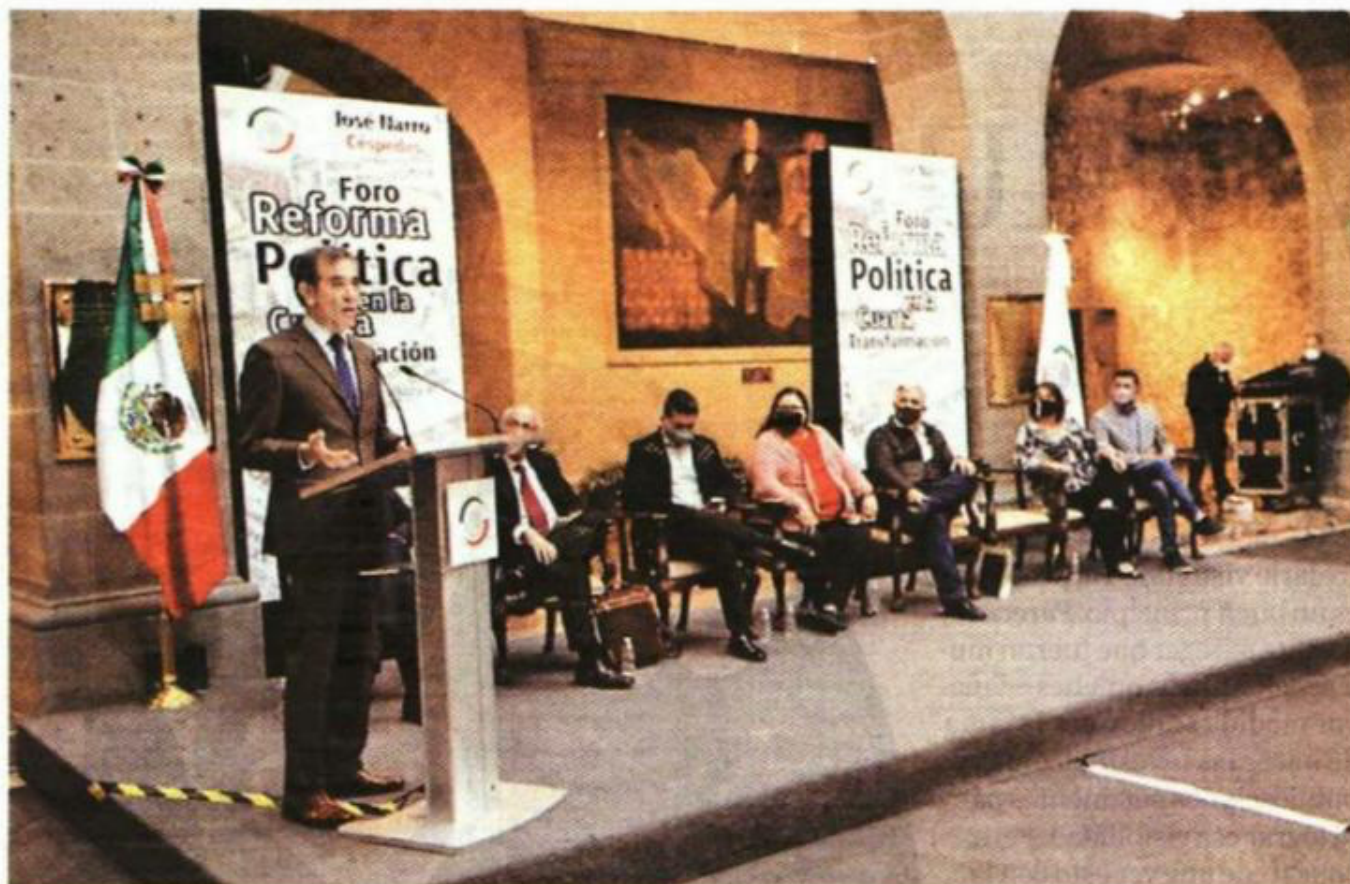
Lorenzo Córdova participó en un foro organizado por senadores de Morena.