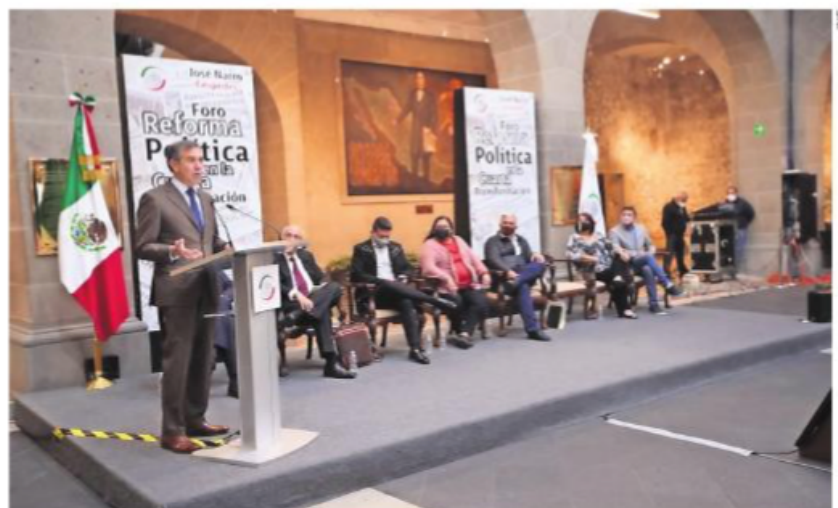
Lorenzo Córdova participó en el foro Reforma Política de la Cuarta Transformación .