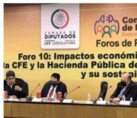
Representantes de CFE Capital participaron en el Parlamento Abierto

Respecto a indicadores de crecimiento, refirió que el precio por certificado de la ‘CFE FIBRA E’ incrementó 36.9 por ciento desde su oferta pública inicial en 2018.