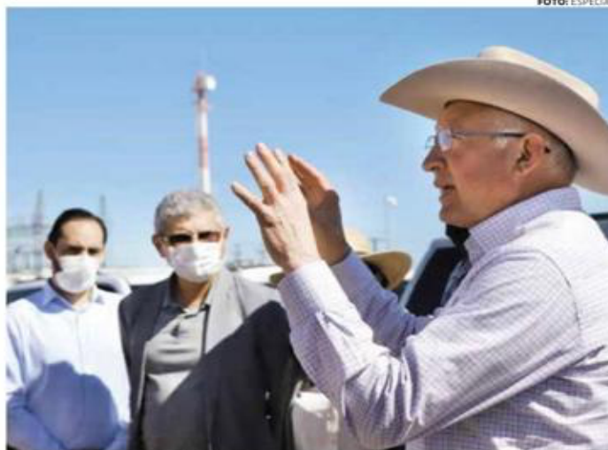
• VISITA. El embajador Ken Salazar, en un centro de energía de Baja California Sur.