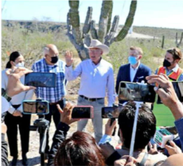
El Gobernador de BCS, Victor Castro, y el Embajador de EU en México, Ken Salazar, en el parque eólico Coromuel.