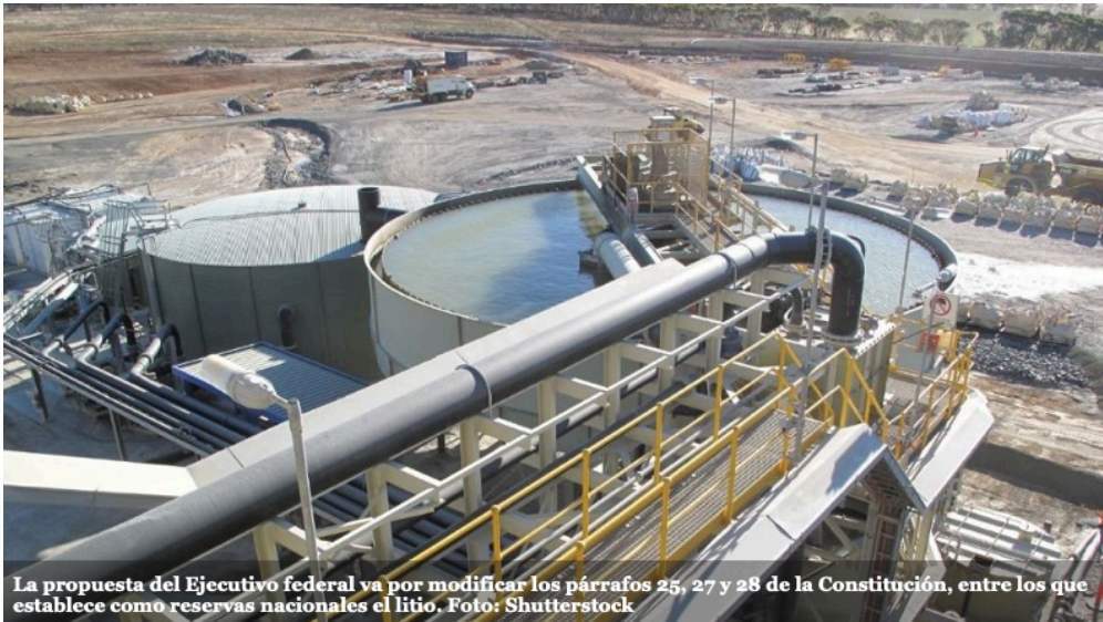
La propuesta del Ejecutivo federal va por modificar los párrafos 25, 27 y 28 de la Constitución, entre los que establece como reservas nacionales el litio.

América del Norte en la Secretaría de Energía alertó que de aprobarse la reforma y reservar el litio, el país podría enfrentar demandas de sus socios norteamericanos.