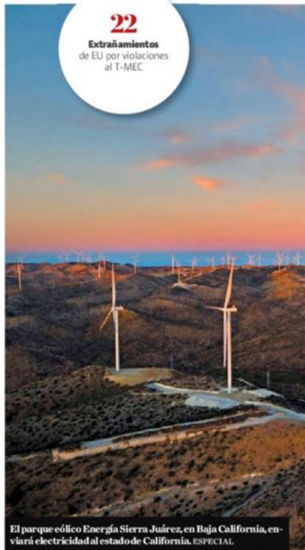
El parque eólico Energía Sierra Juárez, en Baja California, enviará electricidad al estado de California.

Extrañamientos de EU por violaciones al T-MEC