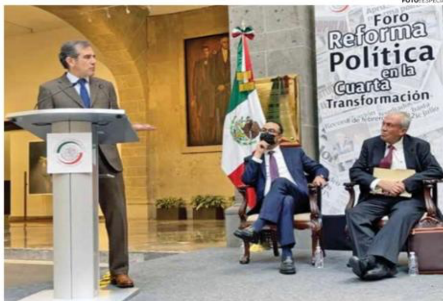
• ARGUMENTOS. El presidente del INE, Lorenzo Córdova, participó ayer en un debate con Morena.