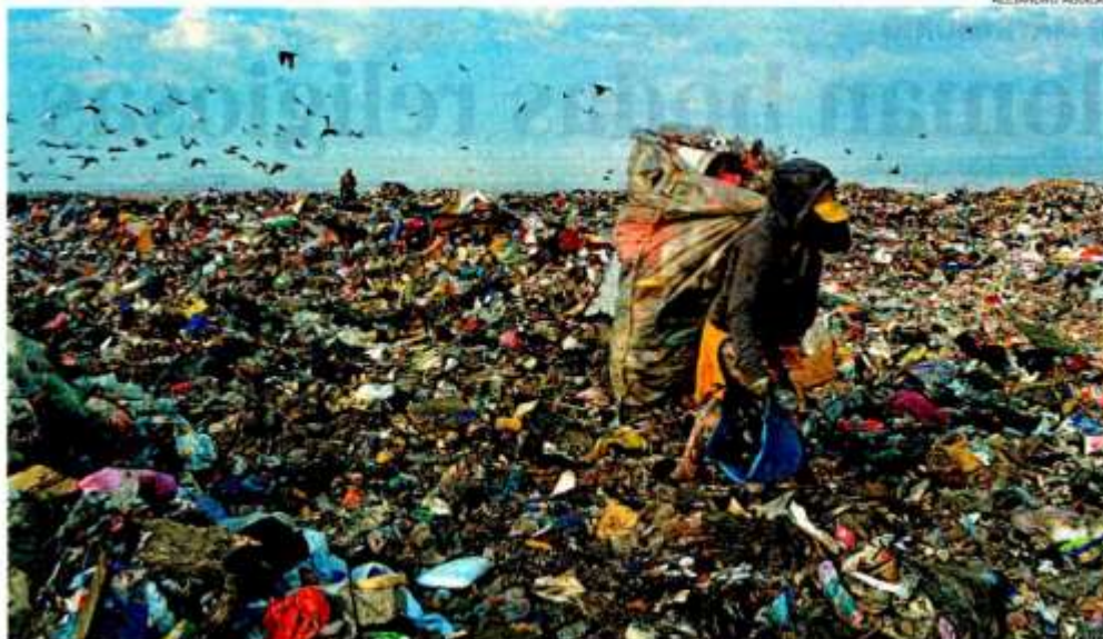
Reciclar y reusar diversos materiales no va a resolver por sí solo el problema del calentamiento global