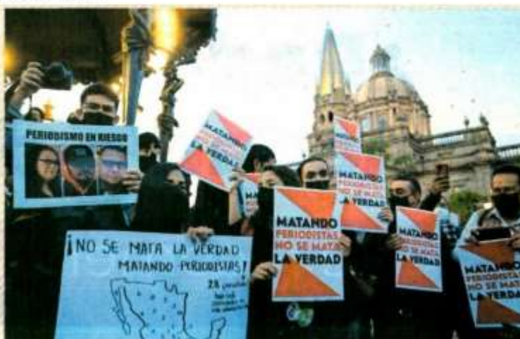
Periodistas se han manifestado en varios puntos del país ante el aumento de la violencia y los asesinatos contra el gremio.

respeto al ejercicio periodístico, lo enardece”