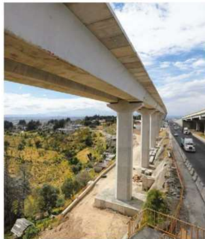
Las obras federales estarán bajo la lupa. IVÁN CARMONA

En las auditorías están contempladas 55 revisiones a 48 municipios para ver qué uso le dieron a las participaciones federales, al Fondo de Infraestructura Social, Fortalecimiento de los Municipios y Fortalecimiento a la Perspectiva de Género.