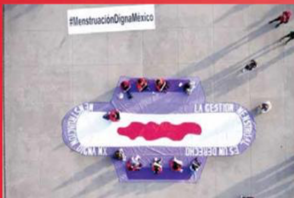
Una de las grandes características del movimiento Menstruación Digna México fue juntarse y hacer su voz más fuerte.

La colectiva Menstruación Digna México ha posicionado un tema lleno de estigmas en la agenda pública; aunque su primer gran avance fue lograr la tasa cero en productos de gestión menstrual, aún falta constatar que ésta realmente se implemente y que pasen otras reformas como la gratuidad de estos artículos en escuelas públicas