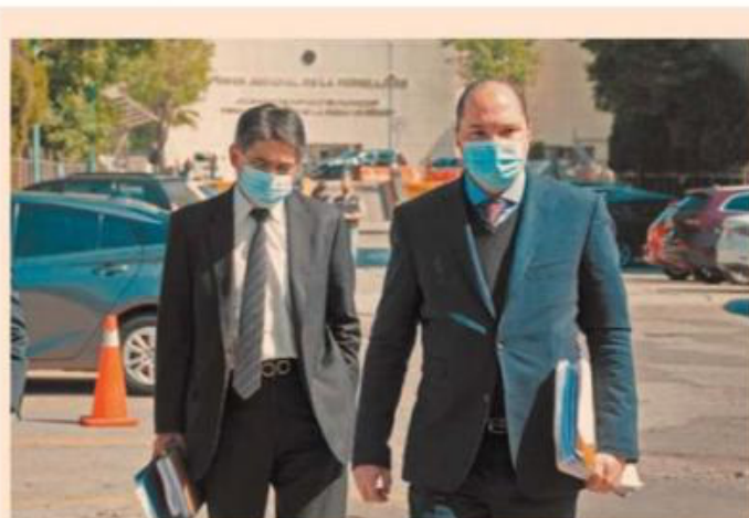
La defensa de Anaya informó al juez Fuerte Tapia, durante la audiencia de ayer, que desconocía el paradero del panista.

que desde el año pasado, el excondidato presidencial, quien se dice perseguido político del gobierno de López Obrador, está fuera del país.