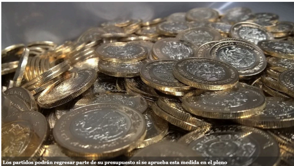
Los partidos podrán regresar parte de su presupuesto si se aprueba esta medida en el pleno

Con 26 votos a favor de Morena, PT, PVEM y del PRI; así como 11 en contra del PAN, PRD y MC, la