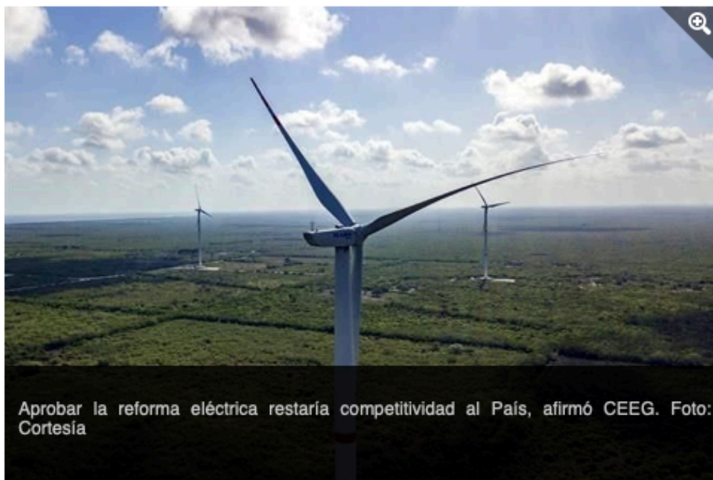
Aprobar la reforma eléctrica restaría competitividad al País, afirmó CEEG.