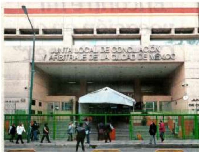
De acuerdo con la Secretaría de Trabajo y Fomento al Empleo local, la Junta de Conciliación y Arbitraje capitalina tiene un rezago de 140 mil expedientes con casos que tienen hasta 10 años.

Se enviarán al Congreso dos iniciativas para la creación de un Centro de Conciliación Laboral de la CDMX y tribunales en esa materia.