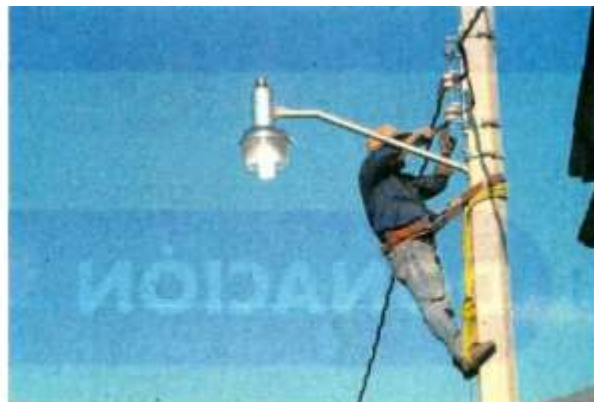
La CFE no ha invertido lo suficiente en energías renovables en el país, señalan expertos en la materia.