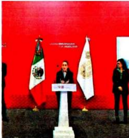
La Jefa de Gobierno de la Ciudad de México, Claudia Sheinbaum anunció un nuevo sistema de justicia laboral

"En la Ciudad de México lo que estaremos viendo es que, a partir del 3 de octubre –y aquí hago un paréntesis, por supuesto, ello de conseguir la prórroga en el Congreso de la Unión, que estamos seguros porque hay disposición para lograr este este acuerdo–, estaremos viendo en las últimas 11 entidades federativas, donde incluímos a la Ciudad de México, el 3 de octubre cerrando las puertas de las Juntas de Conciliación y abriendo las puertas del nuevo Modelo Laboral", indicó.