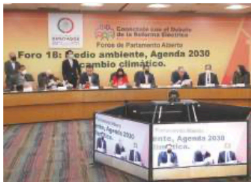
FORO 18 de la Reforma Eléctrica, ayer, en la Cámara de Diputados.

LA ELÉCTRICA es un par de zapatos que le quedarían chicos a la economía, sostiene director de Shell México; empresa dice que es falso que particulares no inviertan en insumos fósiles