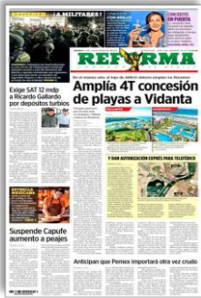
Amplía 4T concesión de playas a Vidanta