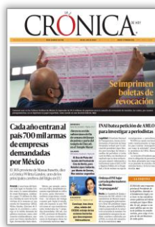
Cada año entran al país 700 mil armas de empresas demandadas por México