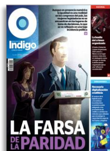
La farsa de la paridad