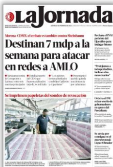
Destinan 7 mdp a la semana para atacar en redes a AMLO