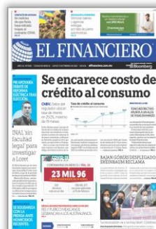
Se encarece costo de crédito al consumo