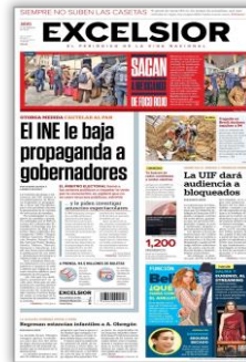
El INE le baja propaganda a gobernadores