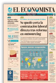
Se quedó corta la contratación laboral directa tras reforma en outsourcing