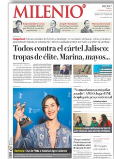
Todos contra el cártel Jalisco: tropas de élite, marina, mayos...