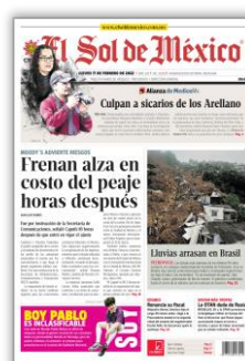
Frenan alza en costo del peaje horas después