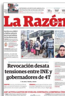
Revocación desata tensiones entre INE y gobernadores de 4T