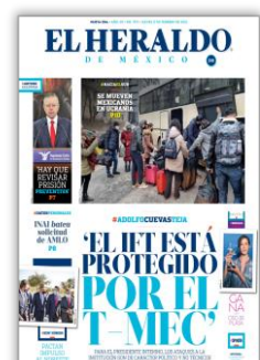
El IFT está protegido por T-MEC