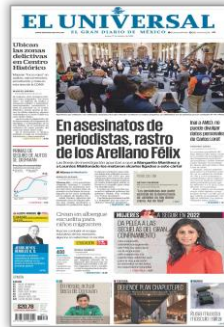
En asesinatos de periodistas, rastro de los Arellano Félix