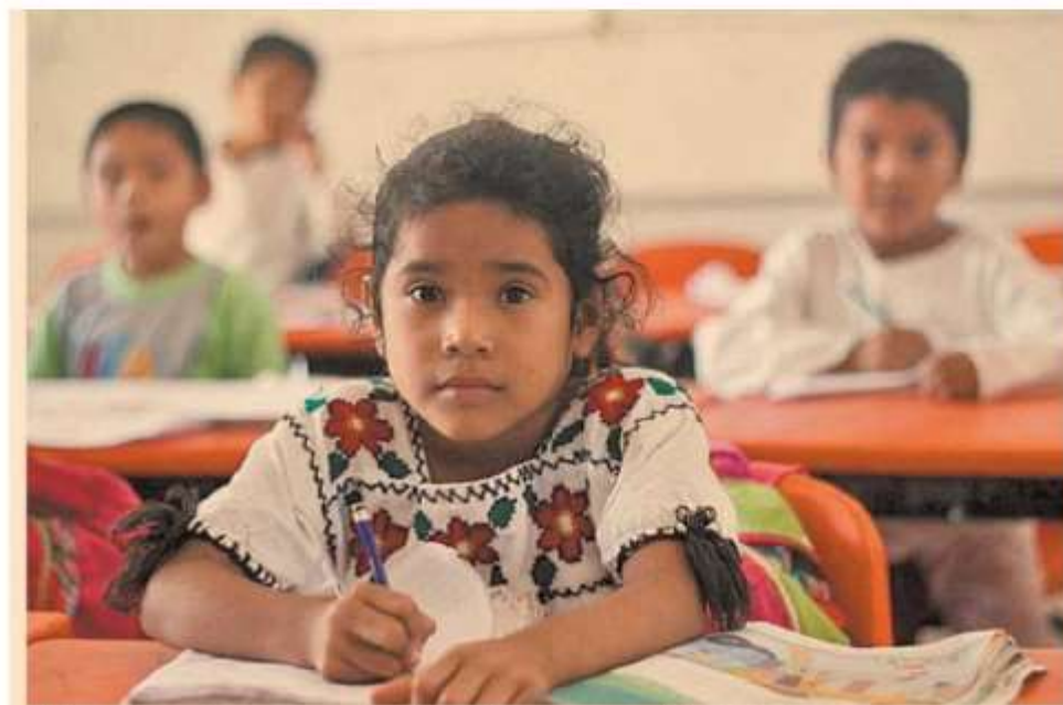
Muchos niños indígenas niegan su identidad y su lengua por temor a la discriminación.

La especialista advierte el fenómeno de discriminación solapada. Pero dice que necesitamos de los maestros, porque son el ingrediente fundamental para el cambio