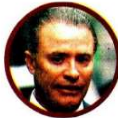
QUIRINO ORDAZ COPPEL