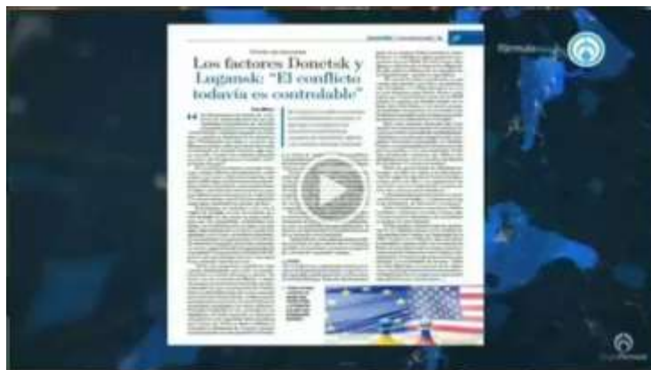
TeleFórmula Nota Maru Rojas 2403.mp4 - Google Drive

Los coordinadores parlamentarios de PRI, PAN y PRD respaldan la iniciativa presentada en el Pleno, para crear un nuevo organismo de protección para periodistas, sería una reforma constitucional y un organismo autónomo con recursos propios.