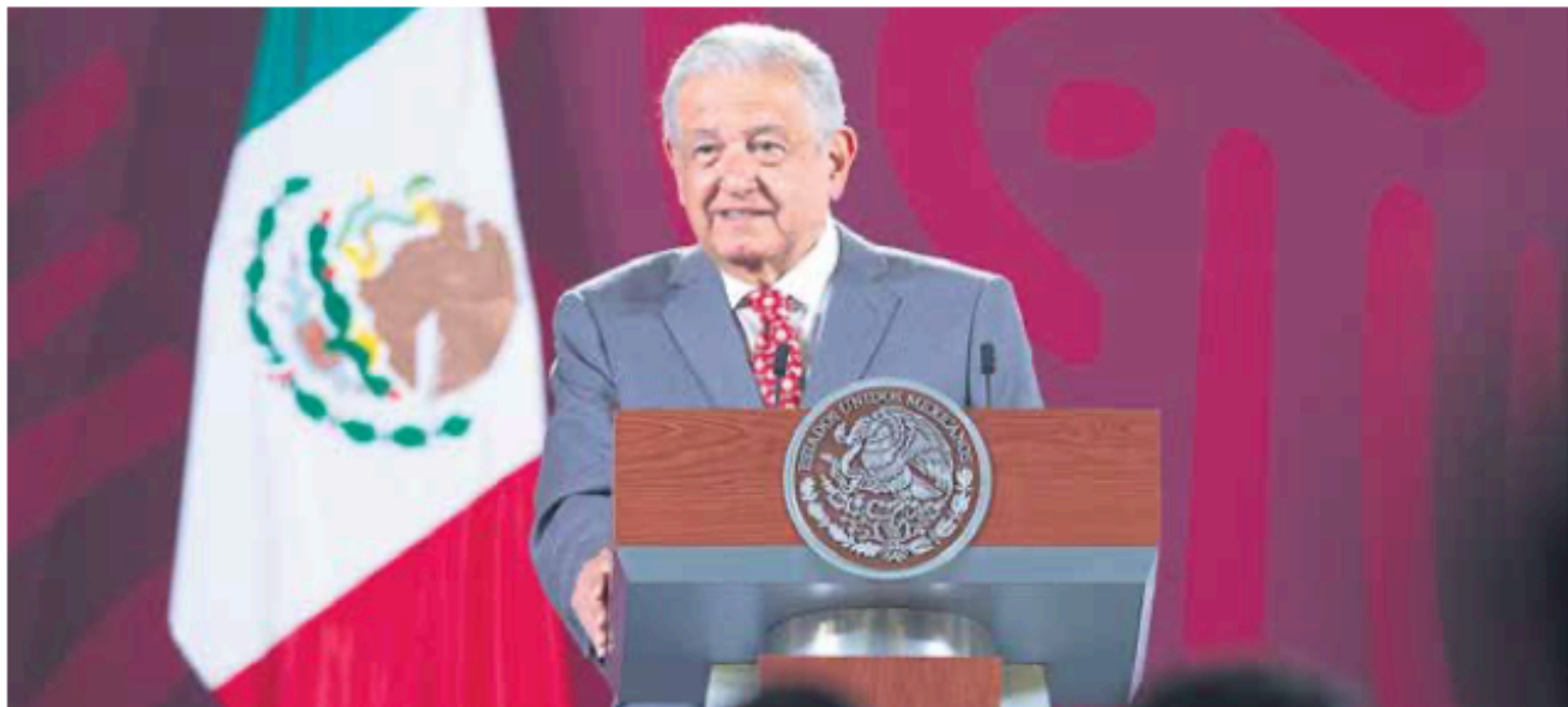
POSTURA. El presidente Andrés Manuel López Obrador, ayer, en conferencia.