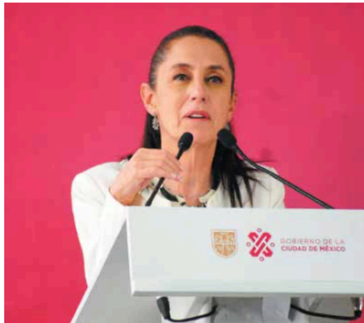
MENSAJE. La jefa de Gobierno, Claudia Sheinbaum, ayer, en conferencia.

La Comisión de Quejas del instituto, durante la sesión extraordinaria de ayer, en atención a una queja presentada por el PRD, determinó que