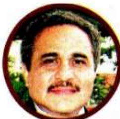
VÍCTOR HUGO MORALES