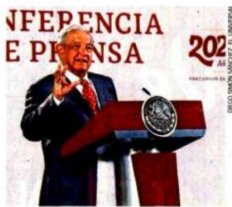
El presidente dijo que los periodistas "son mis hermanos y hermanas, aunque me critiquen".