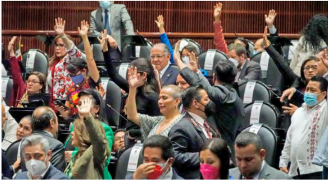
CAMBIOS. Ya no será necesario presentar título universitario para dirigir al organismo, aprobaron los diputados.