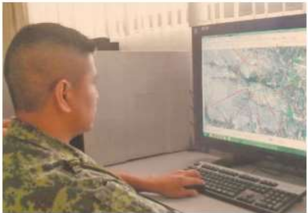
La Auditoría determinó que, en caso de contingencia, "no es posible garantizar la continuidad de las operaciones de la Secretaría".

Se identificaron deficiencias en la administración y operación de 18 de los 20 controles de ciberseguridad para la infraestructura de hardware y software de la Secretaría de la Defensa Nacional.