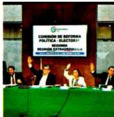
Buscan bloquear impugnaciones

Esta reforma se da luego de que en los años anteriores varios partidos políticos han impugnado