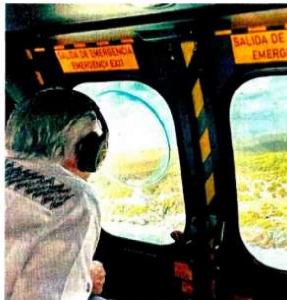
El Presidente López Obrador publicó una foto sobrevolando la zona donde se construye el Tren Maya.

Asimismo, ambientalistas señalaron apenas la semana pasada, tras modificar una parte del trazo, que se ha devastado la selva virgen a lo largo de 120 kilómetros, sin que existan los estudios ambientales, por lo que tampoco hay programas de rescate y reubicación tanto de flora como de fauna.