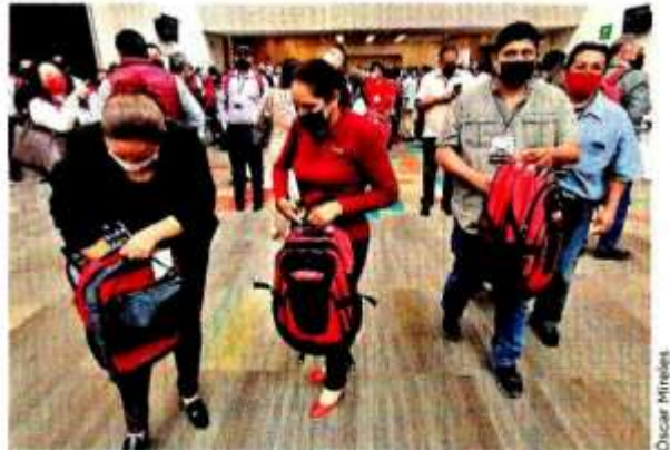
■ Al final del evento, los morenistas recibieron de sus dirigentes una mochila con los colores y logo del partido.