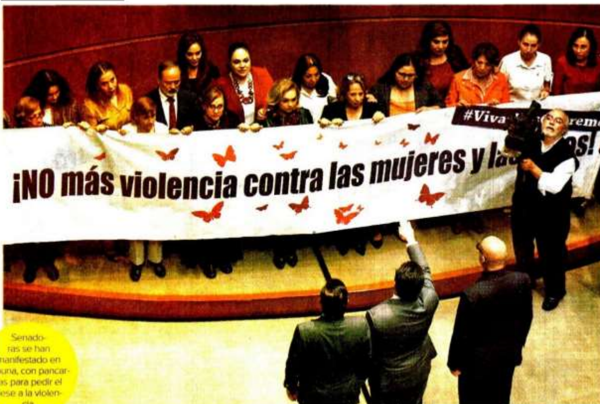
Senadoras se han manifestado en Ibcuña, con pancartas para pedir el cese a la violencia.

Se llevan a cabo las medidas necesarias para salvaguardar la integridad, seguridad y vida de las personas.