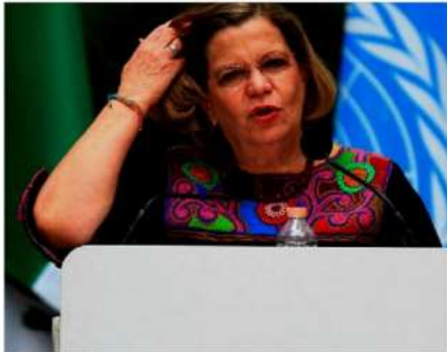
Nadine Gasman, titular del Instituto Nacional de las Mujeres.

Pero, para Gasman, la visibilidad del movimiento hoy es un triunfo de quienes llevan años luchando: «Se debe a nuestro éxito, al éxito de poner en la conciencia colectiva los derechos de las mujeres. El hecho de que más jóvenes y niñas saben que son iguales y que son sujetos de derechos» ●