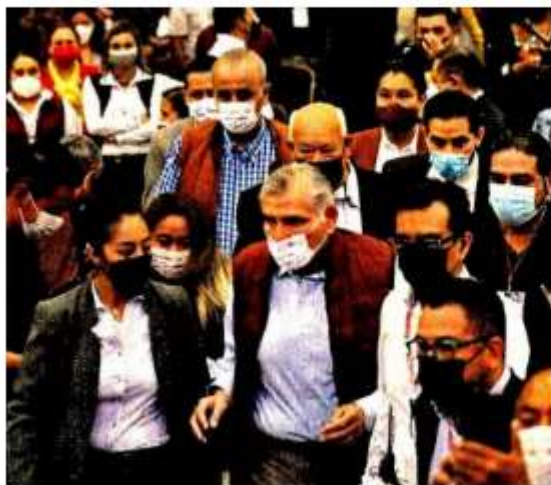
■ Adán Augusto López, Secretario de Gobernación.

Pese a que la Constitución lo prohíbe, funcionarios, gobernadores y dirigentes de Morena manifestaron en un acto público su apoyo al Presidente y llamaron a participar en la consulta de revocación de mandato.