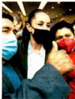
Claudia Sheinbaum con militantes morenistas.

Ahí está el desafío, falta ver lo que resuelva la autoridad electoral. ●