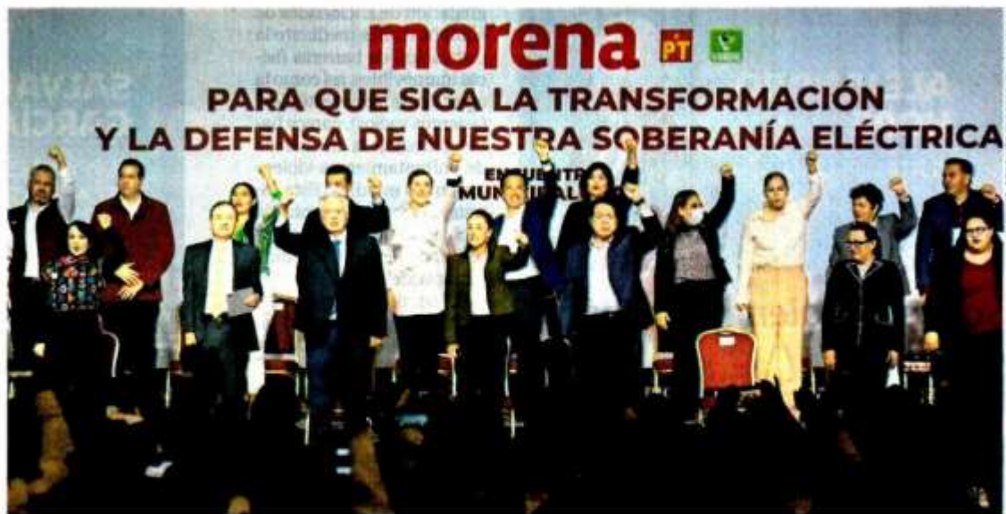
Militancia de Morena se reunió ayer en las instalaciones del WTC de la Ciudad de México.

"Nuestro movimiento sigue conquistando (...) nadie lo va a parar, por eso están aquí los candidatos que nos representan y van a ganar, y allá el INE, que nos sancione"