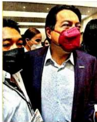
■ Mario Delgado, dirigente nacional de Morena.