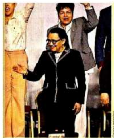
■ Rosa Icela Rodríguez, Secretaria de Seguridad.