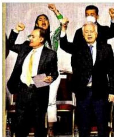
■ Alfonso Durazo, Gobernador de Sonora, y Manuel Bartlett, titular de la CFE.