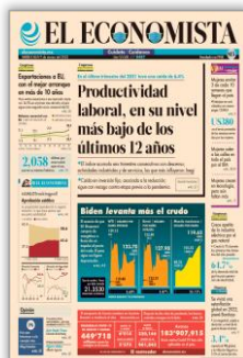
Productividad laboral, en su nivel más bajo de los últimos 12 años