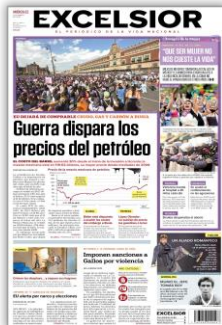
Guerra dispara los precios del petróleo