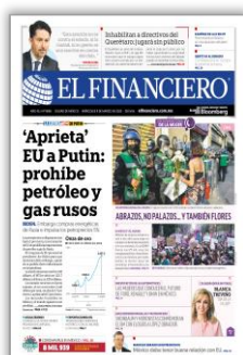
'Aprieta' EU a Putin: prohíbe petróleo y gas rusos