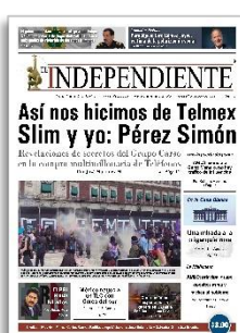
Así nos hicimos de Telmex Slim y yo: Pérez Simón