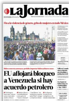
EU aflojará bloqueo a Venezuela si hay acuerdo petrolero