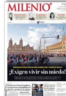
¡Exigen vivir sin miedo!