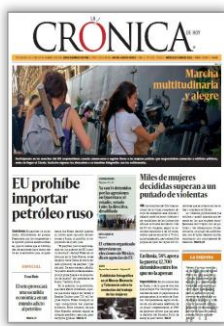
EU prohíbe importar petróleo ruso