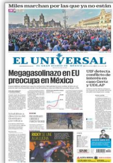
Megagasolinazo en EU preocupa en México