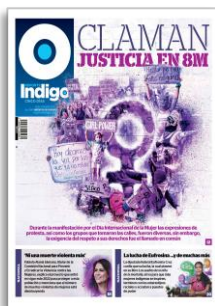
Claman justicia en 8M