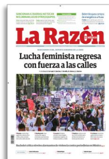
Lucha feminista regresa con fuerza a las calles