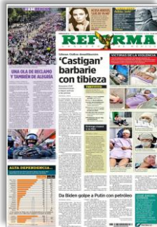
'Castigan' barbarie con tibieza