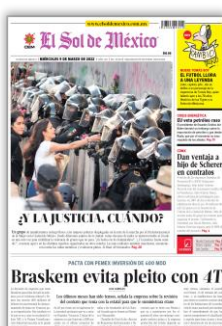
Braskem evita pleito con 4T