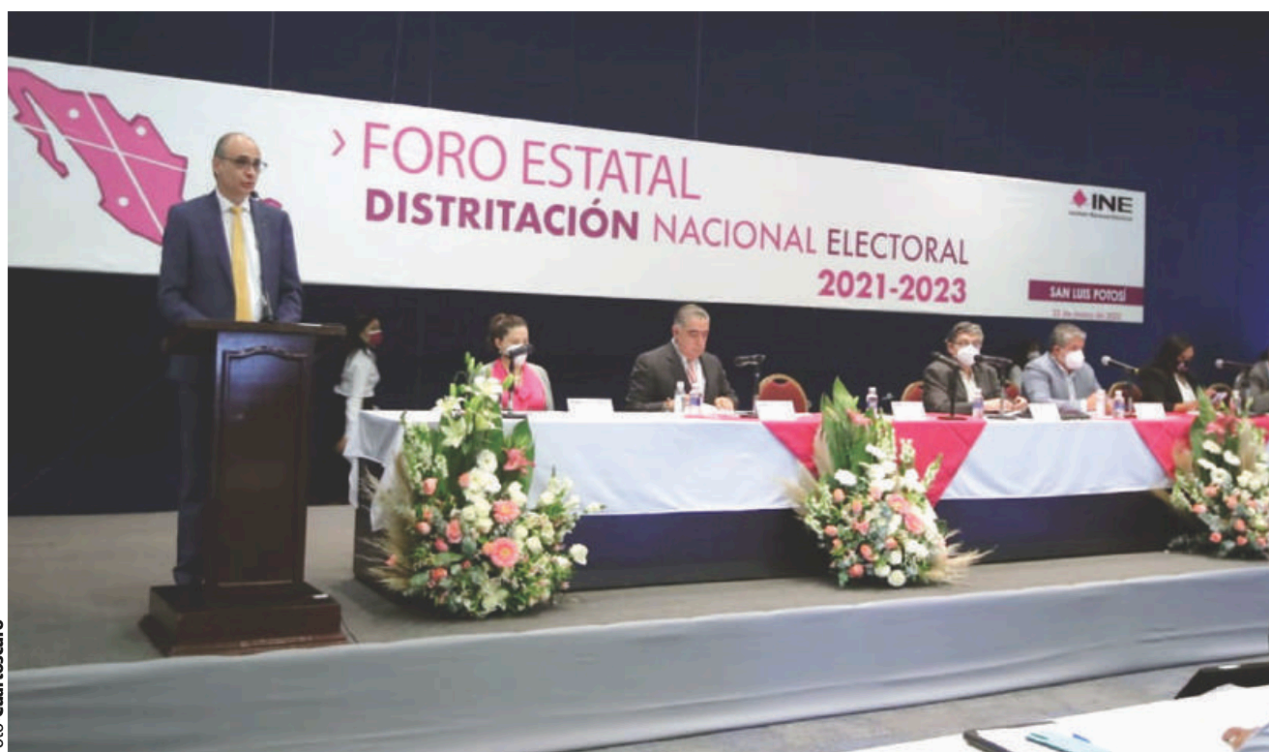
INTEGRANTES DEL INE, durante el Foro de Distritación Nacional Electoral, realizado en San Luis Potosí, ayer.