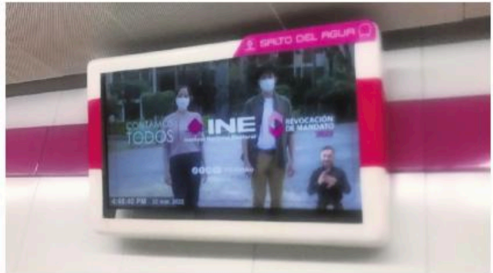
Un spot oficial del INE dice estar listo y llama a participar en la consulta ciudadana que se realizará el próximo 10 de abril.

El pasado 17 de marzo, en una edición vespertina y en la víspera de que fuera aprobado por el Senado de la República, fue publi-