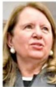
■ Loretta Ortiz Ahlf, Ministra de la Corte.

De prosperar la iniciativa de la Ministra Ortiz –agendada para su discusión en el Pleno de la Corte del 5 de abril– se daría un espaldarazo también a la reforma constitucional pendiente a debatirse en el Congreso que contiene