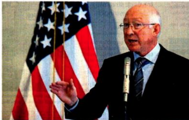
El embajador de Estados Unidos en México, Ken Salazar, reconoció que existen además otros problemas en la relación bilateral como el del tráfico de armas y la migración.