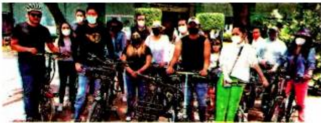
El gobierno capitalino debe apostarle a la movilidad sustentable y ser una capital de vanguardia en temas de transporte alternativo y no contaminant

En opinión de los diputados de la Asociación Parlamentaria Ciudadana, Danie-