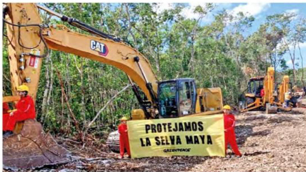
PROTECCIÓN. Los árboles sembrados servirán para reponer a los que se talen, incluso ya se sabe que tipo de plantas se colocarán a la orilla del Tren Maya, aseguró el jefe del Ejecutivo.

El Presidente los llamó pseudoambientalistas y arremetió en contra del actor Eugenio Derbez y otros famosos por criticar el proyecto del Tren Maya.