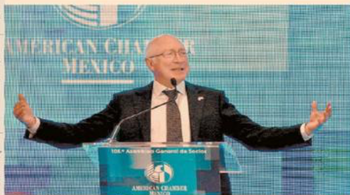
Ken Salazar, embajador de EU en México, participó en la 105 Asamblea General de socios de la AmCham.

• A unas horas del inicio del trámite legislativo de la reforma que plantea devolverle poder de mercado a la CFE, representantes de la AmCham expresaron su preocupación a Tatiana Clouthier, quien refirió que el presidente López Obrador se comprometió a no afectar la relación comercial