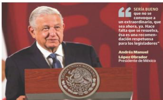
EL MANDATARIO federal en conferencia matutina, ayer.

“SERÍA BUENO que no se convoque a un extraordinario, que sea ahora, ya. Hace falta que se resuelva, ésa es una recomendación respetuosa para los legisladores”