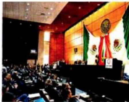
El presidente de la Comisión de Energía de la Cámara de Diputados aclaró que las reuniones continuarán de manera semipresencial.

Bajo la promesa de que no habrá albazo legislativo y de que el dictamen de la reforma eléctrica comenzará a circular a más tardar el próximo 4 de abril, con cinco días de anticipación al debate que se realizará el 11 del mismo mes, quedaron instaladas las Comisiones Unidas de Energía y Puntos Constitucionales de la Cámara de Diputados, encargadas de dictaminar el proyecto