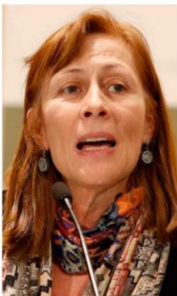
Tatiana Clouthier, titular de Economía, y Ken Salazar, embajador de EU en México.

“Esto de la energía, de la reforma, de todo lo que está pasando, es difícil. No sé a dónde vamos a llegar”, declaró Sala-