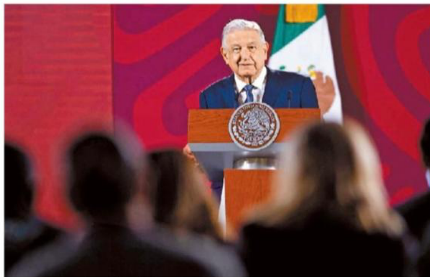
El mandatario en la conferencia de ayer en Palacio Nacional.

Los legisladores de Morena negaron reiteradamente un intento de madrugate y se comprometieron a cumplir con el reglamento interno, que obliga