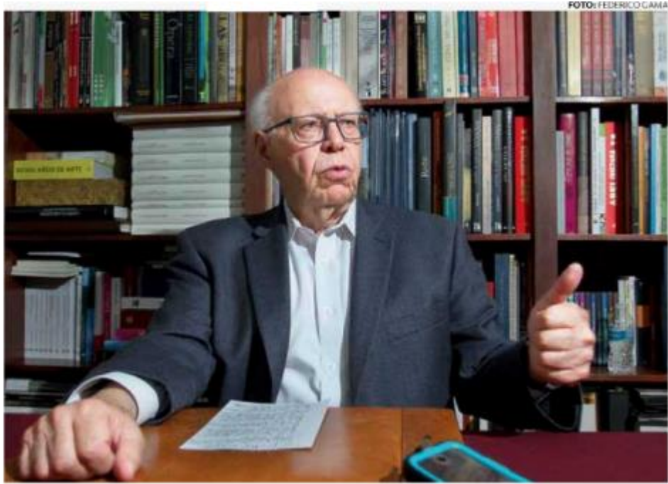
• POSICIÓN. El exsecretario de Salud aceptó que se ha mantenido a distancia del partido.