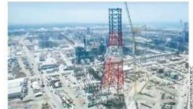
TRABAJO. La refinería será inaugurada el viernes.

También se detectaron irregularidades financieras por 52.9 millones de pesos en las obras que se llevan a cabo en Paraíso, Tabasco.