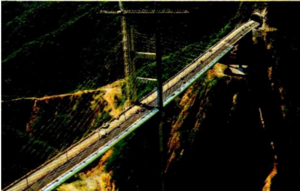
La ASF señaló irregularidades en el puente Baularte, obra inaugurada por Tradeco en 2013