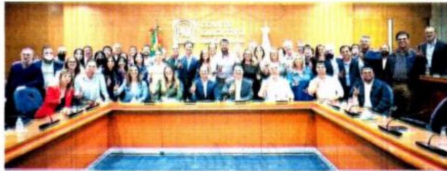
La Comisión Permanente del PAN busca evitar la destrucción de la democracia, de la libertad y de los derechos humanos, advierten.