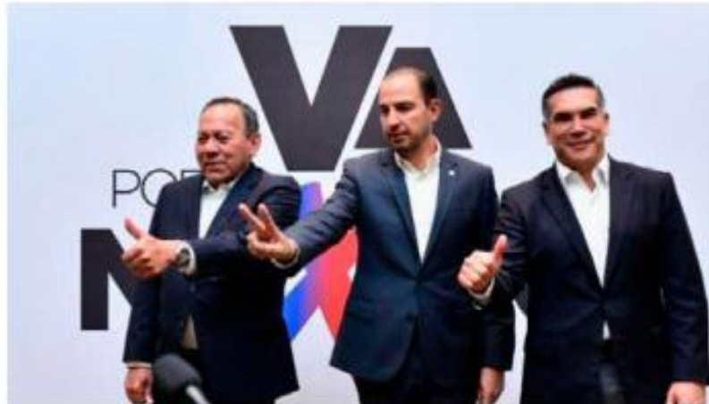
Los tres partidos buscan poner un freno a Morena.

mente se pidió que se bajaran pancartas en apoyo a algunos de los aspirantes a la candidatura mexiquense y donde también se escucharon porras para cada uno de ellos, ninguno tomó la palabra.