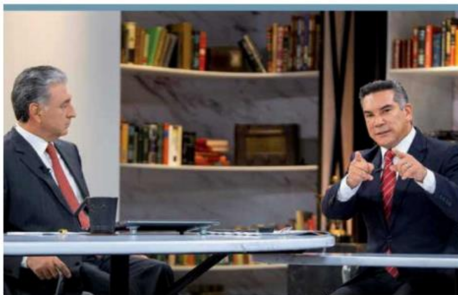
ALEJANDRO MORENO PRESIDENTE DEL PRI

Lo que sí tiene que quedar claro es que tenemos que ir juntos, porque si ganamos, vamos todos'.