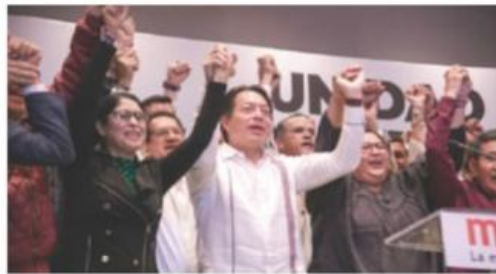
MARIO DELGADO e integrantes del CEN morenista, ayer, en conferencia de prensa.

EL LÍDER de Morena recuerda que el INE ya determinó que en el evento en Toluca no hubo ninguna ilegalidad; Edomex "lleva mano" en definición del género de candidatos, señala