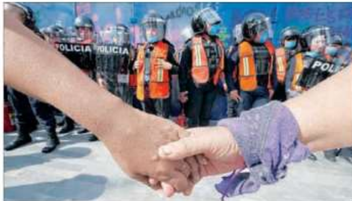
▲ Movilización por el Día Internacional de la Mujer el 8 de marzo de 2020, en la Ciudad de México.