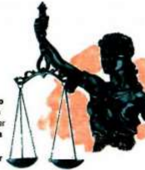
Gráfico: Rodolfo Gómez

Brindar un enfoque de Interculturalidad , si se requiere