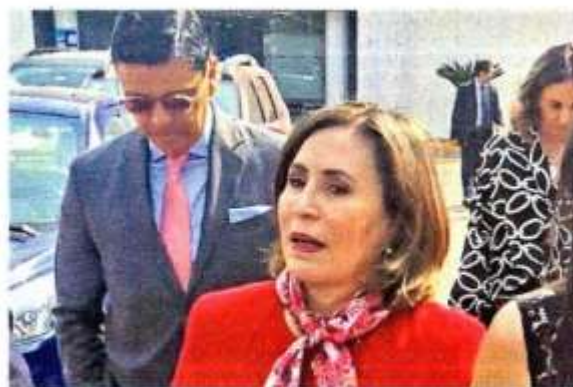
El 24 de febrero, tras más de tres años y medio, un juez federal absolvió a Rosario Robles por la Estafa Maestra.

Este fallo hizo que la FGR reaccionara contra el juez, anunciando que le iniciaría una carpeta de investigación, por delitos contra la administración de la justicia, y presentaría una queja administrativa ante el Consejo de la Judicatura Federal.