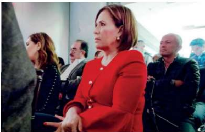
Rosario Robles está relacionada con la llamada "Estafa Maestra".