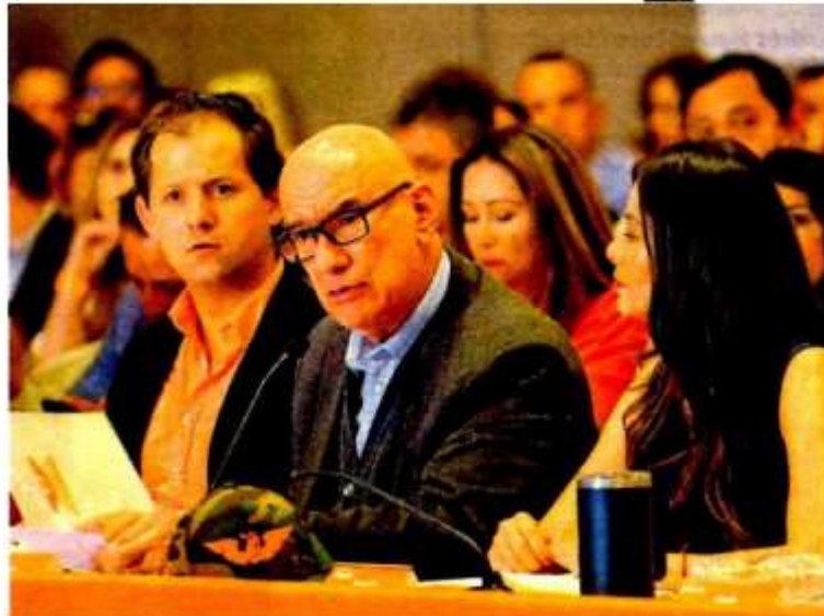
Dante Delgado , dirigente de Movimiento Ciudadano.