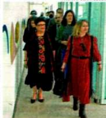
CJM en Magdalena Contreras