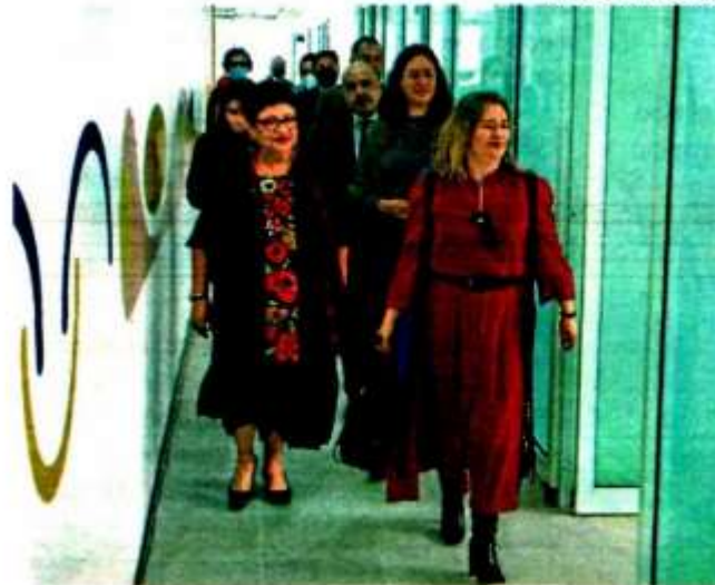
CJM en Magdalena Contreras