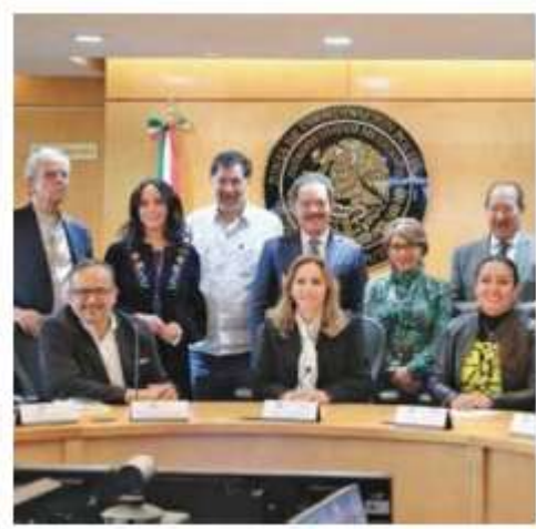
● ARRANQUE. El Comité Técnico Evaluador listo para seguir el proceso de selección.