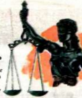
Gráfico: Rodolfo Gómez

Brindar un enfoque de interculturalidad , si se requiere