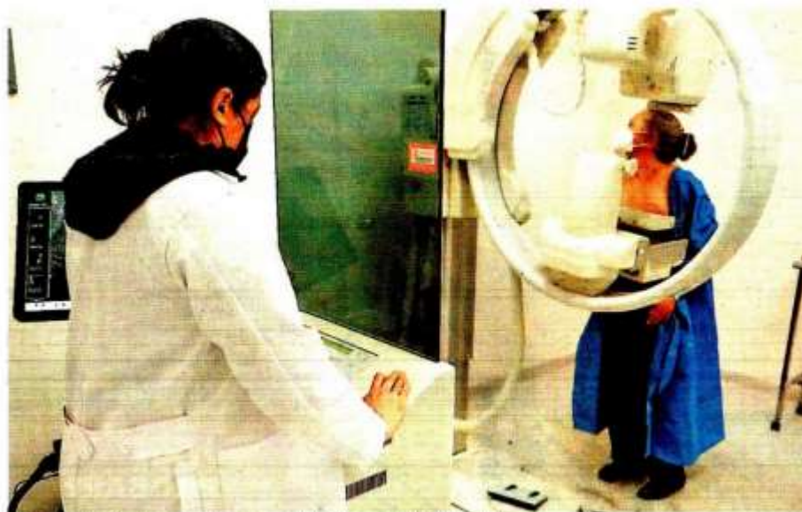
El dinero no fue ejercido para acciones como estudios de mastografía.

Ya se tomaron medidas, pero no se ha logrado recuperar ni un solo peso de ese daño