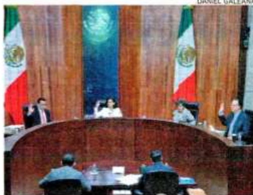
Mónica Soto preside la primera sesión del TEPJF

Al concluir la ceremonia, la magistrada Mónica Soto se negó a responder preguntas de los medios de comunicación sobre la ausencia de sus homólogos, sin embargo, fuentes al interior del TEPJF señalaron que Rodríguez Mondragón está de vacaciones, mientras que Otálora Malasis sí llegó a la sesión del pleno.