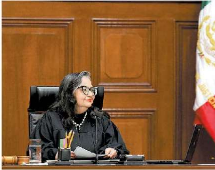
La ministra presidenta.