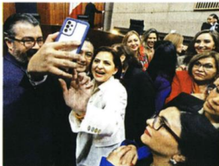
La Magistrada se dejó apapachar al concluir la sesión.