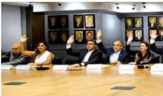
Debate. Sesión del Consejo Político Nacional del PRI.

“Es momento de cerrar filas con las decisiones que se tomen en el partido. La voluntad de los priistas es inquebrantable; somos mujeres y hombres de una pieza y tenemos palabra”, añadió. —Redacción