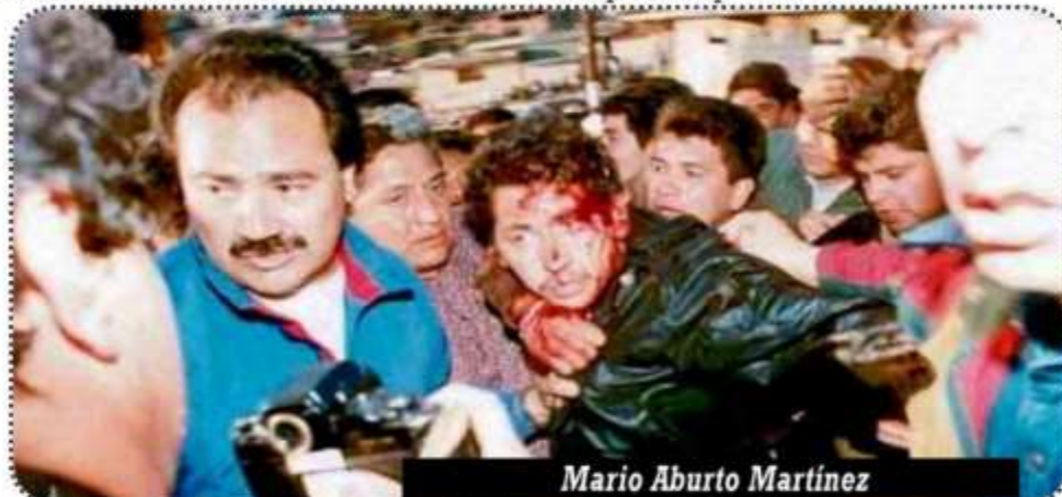
Mario Aburto Martínez