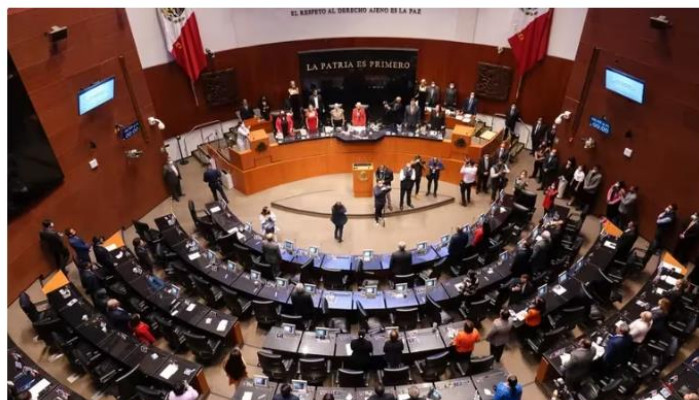
Senadores aprueban condena de hasta 5 años a quienes difundan ideas de superioridad de raza en México

La Coalición de Sigamos Haciendo Historia, compuesta por Morena , Partido del Trabajo (PT) y Partido Verde Ecologista de México (PVEM) dio a conocer el segundo paquete de precandidatos para ocupar un escaño en el Senado de la República de cara a las elecciones de 2024.