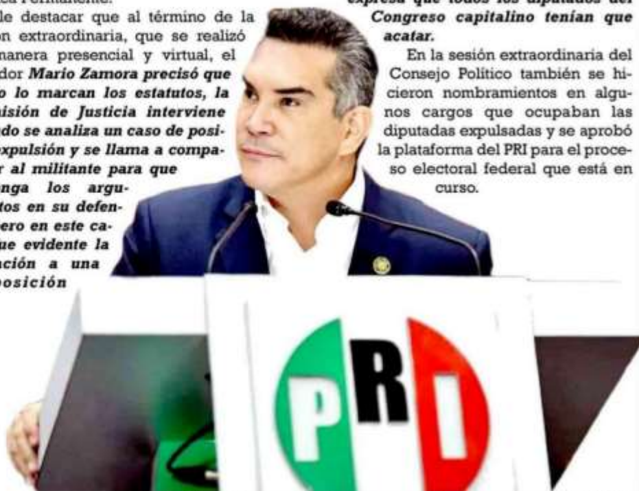
Alejandro Moreno Cárdenas, presidente nacional del PRI

En la sesión extraordinaria del Consejo Político también se hicieron nombramientos en algunos cargos que ocupaban las diputadas expulsadas y se aprobó la plataforma del PRI para el proceso electoral federal que está en curso.