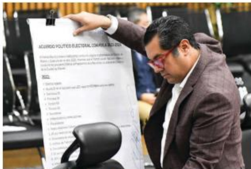
EL DIPUTADO Sergio Gutiérrez Luna, al presentar su denuncia, ayer.

ASEGURA que dicho convenio atenta contra los principios de la integridad electoral; oposición acusa que la intención es distraer la atención del presunto desvío de recursos para campañas