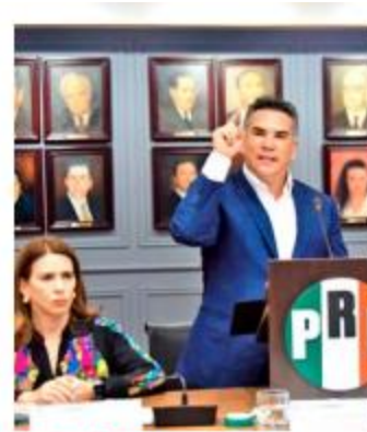
DECISIÓN. Advierten el mismo destino a desleales del partido.

Además, Moreno Cárdenas llamó a cerrar filas y fortalecer la unidad interna. Refirió que en el marco de la coalición Fuerza y Corazón por México se tiene que actuar con inteligencia y responsabilidad política.