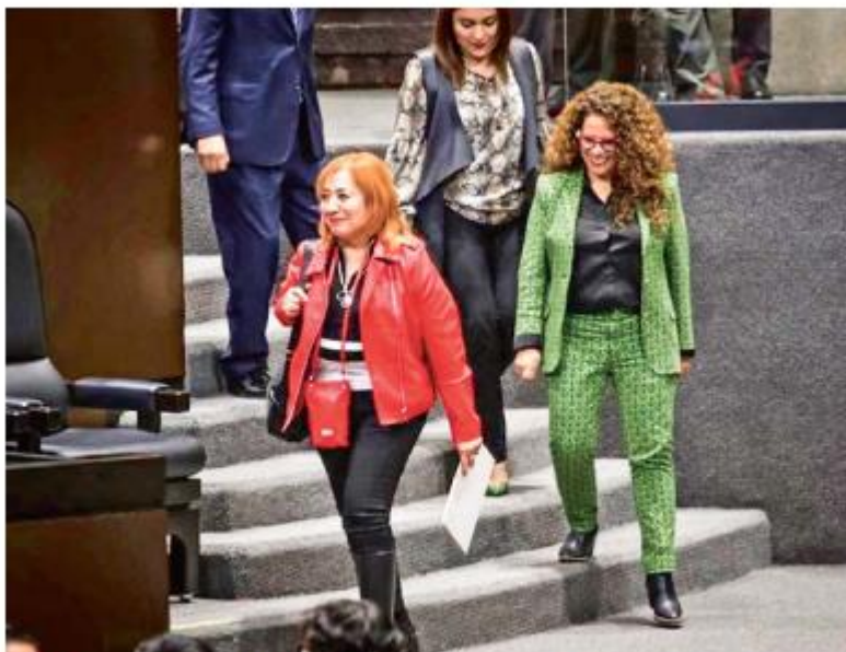
VISTA. Rosario Piedra Ibarra acudió a la Cámara de Diputados a presentar su informe... Y solicitar que desaparezca el organismo.

El senador Germán Martínez criticó que ya no se ven las recomendaciones por personas en contexto de migración, con discapacidad, periodistas asesinados, madres buscadoras o desplazamiento forzado.