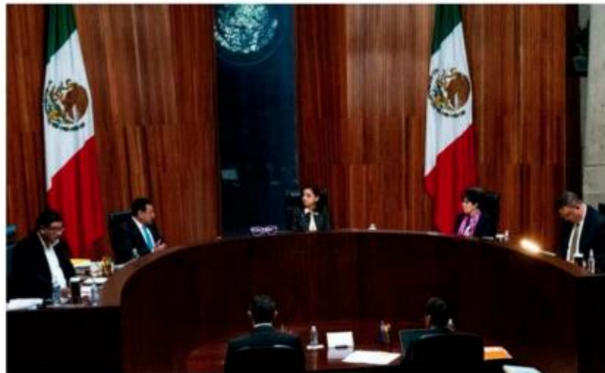
Sesión del Tribunal Electoral del Poder Judicial de la Federación (TEPJF).

En sesión pública de la Sala Superior de este tribunal se analizó un juicio para la protección de los derechos político-electorales presentado por una ciudadana que se inconformó con la falta de mecanismos para garantizar la paridad de género.