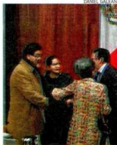
Sesión pública del TEPJF

EN CASO de que el Congreso vuelva a caer en omisión, el INE podrá emitir lineamientos para garantizar la paridad de género