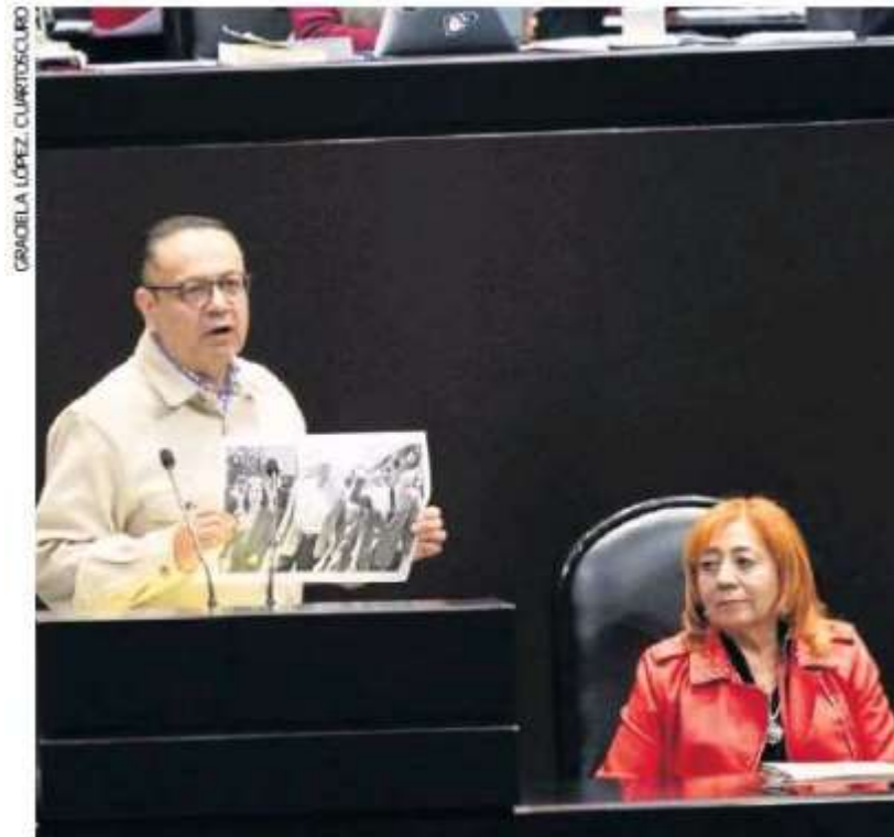
El senador Germán Martínez mostró una foto de Rosario Ibarra y dijo que a la titular de la CNDH le queda grande la comisión.

“¿Por qué sigue sin oponerse a la militarización del país? Urge hacer frente a las violaciones de los derechos humanos, no a guardar silencio”