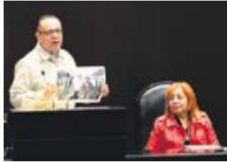
Reclamo. Germán Martínez y Rosario Piedra, titular de la CNDH, ayer.

A nombre de los senadores sin partido, el expanista Germán Mar-