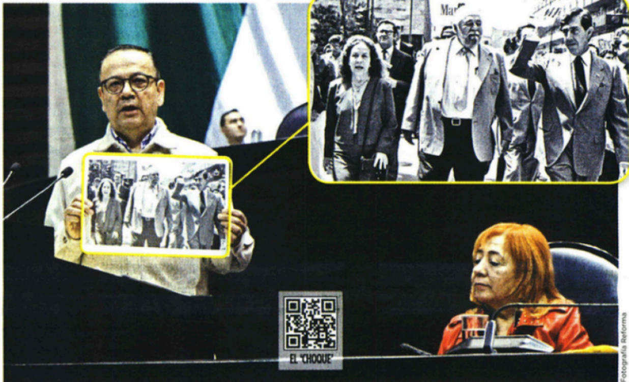
El senador Germán Martínez mostró una imagen de Rosario Ibarra de Piedra, Manuel Clouthier y Cuauhtémoc Cárdenas en una protesta por el fraude electoral en 1988, y pidió a la titular de la CNDH estar a la altura de su madre.

Ayer, durante su informe de labores ante integrantes de la Comisión Permanente, el senador del Grupo Plural, Germán Martínez, recordó la propuesta de Piedra y aseguró que está de acuerdo con su iniciativa para que la CNDH atienda violaciones de dere-