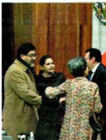
Sesión pública del TEPJF

EN CASO de que el Congreso vuelva a caer en omisión, el INE podrá emitir lineamientos para garantizar la paridad de género