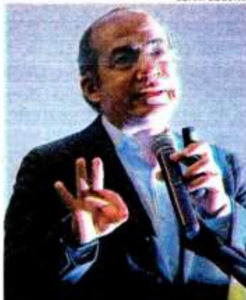
El ex presidente Calderón se lanza contra los presidentes del PRI y PRD.

"Una foto dice más que mil palabras. Los mismos que fueron derrotados en el 2018 por paliza y han perdido 22 gubernaturas en 5 años, van en ler lugar en las listas para el senado de la "oposición"... cómo va eso de no entienden que no entienden? Y por cierto...los ciudadanos?", señaló en un mensaje junto a una foto donde aparecen sonrientes los tres líderes partidistas.