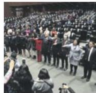
Protesta. Los nuevos perfiles para el Tribunal Federal de Justicia Administrativa, ayer.