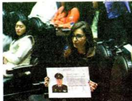
Laura Ballesteros, senadora de Movimiento Ciudadano

La Ley Orgánica del TFJA indica que para ser magistrado es necesario tener una experiencia profesional mínima de ocho años en materia fiscal, administrativa o de fiscalización, responsabilidades administrativas, hechos de corrupción o rendición de cuentas, además de que el Presidente debe hacer "una justificación de la idoneidad".