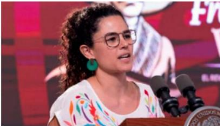
La desaparición de los órganos autónomos, serán discutidas con la Secretaria de Gobernación, Luisa María Alcalde.