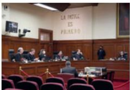
Sostuvieron que actuaron conforme a la Ley de Amparo.

Finalmente, la SCJN también argumentó que la votación encuentra precedente en el amparo directo en revisión 5102/2021, cuando la Segunda Sala declaró legal el impedimento del ministro Luis María Aguilar Morales para conocer un asunto. Según detalló, en esa ocasión la ministra Yasmín Esquivel Mossa emitió el "voto de calidad" al ser entonces la presidenta de la sala. ●