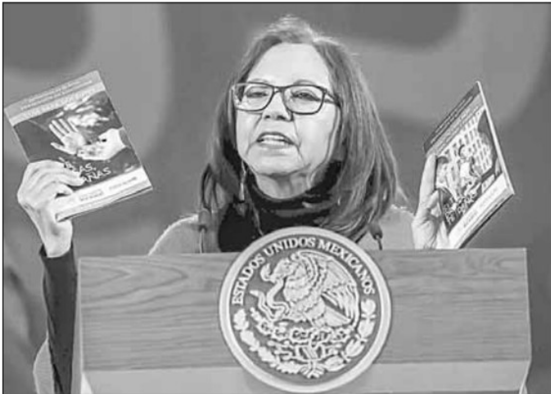
▲ La secretaria de Educación, Leticia Ramírez, estuvo presente en la conferencia mañanera.