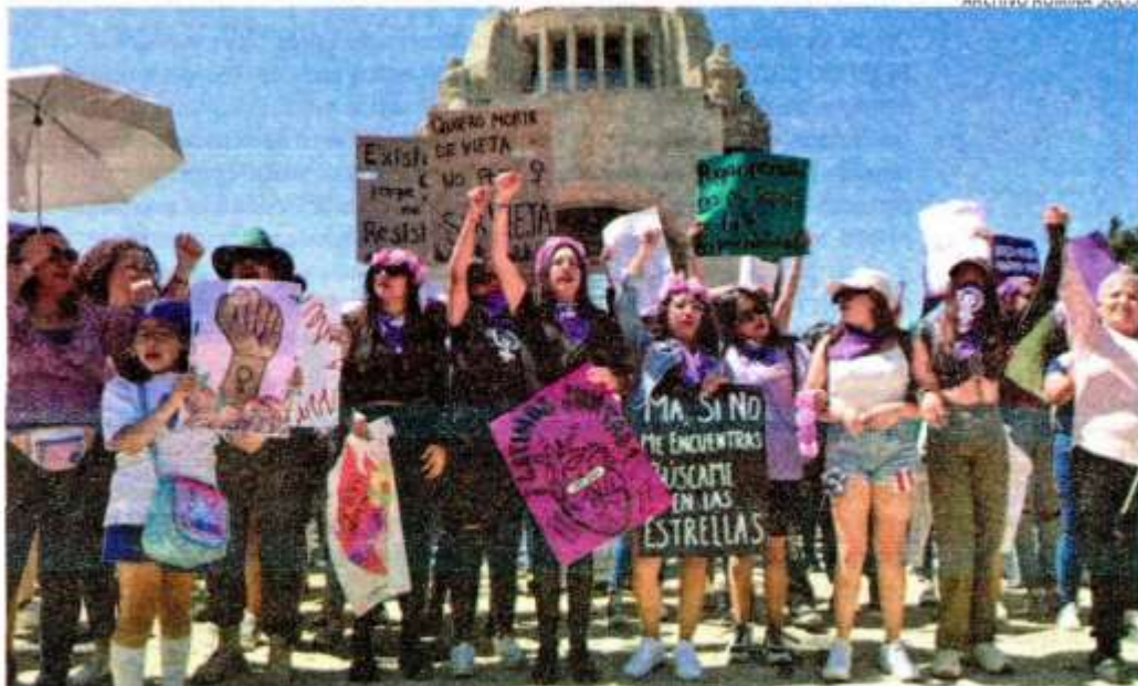
Aspecto de la marcha con motivo del Día internacional de la mujer de 2023, en la Ciudad de México