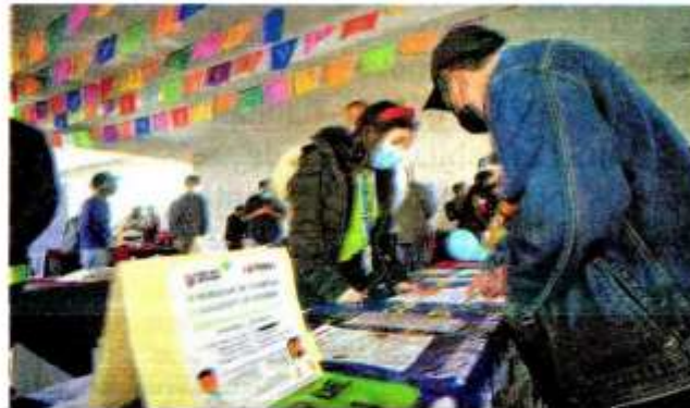
Los días 5 y 12 de marzo se llevarán a cabo las Microferias de Empleo en la Alcaldía Azcapotzalco

Quienes cuentan con bachillerato o carrera técnica pueden encontrar vacantes como ejecutivos de ventas, almacenistas,