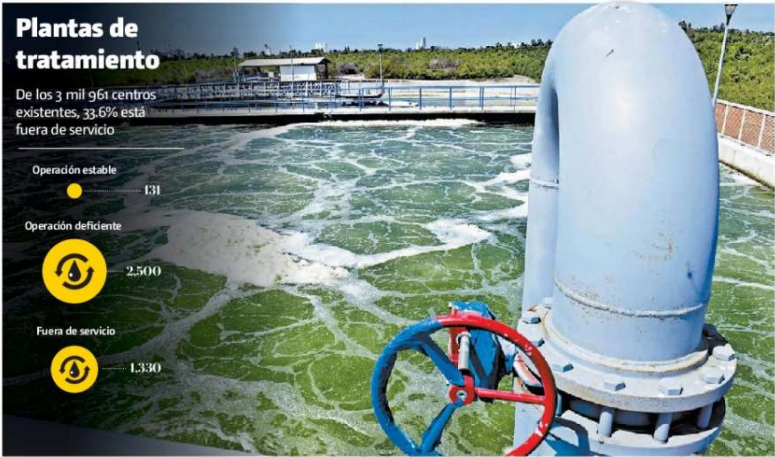
FUENTE: Cámara de Diputados • FOTOGRAFÍA: Cuartoscuro • GRÁFICO: Alfredo San Juan