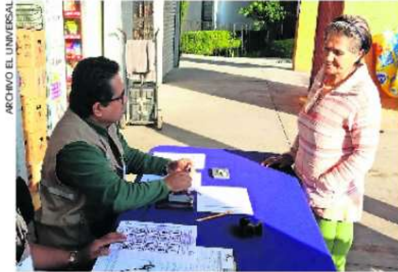
La consulta popular es el instrumento de participación de la ciudadanía en temas de interés nacional o local.