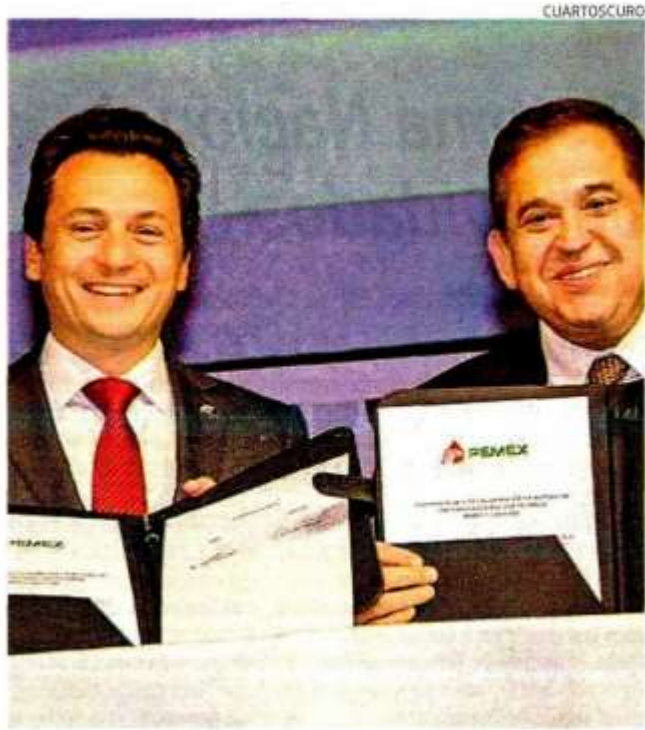
Quando se firmó la compra de la empresa para hacer fertilizantes.