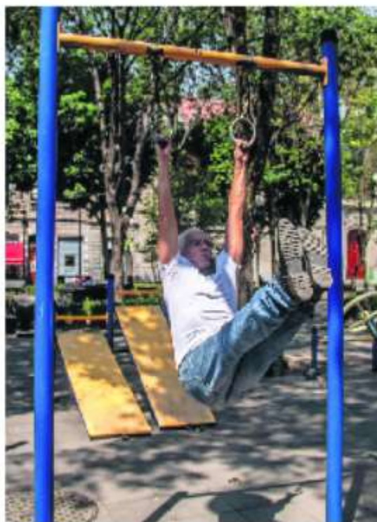
México tiene infraestructura deportiva abandonada, reportan.

Económicos (OCDE). Las naciones que la conforman dedican 8.4% de su presupuesto total en salud, al tratamiento de enfermedades relacionadas con la obesidad, así como prevención e inhibición de consumo de productos dañinos. ●