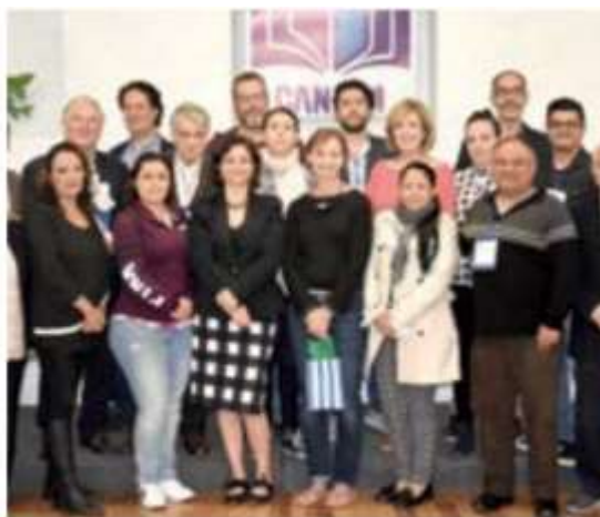
LABOR. En la imagen, parte del equipo que integra la Cámara de la Industria Editorial Mexicana.