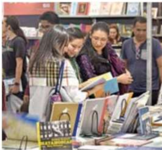
SECTOR. En México las ediciones con mayor participación en la venta total son las de educación básica.