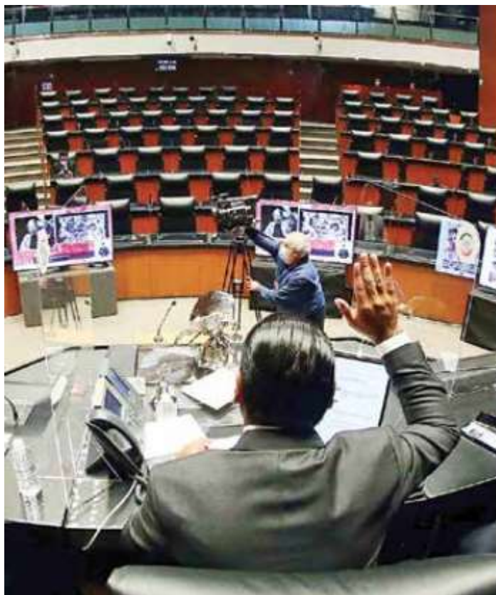
El trabajo a distancia en el Senado es más frecuente.