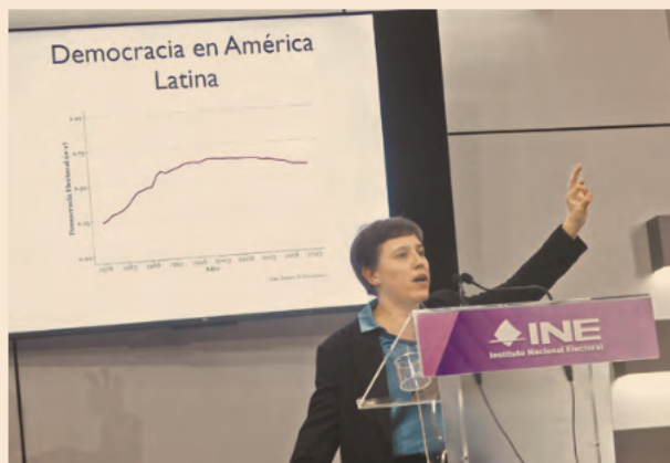
La académica presentó la conferencia “Integridad electoral y mecanismos para contener la erosión democrática”, en el INE.

Asimismo, sostuvo que otros problemas como la incapacidad gubernamental para resolver problemas críticos de una nación como lo son la inseguridad, inequidad o corrupción, y la débil representación de la ciudadanía a través de los partidos políticos, son factores que