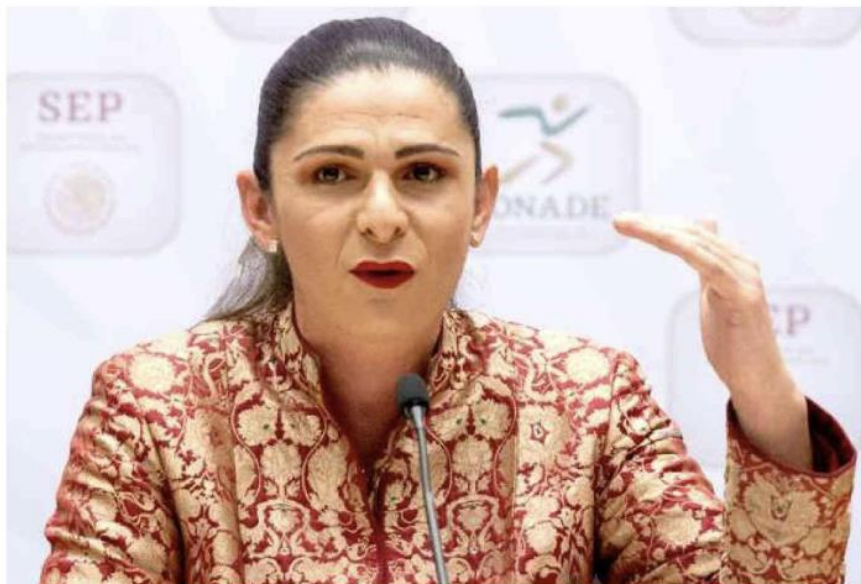
Ana Gabriela Guevara Espinoza

La auditoría encontró que tan sólo en 2020 hubo 18 actos distintos de posible corrupción y mal manejo de recursos en distintos contratos y servicios adquiridos por la Conade.