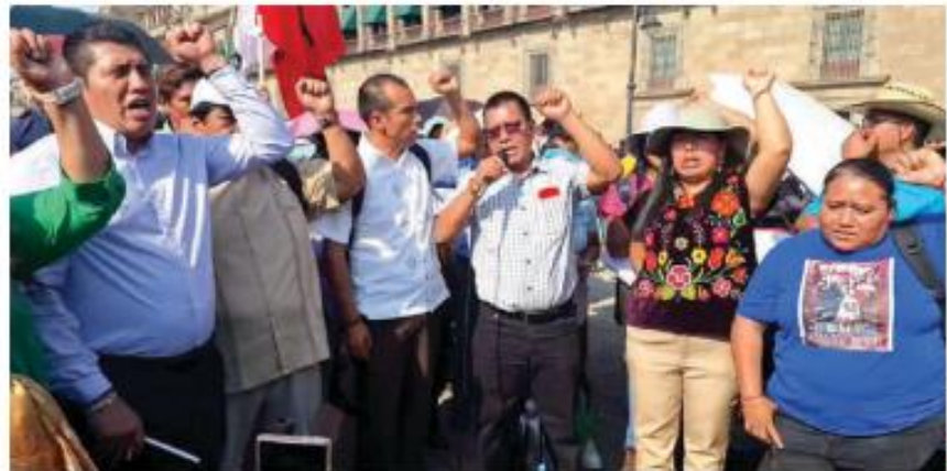
MITIN de integrantes de la Coordinadora, ayer, afuera de Palacio Nacional.

DESPUÉS DE 4 AÑOS suspendido, representantes el magisterio disidente son recibidos en Palacio Nacional; piden alza salarial y abrogación de las reformas educativa y al ISSSTE