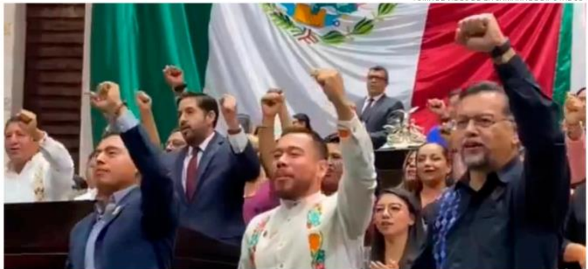
TOMA DE VIDEO DE LA CÁMARA DE DIPUTADOS

Al aprobarse en sus términos, el documento fue enviado al Ejecutivo federal que podrá publicar incluso esta misma semana