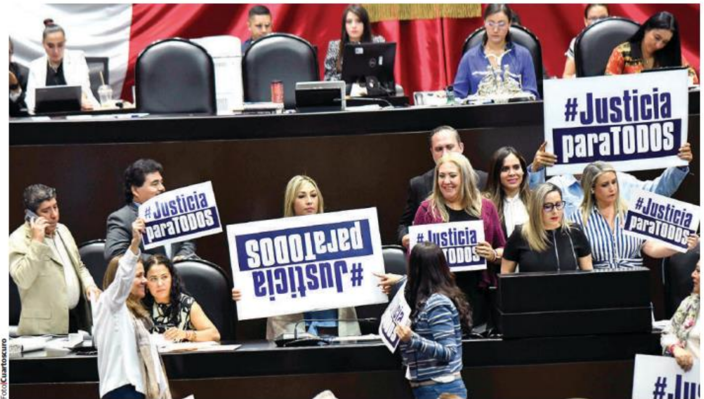
LEGISLADORES DE OPOSICIÓN se manifestaron en contra de las reformas desde la tribuna, ayer.