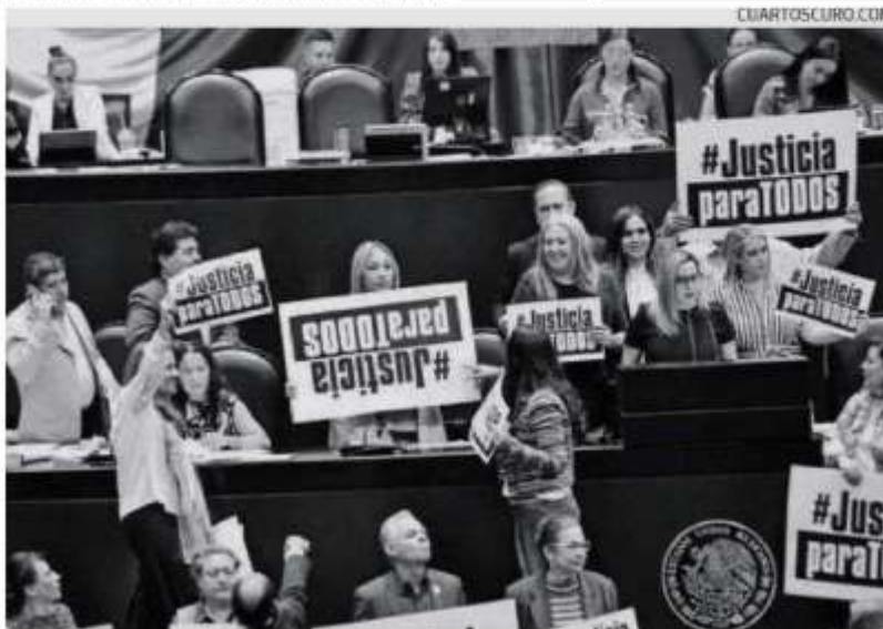
La oposición rechazaron la reforma

"Ustedes intentan con esta reforma darle facultades que no están establecidas en la Constitución"