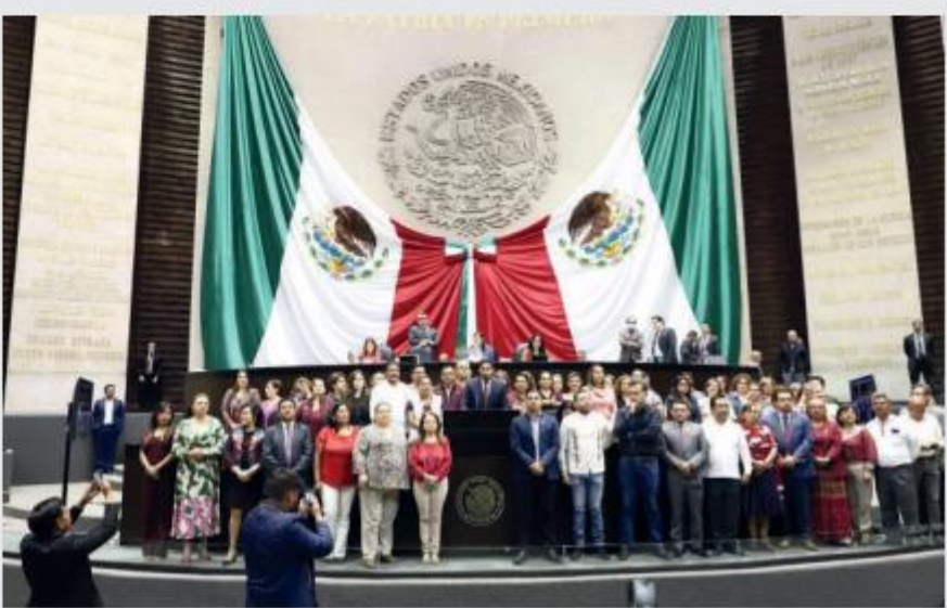
Morena y sus aliados aseguran que no se reduce su efecto protector.

En un debate de tres horas y media en la que predominaron las acusaciones y descalificaciones entre los diputados de oposición y los de la coalición 'Sigamos haciendo historia', la mayoría avaló las modificaciones a los artículos 129 y 148 de la Ley de Amparo, Reglamentaria de los artículos 103 y 107 de la Constitución Política, en materia de suspensión del acto reclamado e inconstitucionalidad de normas generales, y por la que se adicionó un último párrafo al artículo 148 para delimitar los efectos de la suspensión al