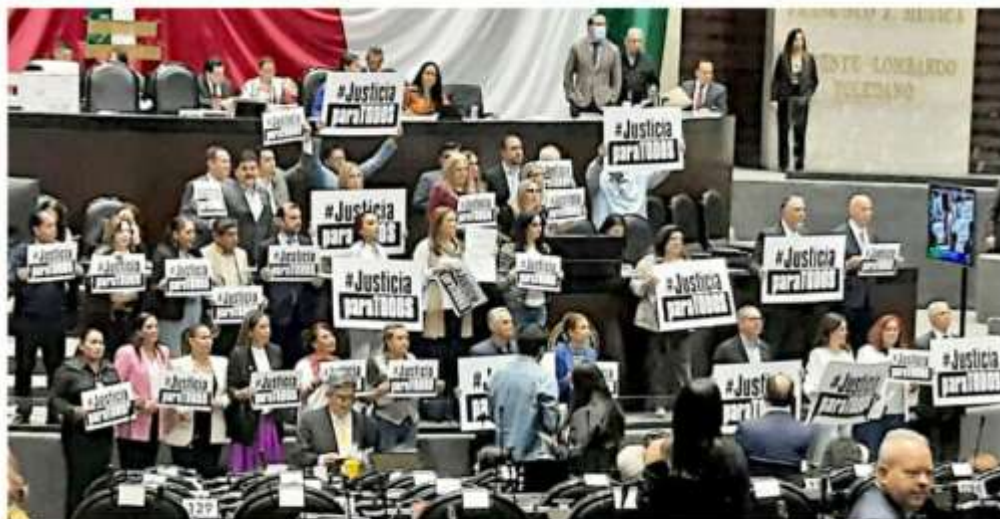
Legisladores de Oposición subieron a la tribuna de la Cámara de Diputados y exhibieron letreros con la leyenda #JusticiaParaTodos.

La reforma plantea derogar el último párrafo del artículo 129 de la Ley de Am-