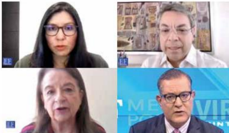
AHORRO PARA EL RETIRO. Expertos analizaron la situación en el EF Meet Point.

La ejecutiva de WTW puntualizó que será importante establecer políticas de inversión claras, que se cumplan bajo parámetros de un riesgo moderado o mínimo..