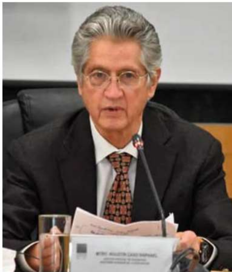
Despedido. Agustín Caso Raphael, auditor especial de la ASF, en foto de archivo.

Caso afirma que la auditoría manipula resultados para no molestar al gobierno