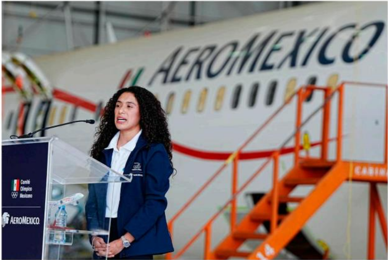
Una alianza de fuerza y altura.