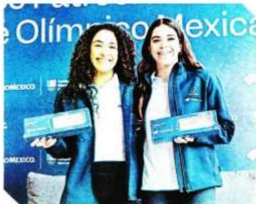
Las clavadistas son algunas candidatas para ser abanderadas para la ceremonia de inauguración.

"Se tomará en cuenta los resultados en el ciclo olímpico, cómo ha sido su desempeño como atletas dentro y fuera de la alberca, 'chiiin, ya me resbalé', de los escenarios", dijo entre risas.