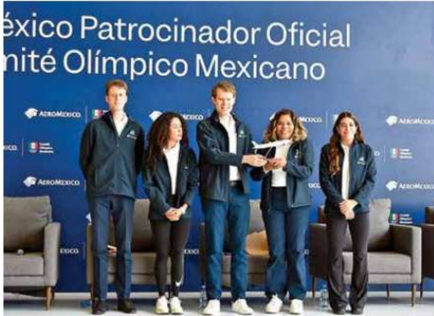
Aeroméxico se ha distinguido por apoyar al deporte nacional, entre muchos otros ámbitos, como la cultura y la educación.