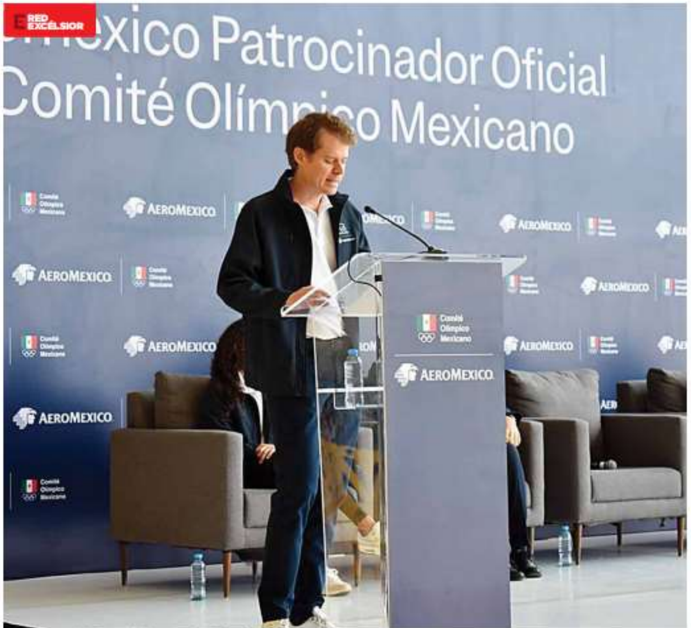
La aerolínea reconocerá a los atletas galardonados con un vuelo redondo en Cabina Premier.