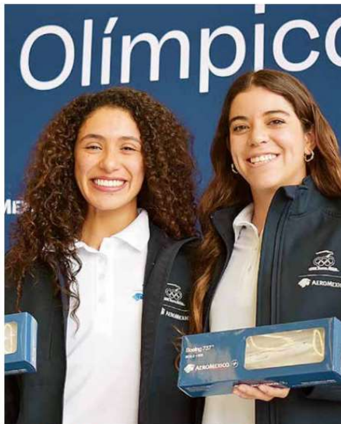
Antes, durante los Juegos Olímpicos de México 1968, Aeroméxico ya había sido la línea aérea oficial de la justa deportiva.