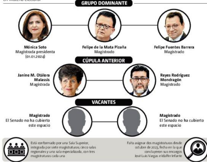
• FUENTE: TEPJF • INFORMACIÓN: Salvador Frausto • GRÁFICO: Moisés Butze

Órgano especializado del Poder Judicial de la Federación, encargado de resolver controversias en materia electoral