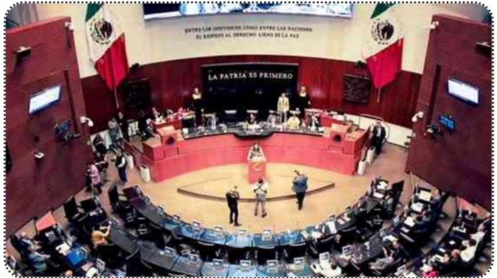
Cámara de Senadores del Congreso de la Unión

La senadora explicó que "los tiempos" del Congreso de la Unión se definen por el avance o no de los consensos que se logren entre los