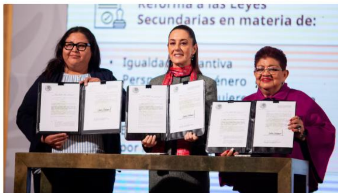
La presidenta Claudia Sheinbaum (centro), Citlalli Hernández (izquierda) y Ernestina Godoy (derecha) durante la firma del decreto en pro de las mujeres de este lunes. Con esta rúbrica concluye el ciclo de una serie de reformas presentadas a la Cámara de Senadores el 9 de octubre.

Durante ‘La Mañanera’ de este lunes, la presidenta Claudia Sheinbaum firmó un decreto con el que se pone fin a un ciclo de reformas a siete leyes en pro de la igualdad sustantiva de las mujeres . Estas modificaciones tienen que ver con cuatro ejes principales: igualdad sustantiva, perspectiva de género, derecho de las mujeres a una vida libre de violencias y erradicación de la brecha salarial por razones de género, explicó la mandataria.