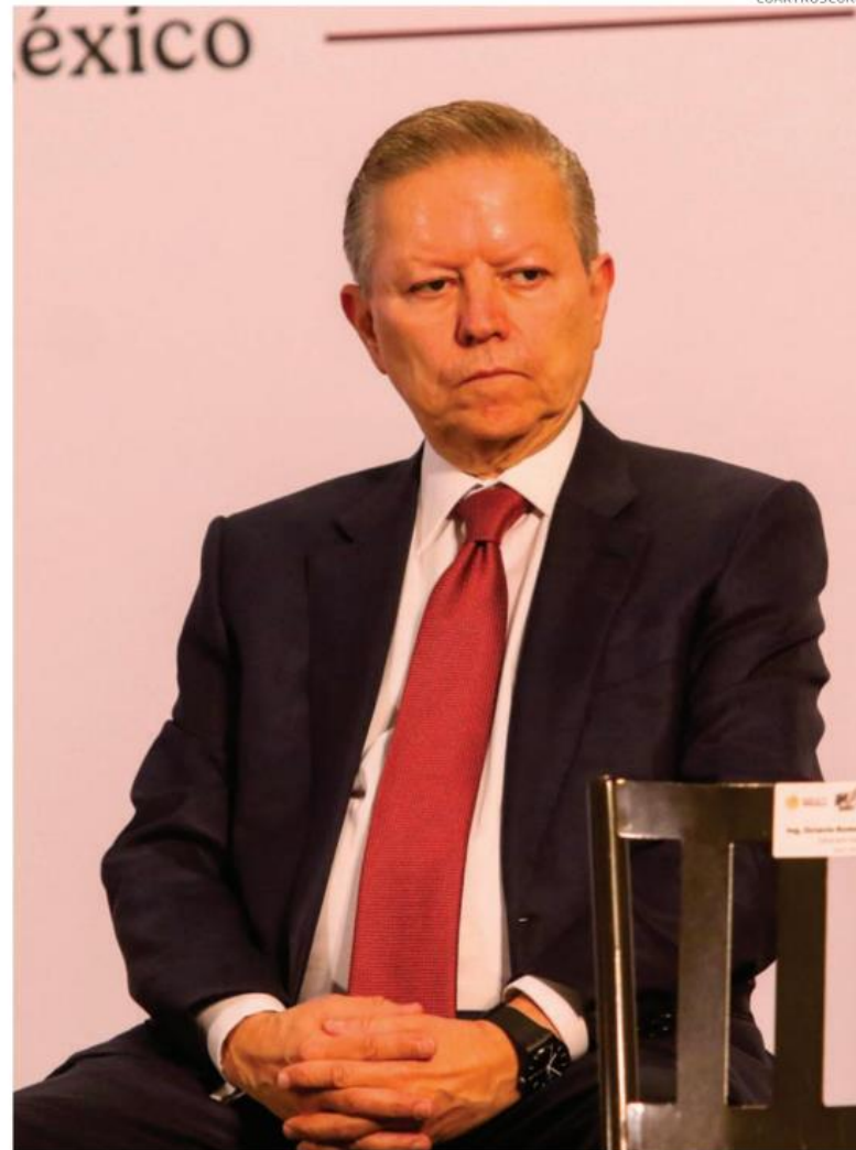
El coordinador general de Política de la Presidencia de México, Arturo Zaldívar, informó que pasaron a la siguiente etapa 11,015 aspirantes a ocupar un cargo en el Poder Judicial.

En el caso del tribunal de disciplina ju-