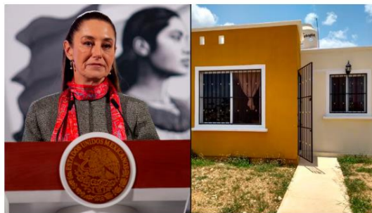
Sheinbaum explica reforma al Infonavit tras preocupación de trabajadores: “Sus ahorros están resguardados”

La presidenta Claudia Sheinbaum Pardo hizo un breve resumen sobre en qué consiste la reforma al Instituto del Fondo Nacional de la Vivienda para los Trabajadores ( Infonavit ) después de que hubiera cuestionamientos respecto a la posibilidad de que se utilicen los ahorros de los trabajadores para el desarrollo de proyectos inmobiliarios que estarán a cargo del instituto y la posibilidad de que desaparezca el tripartismo.