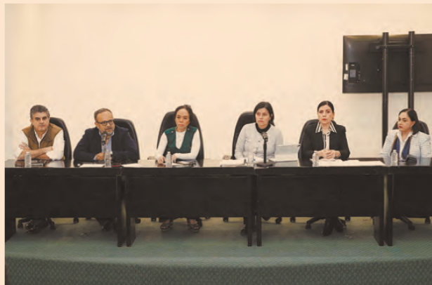
En conferencia de prensa, integrantes del Comité de Evaluación del Legislativo afirmaron que no hay violación a la ley.

“Sí se expidió por este Comité una lista con 7,060 personas elegibles. Adicionalmente y en paralelo, expedimos un boletín donde claramente expresamos que esta era la lista primaria y que habría una lista complementaria (...) Entonces, no hay violación a la ley de ninguna manera. No estamos dejando en estado de indefensión a las personas aspirantes porque, al contrario, les otorgamos todas las facilidades para que aportaran sus documentos, y la lista complementaria se expedirá en unas horas. Y, también, es atendiendo al principio de completitud, de completar el análisis de todas las pruebas que aportaron”, sostuvo.