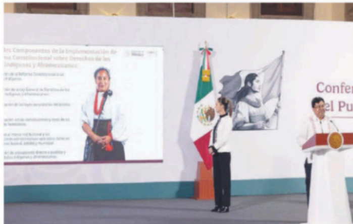
Adelfo Regino Montes, titular del Instituto Nacional de Pueblos Indígenas.

La reforma está organizada en seis componentes: traducción de ésta a las diversas lenguas indígenas, creación de ley general, armonización de leyes secundarias, adecuación en constituciones estatales, reformas administrativas y presupuesto directo.