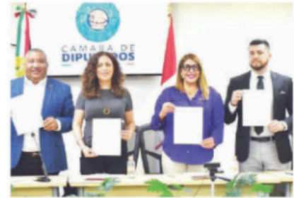
La firma del documento se realizó en la Cámara de Diputados.