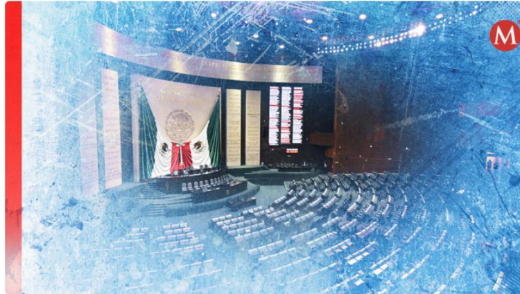
Morena, cámara de diputados, San Lázaro aprueba reformas constitucionales, iniciativas pendientes Cámara de Diputados

La mayoría parlamentaria de Morena y sus aliados en la Cámara de Diputados cumplieron la consigna de aprobar 16 reformas constitucionales de la llamada cuarta transformación en tres meses y medio del primer periodo de sesiones, pero dejaron en la 'congeladora' 546 iniciativas pendientes de análisis y dictamen.