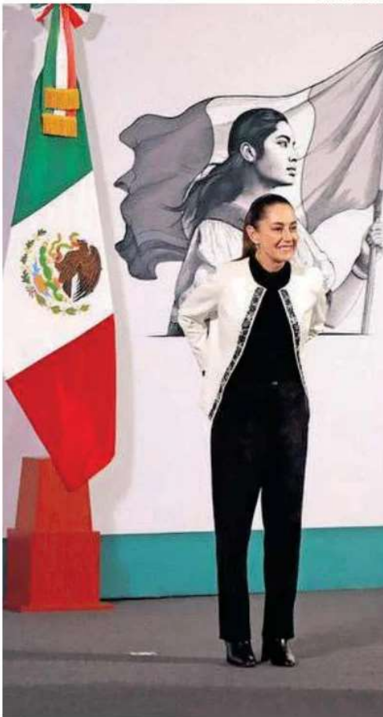
Claudia Sheinbaum en la conferencia matutina