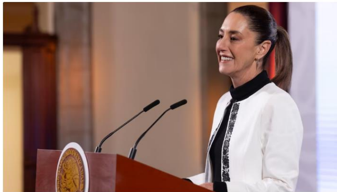
Sheinbaum criticó que los partidos de oposición reprochen el resultado de las elecciones del 2024.

La presidenta Claudia Sheinbaum Pardo hizo un llamado a que los partidos de oposición hagan una autocrítica sobre sus propios resultados en las elecciones que se realizaron el 2 de junio del 2024, en las cuales Morena ganó la mayoría de ambas cámaras del Congreso de la Unión, diversas gubernaturas y hasta la Presidencia de México, esta última por segunda vez consecutiva.