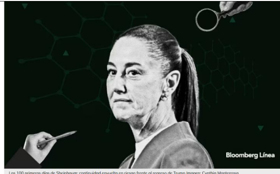
Los 100 primeros días de Sheinbaum: continuidad envuelta en riesgo frente al regreso de Trump

La presidenta de México, Claudia Sheinbaum, cumple 100 días al frente de México con una política de continuidad cargada de incertidumbre exacerbada por el regreso de Donald Trump a la Casa Blanca, de acuerdo con analistas