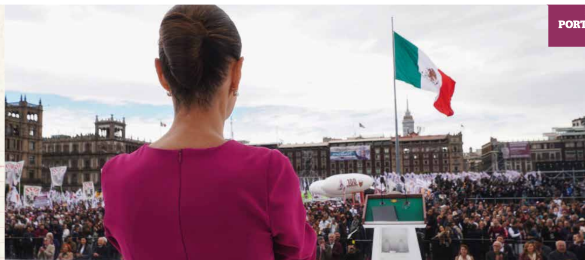
La misma multitud va cambiando Zócalo a Zócalo. Esta vez, en torno a la primera mujer presidenta en 200 años, la organización de los contingentes fue mayor.