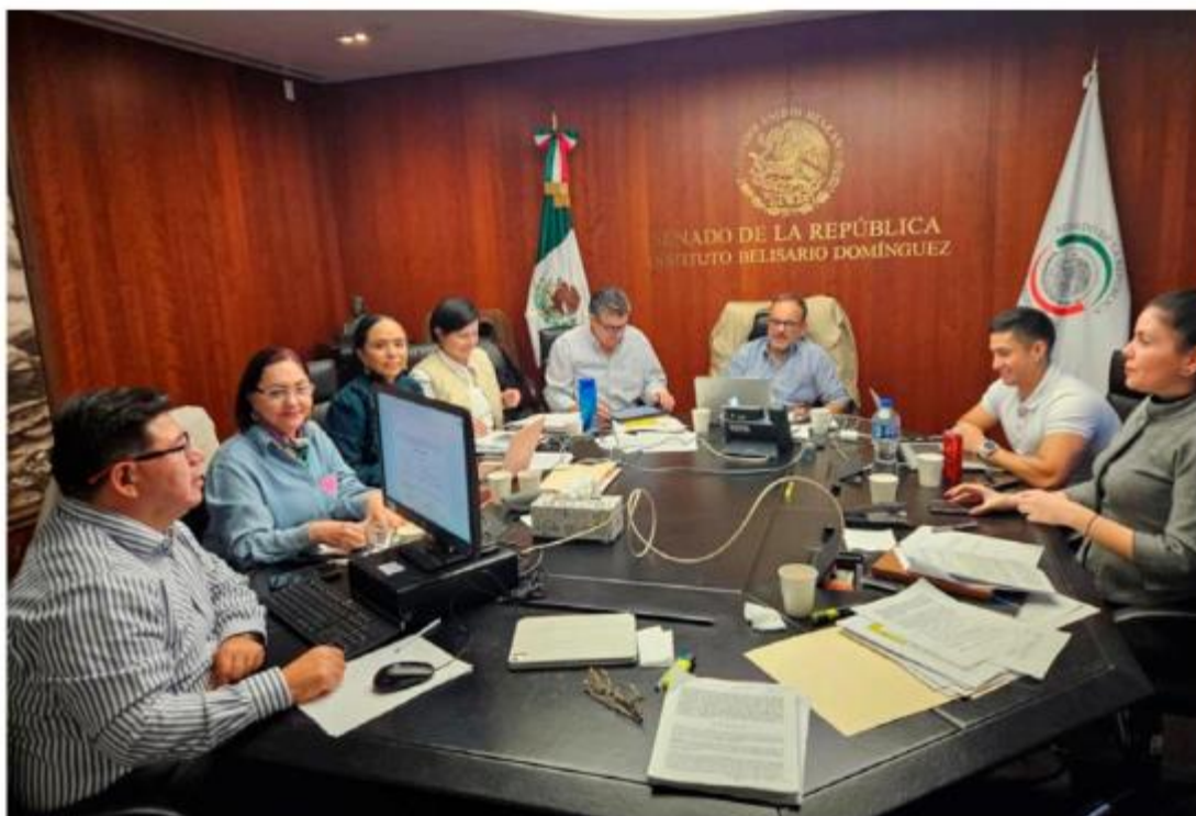
Comité de Evaluación del Poder Legislativo Federal.