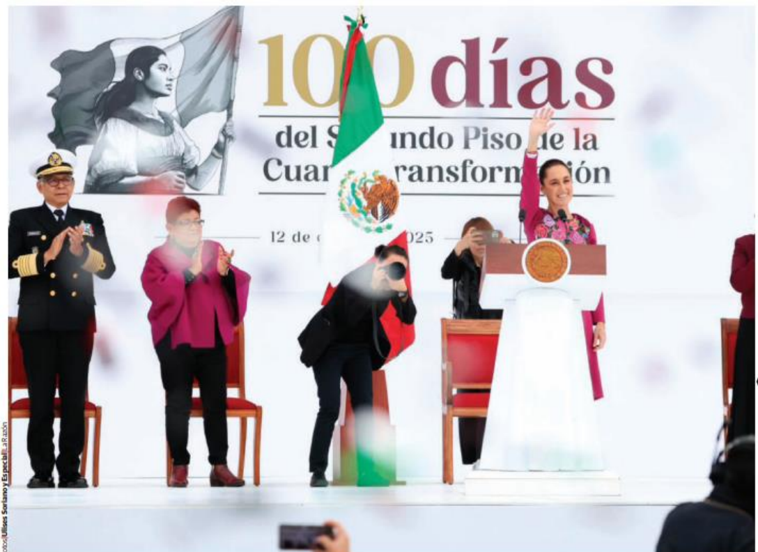
LA PRESIDENTA Claudia Sheinbaum, ayer, en el Zócalo de la Ciudad de México.