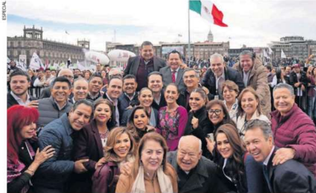
Gobernadores, incluidos los de oposición, muestran su apoyo a la presidenta Claudia Sheinbaum ante las amenazas que representa el próximo gobierno que encabezará Donald Trump.

Hasta adelante estaban los gobernadores morenistas y atrás de la primera valla, en la segunda zona exclusiva, fueron sentados senadores y diputados de Morena y sus aliados, además de funcionarios del gobierno y líderes del partido guinda.