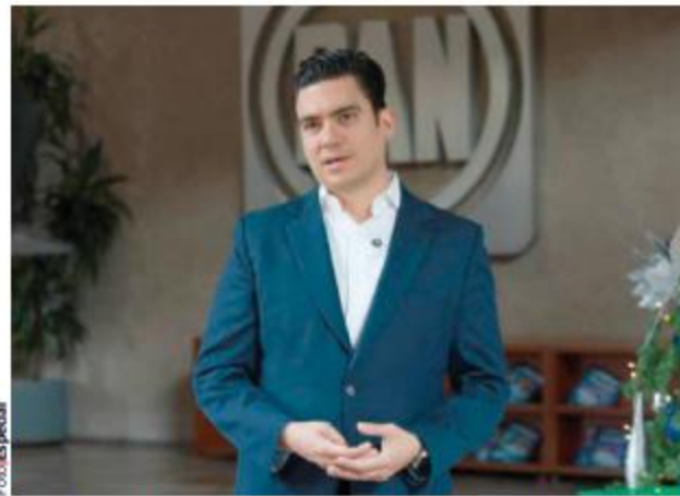
EL LÍDER da discurso navideño, el 23 de diciembre del 2024.

En caso de que consigan las asociaciones ser partido, ¿no se dividen las simpatías con la ciudadanía? Es difícil decirlo, ya que no hay un precedente, pero yo creo que no por lo que hace el PAN, ya que somos un partido de centro-derecha y humanista, pero el Frente Cívico es de corte social demócrata; por ello es diferente. Ellos serían el receptor de todos los de izquierda que no creen en la Cuarta Transformación, por eso creo que somos elementos complementarios en una lucha social.