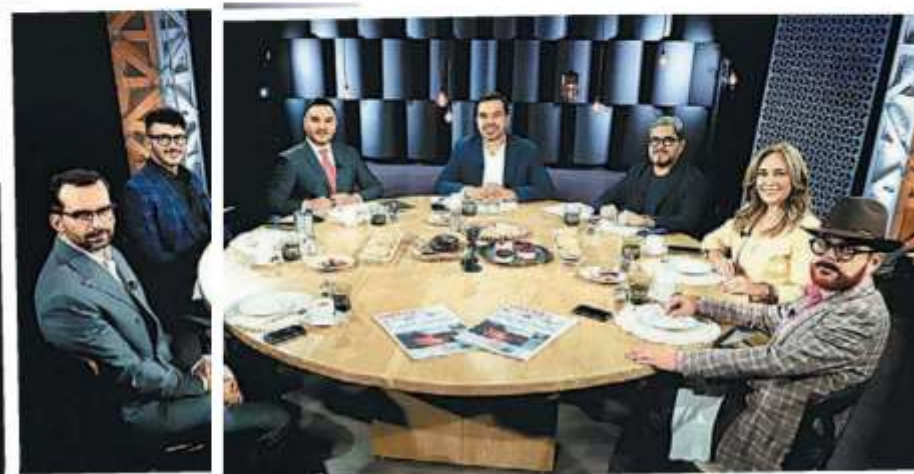
El ex candidato contó a periodistas de MILENIO-Multimedios los avances electorales en varios estados. ARIELOJEDA