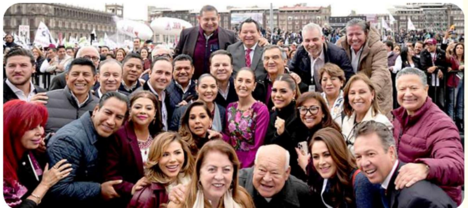
La presidenta Claudia Sheinbaum, con gobernadores y militantes morenistas