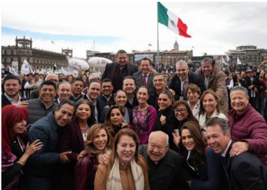
Con los gobernadores de todos los partidos