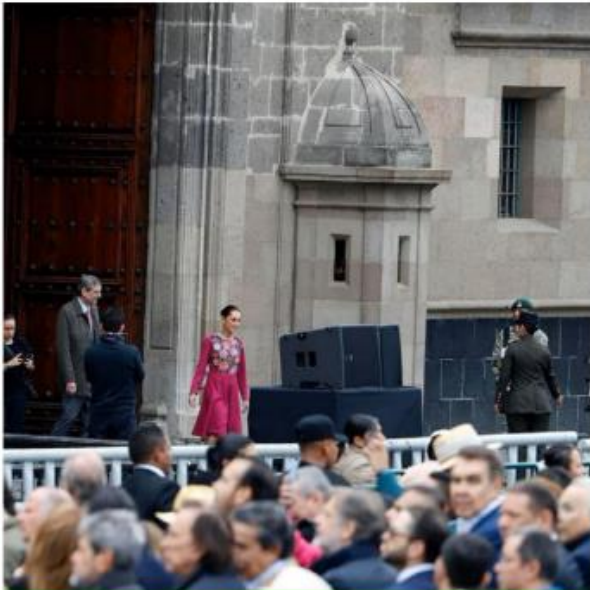
Claudia Sheinbaum, Presidenta de México, rindió ante miles de simpatizantes el informe de sus primeros 100 días de gobierno

“Estoy convencida que la relación entre México y Estados Unidos será buena y de respeto y que prevalecerá el diálogo nuestra visión es el humanismo mexicano la fraternidad entre los pueblos y entre las naciones”.