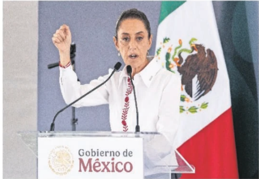
La presidenta Claudia Sheinbaum Pardo encabezó ayer domingo la entrega de tarjetas de las Pensiones Bienestar en Chinantla, Puebla.

Ariadna Montiel, secretaria de Bienestar, también aseguró que los migrantes “no están solos” y se defenderán sus derechos. ●