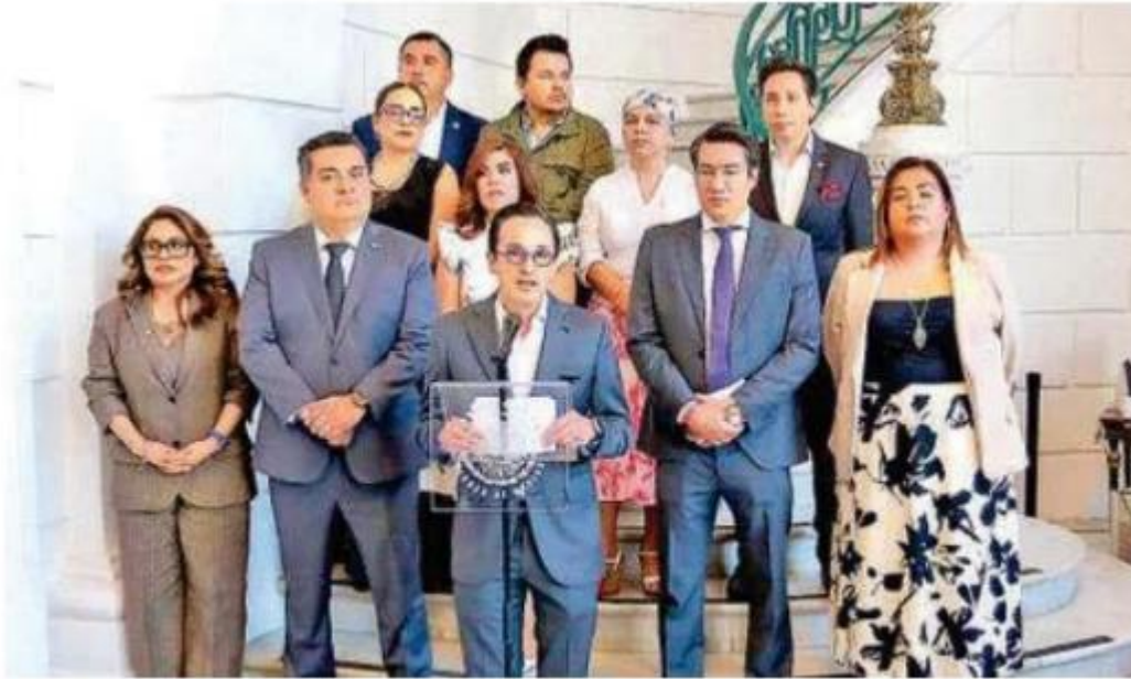
El PAN en el Congreso de la CdMx presentó una iniciativa que reforma a la Ley Federal del Trabajo y al Código Penal Federal