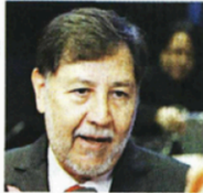
El senador Gerardo Fernández Noroña.

“La ley nos prohíbe expresamente a políticos, partidos llamar a votar por alguna persona o llamar a no votar por alguna persona, eso sí estaría violentando la ley, pero que los Poderes convoquen a votar eso sí me parece que es un exceso y lo vamos a