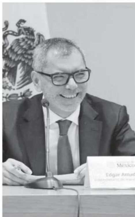
En enero, el secretario descartó una recesión