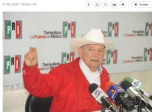
El exgobernador Manuel Cavazos dio declaraciones polémicas sobre las acusaciones que hay sobre Cuauhtémoc Blanco

Manuel Cavazos Lerma, exgobernador del estado de Tamaulipas , se convirtió en tema de conversación en redes sociales , luego de que, en una conferencia de prensa, señalara que la hermana de Cuauhtémoc Blanco “no está muy violable” .