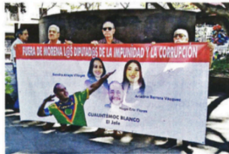
Integrantes del Colectivo Cuernavaca pidieron ayer a la Fiscalía de Morelos que retome el caso contra Blanco.

rompió les corta las plantas de los pies a muchas mujeres que siguen violentadas".