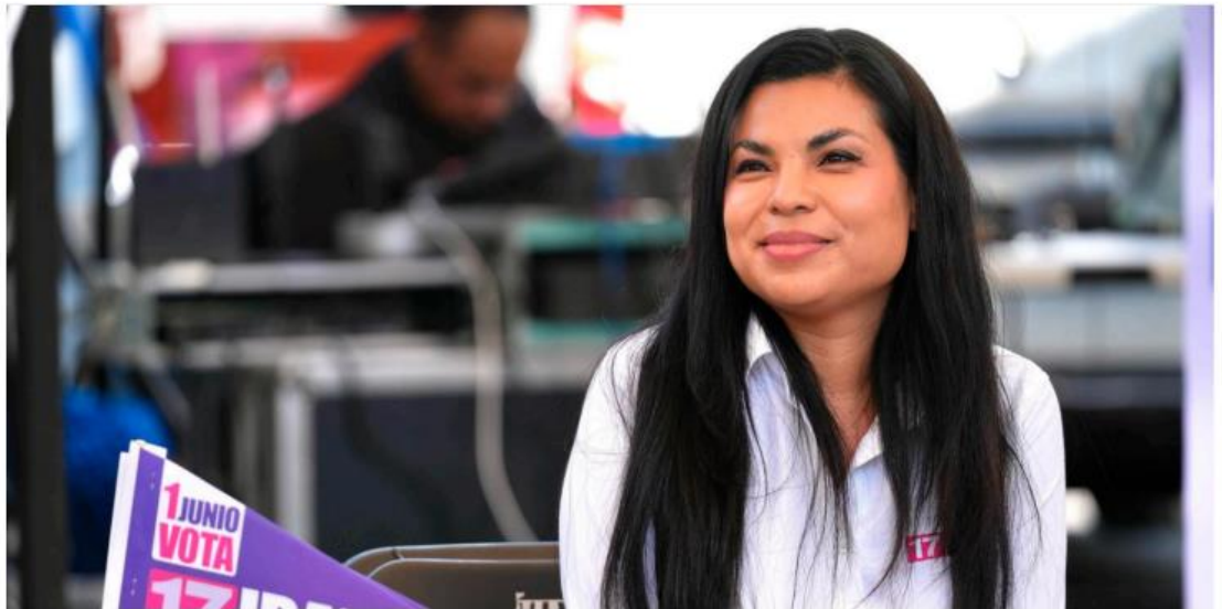
Ibarra visitó las instalaciones de Crónica al arranque de su campaña

Eidalid López y Arturo Ramos Ortiz nacional@cronica.com.mx