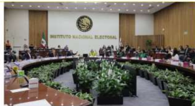
© 2025. Todos los derechos reservados. No se permite la explotación económica ni la transformación de esta obra. Queda permitida la impresión en su totalidad. 1 Abril, 2025 • Redacción La-Lista

Integrante del partido Morena aseguran que los esfuerzos del INE no serán suficientes para que la ciudadanía esté enterada de la elección del 1 de junio