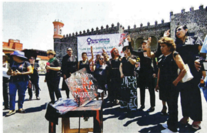
Mujeres protestaron ayer Frente al Palacio de Cortés, en Cuernavaca, para repudiar la protección al diputado morenista Cuauhtémoc Blanco.

"Se vinieron abajo conquistas como la igualdad sustantiva, la equidad y la perspectiva de género, derechos adquiridos por el movimiento feminista como resultado de una larga lucha y ese famoso techo de cristal que se