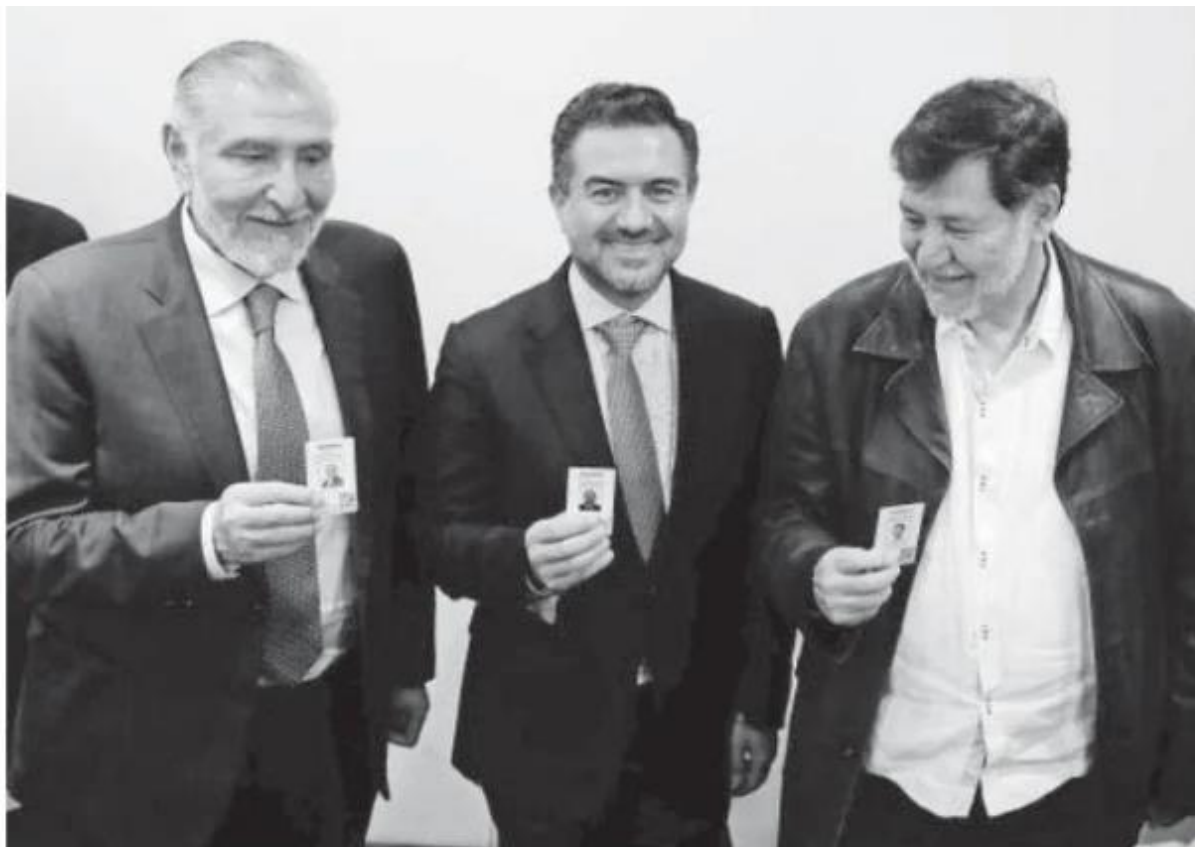
MIGUEL ÁNGEL YUNES SENADOR

“El objetivo fue aportar, no provocar debate interno, ni mucho menos división”