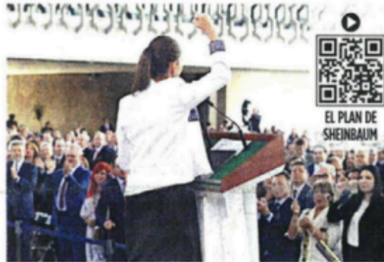
Sheinbaum fue respaldada ayer por legisladores de la 4T, empresarios y líderes sindicales.