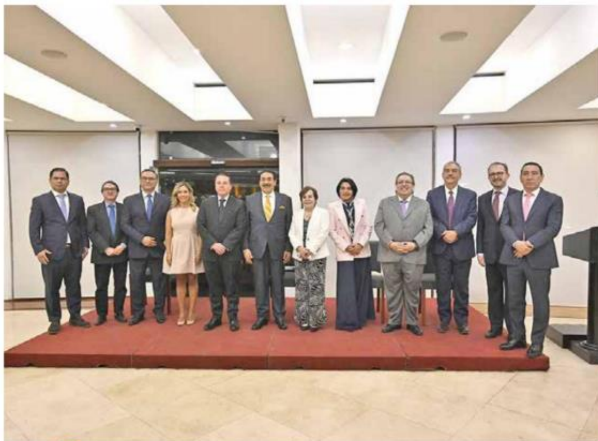
CENTRO ASISTENCIAL LIBANÉS