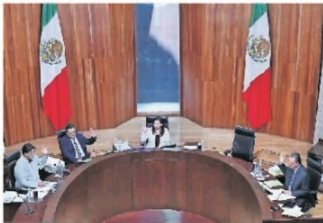
Entre las impugnaciones, 24 casos han sido turnados a los magistrados del Tribunal Electoral.

Entre las personas que han presentado impugnaciones están la presidenta Claudia Sheinbaum, así como la gobernadora del Estado de México, Delfina Gómez, y el mandatario de Oaxaca, Salomón Jara. También destacan los juicios interpuestos por Morena, la Cámara Baja, el Senado y legisladores en lo individual, así como las ministras Yasmín Esquivel y Loretta Ortiz.