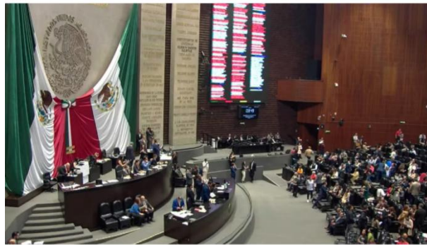
Cámara de Diputados 'da carta blanca' a Ejército; no tendrán que transparentar contratos en construcción de obras

La mayoría legislativa en la Cámara de Diputados aprobó ayer la reforma a la Ley de Obras Públicas y Servicios Relacionados con las Mismas , que contempla la eliminación del sistema electrónico conocido como CompraNet y exenta a las Fuerzas Armadas de las obligaciones de transparencia en esta materia.