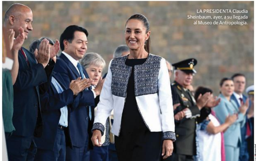
LA PRESIDENTA Claudia Sheinbaum, ayer, a su llegada al Museo de Antropología.

EXENCIÓN de tarifas, por buena relación con EU y fuerza del Gobierno y el pueblo, destaca; va por condiciones preferenciales en autos, acero y aluminio en próximos 40 días.