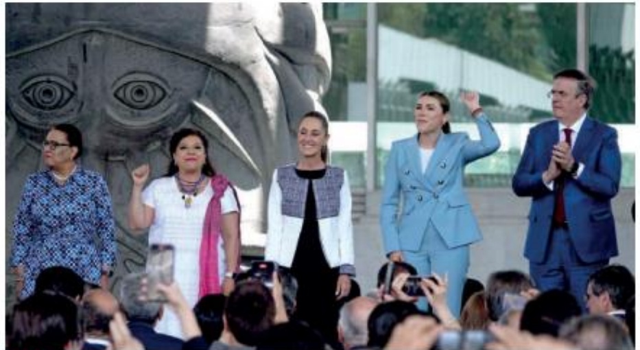
La presidenta desde el Museo Nacional de Antropología e Historia.

T ras librar los graváme- nes recíprocos de este 2 de abril, cómo lo había adelantado, la presidenta Claudia Sheinbaum Par- do respondió a los aranceles al acero, aluminio e industria automotriz im- puestos por el presidente de Estados Unidos, Donald Trump, con un pro- yecto "integral" que tiene como base el 'Plan México' —anunciado el 13 de enero pasado— y que en 18 puntos plantea el aceleramiento de su im- plementación a través de los sectores energéticos, la construcción como base de la generación de empleos, la simpli- ficación de trámites para la atracción de inversión, la tecnificación del cam- po para impulsar la soberanía alimen- taria y recuperar la vocación industrial del país para producir en México lo que