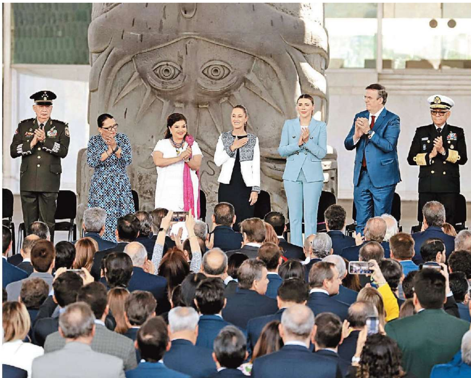
La mandataria durante la presentación del proyecto económico junto a su gabinete legal y ampliado, gobernadores, legisladores y empresarios. ARIEL OJEDA