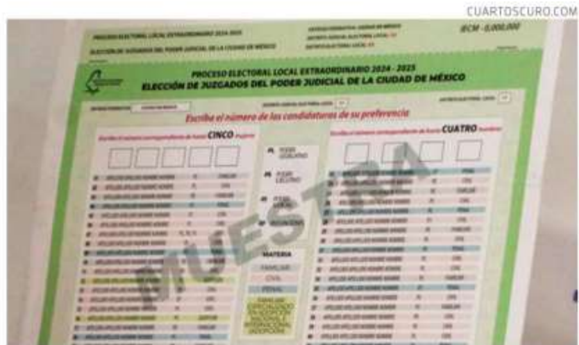
Boleta para la elección judicial.

En el micrositio https://ine.mx/eleccion-del-poder-judicial-de-la-federacion-2025/ del Instituto Nacional Electoral (INE), los electores y la ciudadanía en general podrán en los próximos días practicar cómo deben tachar a sus candidatos preferidos para jueces, magistrados y ministros, un total de