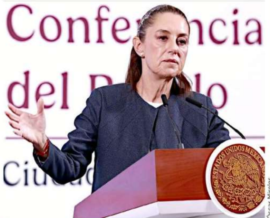
■ En su mañana en Palacio Nacional, la Presidenta Claudia Sheinbaum trazó las prioridades de la agenda legislativa.

“Eso sí, queremos que quede ya en este periodo, a más tardar se envía el lunes de la próxima semana; queremos simplificar, no solamente es un cambio de visión, sino simplificar y que no sea tan onerosa la comisión antimonopolio que sustituye a la Cofece. Se presentará esta misma semana o a principios de la próxima, a más tardar”, dijo.