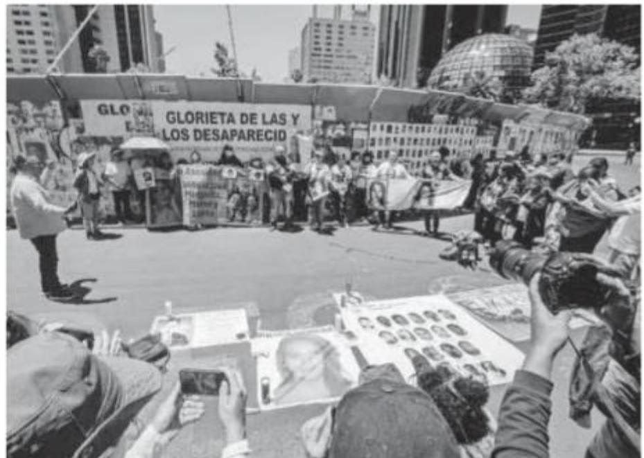
Familias buscadoras llaman a la unificación nacional contra la desaparición

Este lunes 14 de abril distintos colectivos de familiares de personas desaparecidas se dieron cita en la Glorieta de