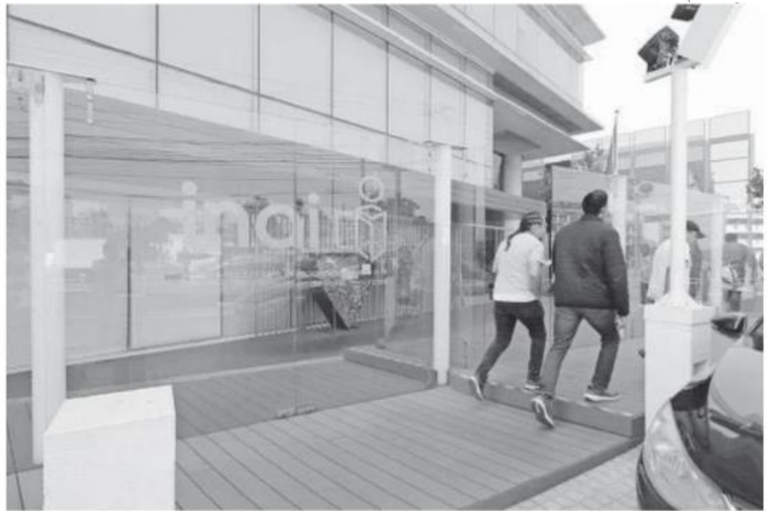
Algunos trabajadores del Inai irán a la nueva Secretaría Anticorrupción y Buen Gobierno