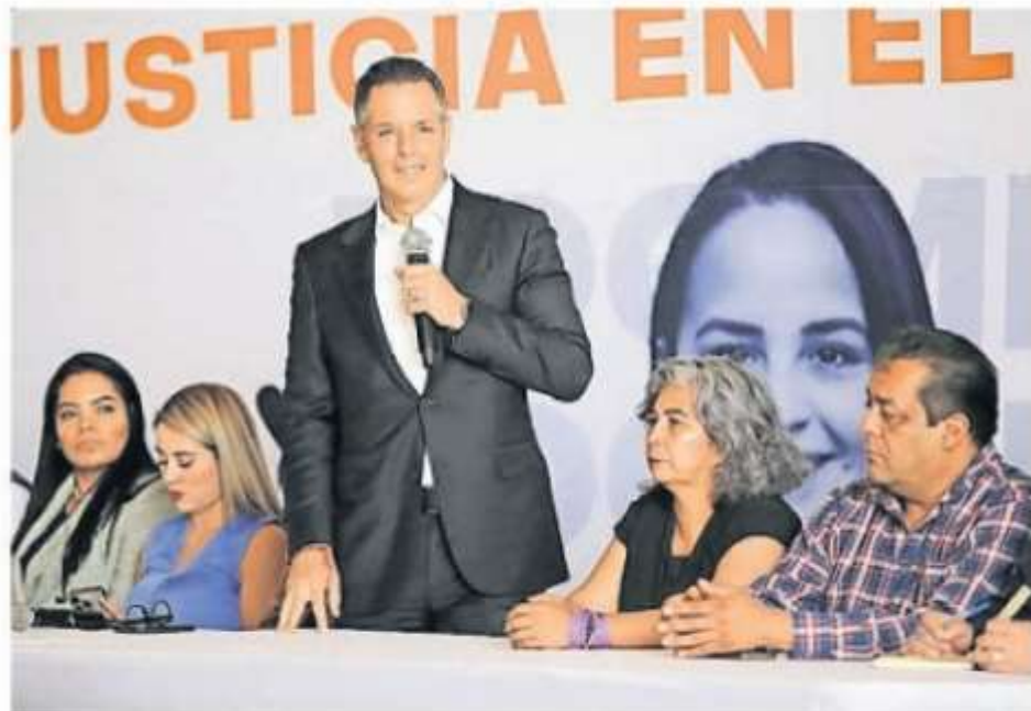
El senador Alejandro Murat en la conformación de los comités para promover los comicios; también se sumaron CTM, SNTE y universidades.

registra la cuenta de Ramírez Cuéllar creada para fortalecer el movimiento de la 4T.