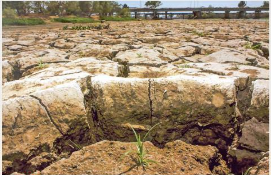
AFECTADOS. Los 20 municipios sinaloenses enfrentan la escasez de agua desde mayo pasado.

meses han pasado desde el inicio de la sequía, por lo que el Gobierno estatal demandó apoyo