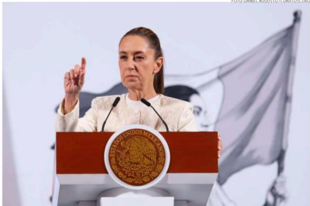
La presidenta Claudia Sheinbaum, responde las preguntas de la prensa durante la conferencia matutina .

La presidenta Claudia Sheinbaum hizo un llamado enfático a toda la ciudadanía para participar en la elección del Poder Judicial que se llevará a cabo el próximo 1 de junio. Aseguró que este ejercicio democrático no solo representa un hecho sin precedentes en la historia de México, sino que también coloca al país como un ejemplo para el mundo. Según sus palabras, nunca antes en ninguna otra nación se había dado un nivel de apertura y participación como el que se vivirá con esta elección. “Es un parteaguas en la historia de México y un ejemplo al mundo de que México es el país más demo-