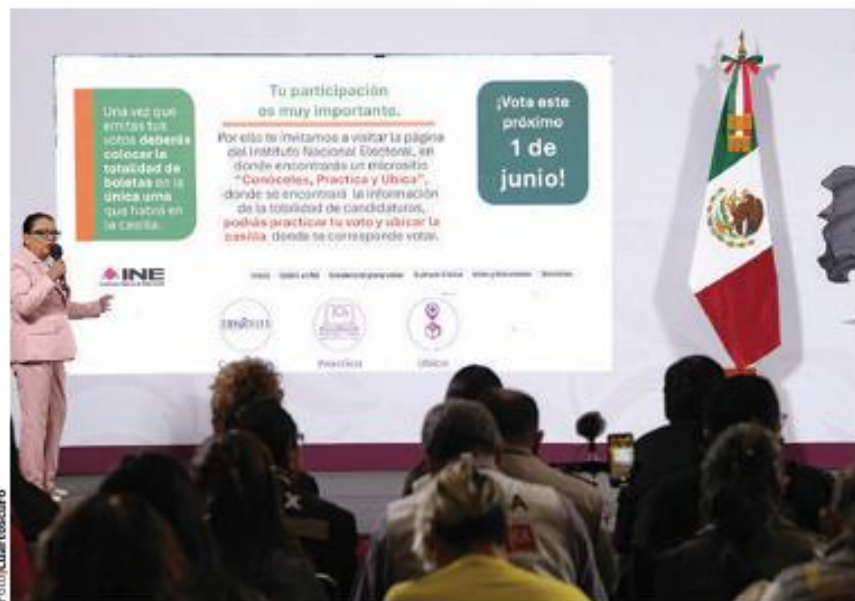
ROSA ICELA Rodríguez, secretaria de Gobernación, ayer, en conferencia de prensa.

LA SECRETARIA de Gobernación, Rosa Icela Rodríguez, recuerda que los Poderes de la Unión pueden promover la participación; la próxima semana se explicará la función del PJ: CSP